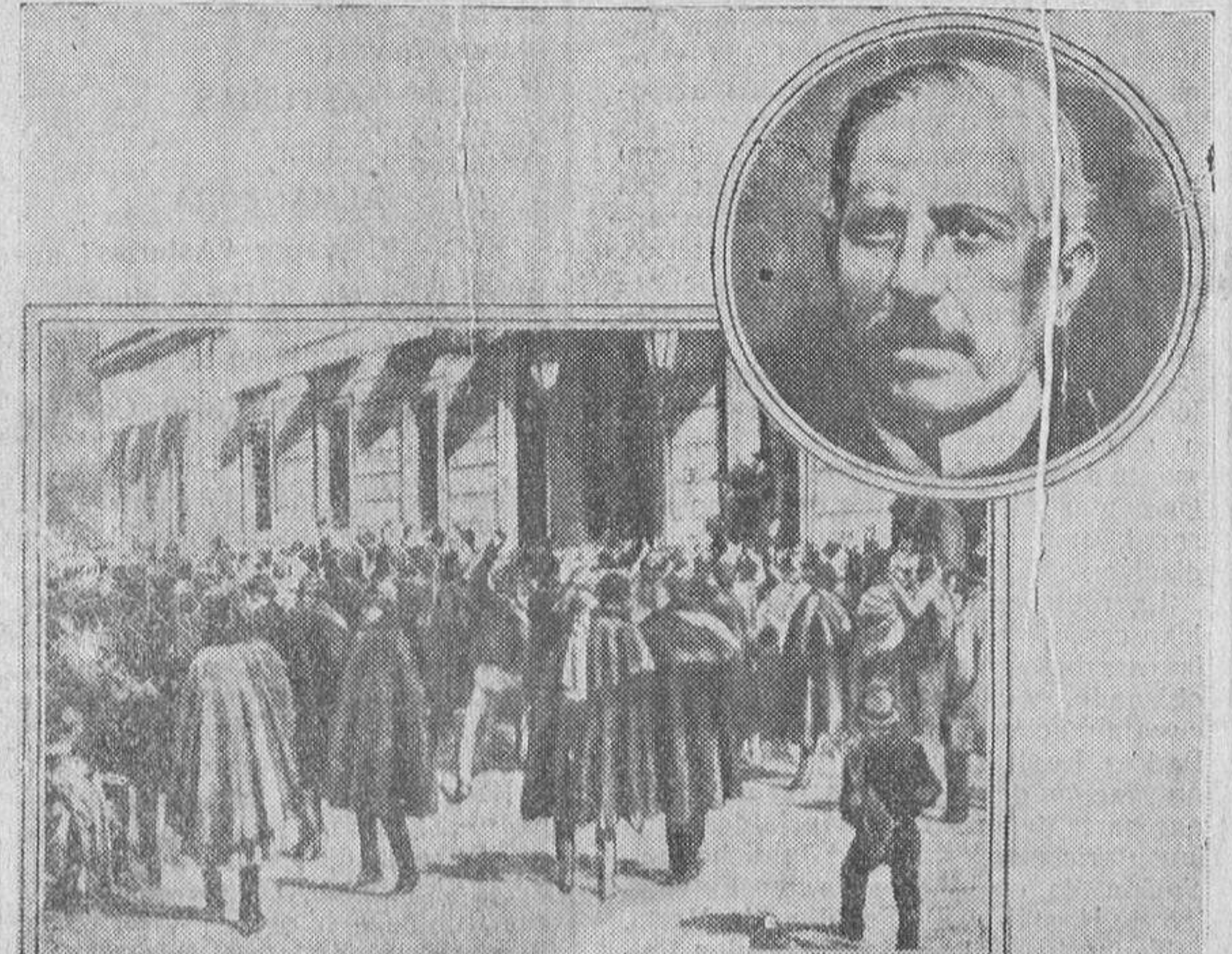
En el círculo, arriba, don Estanislao Figueras, primer presidente del Poder Ejecutivo de la primera República española.—Abajo, la multitud, en la tarde del 11 de Febrero de 1873, frente al Congreso, aclamando a Figueras, que habla desde una de las ventanas de la Cámara, momentos antes de proclamar las Cortes, la República.

Por 319 votos contra 32, se aprueba la propuesta. La República queda