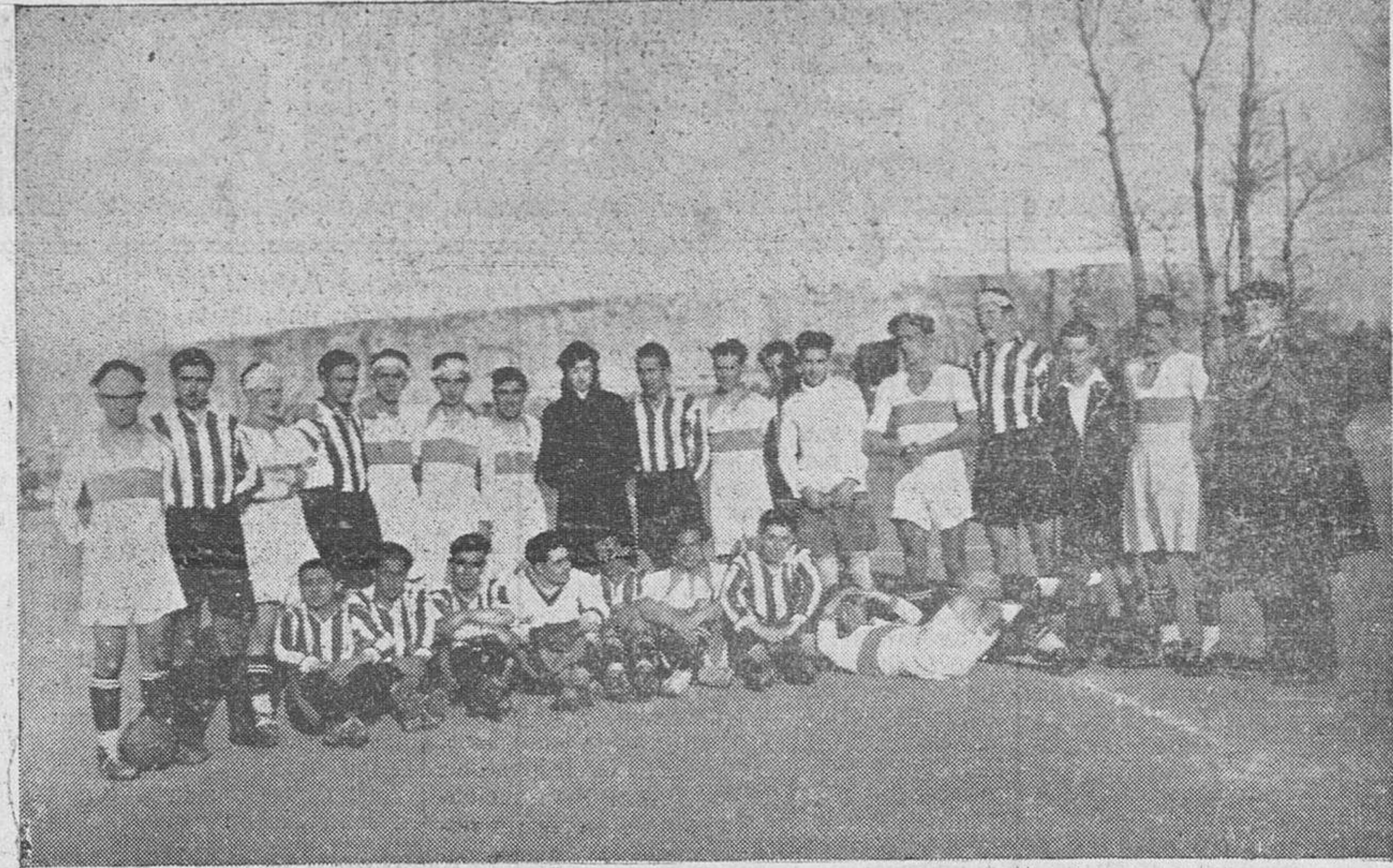
Los equipos de fútbol del Deportivo y del Olympia, que contendieron el domingo en ésta.

Unido este aspecto literario al aspecto sentimental de la boda de Mariano San Ildefonso, oficialmente anunciada para celebrarse durante los primeros días del mes próximo, el doble y grato motivo ha sugerido la idea de ofrecer al poeta el homenaje de un banquete que se celebrará el próximo jueves, día 30 del corriente mes, en el restaurante del bar Sol, Puerta del Sol, 6, donde podrán retirarse tarjetas para el mismo al precio popular de ocho pesetas, y también en la librería Puga, calle de la Paz, 5.