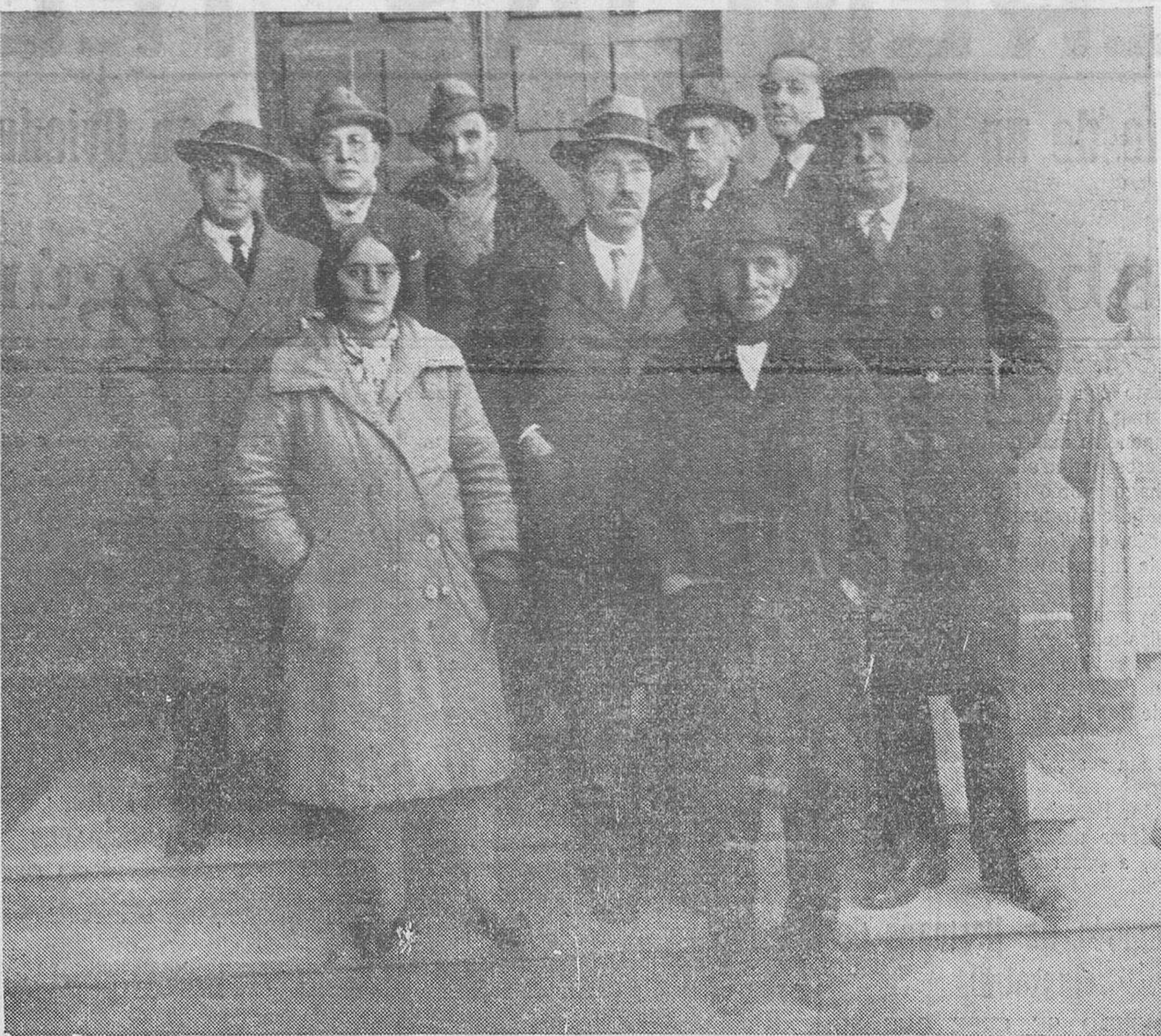
Representación del Ayuntamiento de Salamanca y de la Caja de Previsión Social que firmaron el acta de recepción de las Escuelas, con los profesores del Grupo Escolar