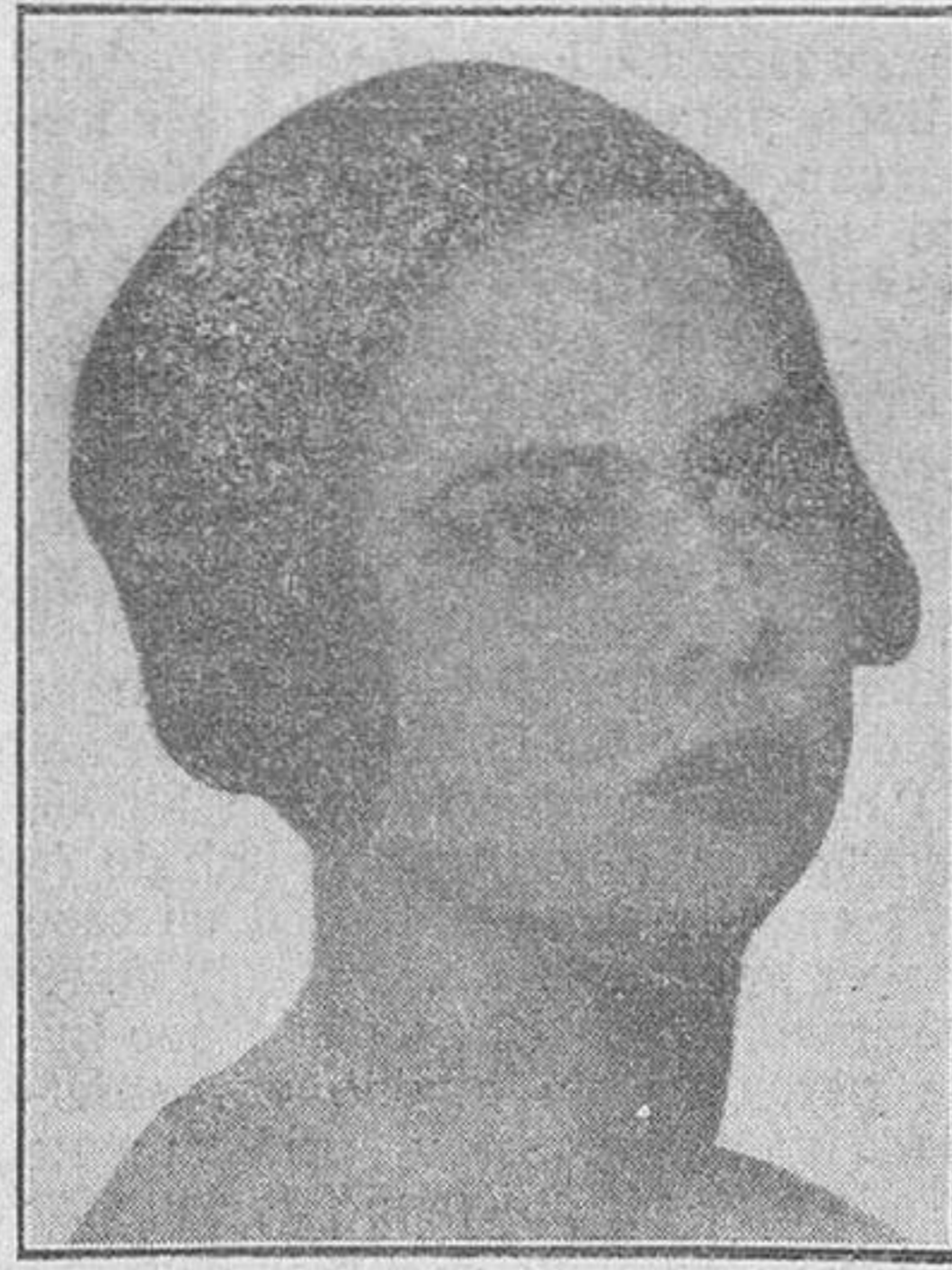
La princesa Ileana de Rumania, cuya boda con el archiduque Antonio de Habsburgo, se ha anunciado oficialmente.