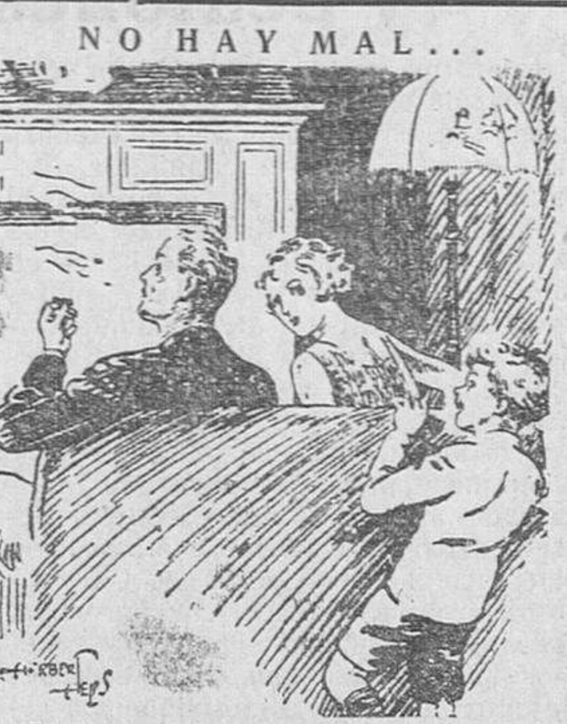
NO HAY MAL... El joven (con amargura).—Si me niega usted su mano, me marcho al Extranjero. El hermano de la joven.—¡Al pelo! Así me mandará usted sellos raros.