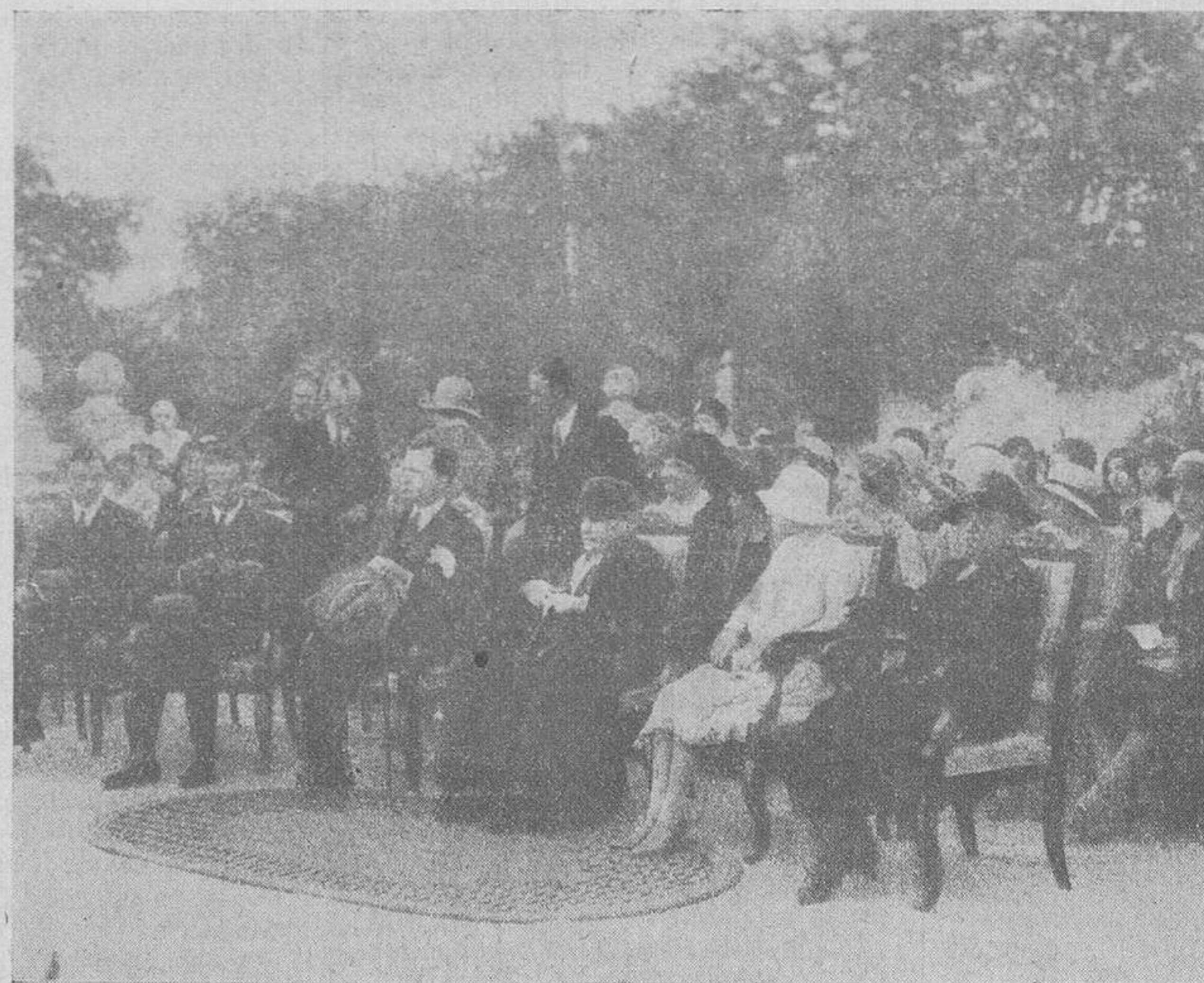
La infanta doña Isabel y el infante don Fernando en la fiesta de arte celebrada en el Palacete de la Moncloa.