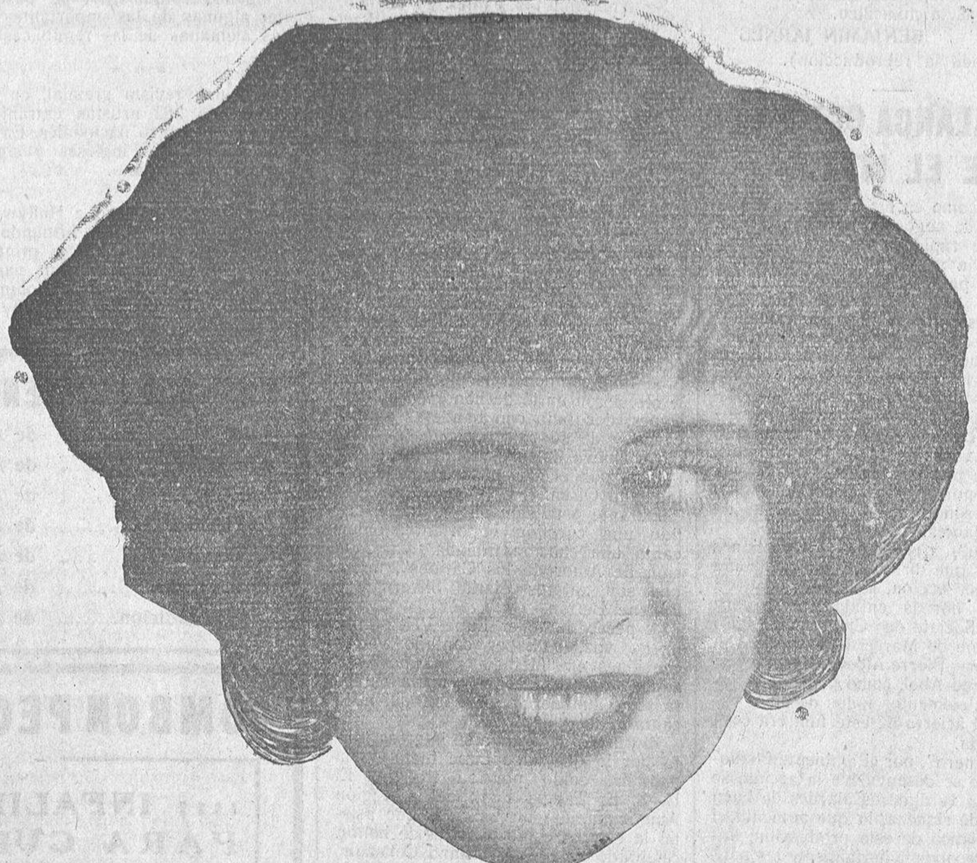
La simpatísimas y popular "estrella" Clara Bow, muestra en la "foto" la sonrisa y el gesto que tanta popularidad la han dado.

para su imaginación sin freno, en fuga, en carrera.