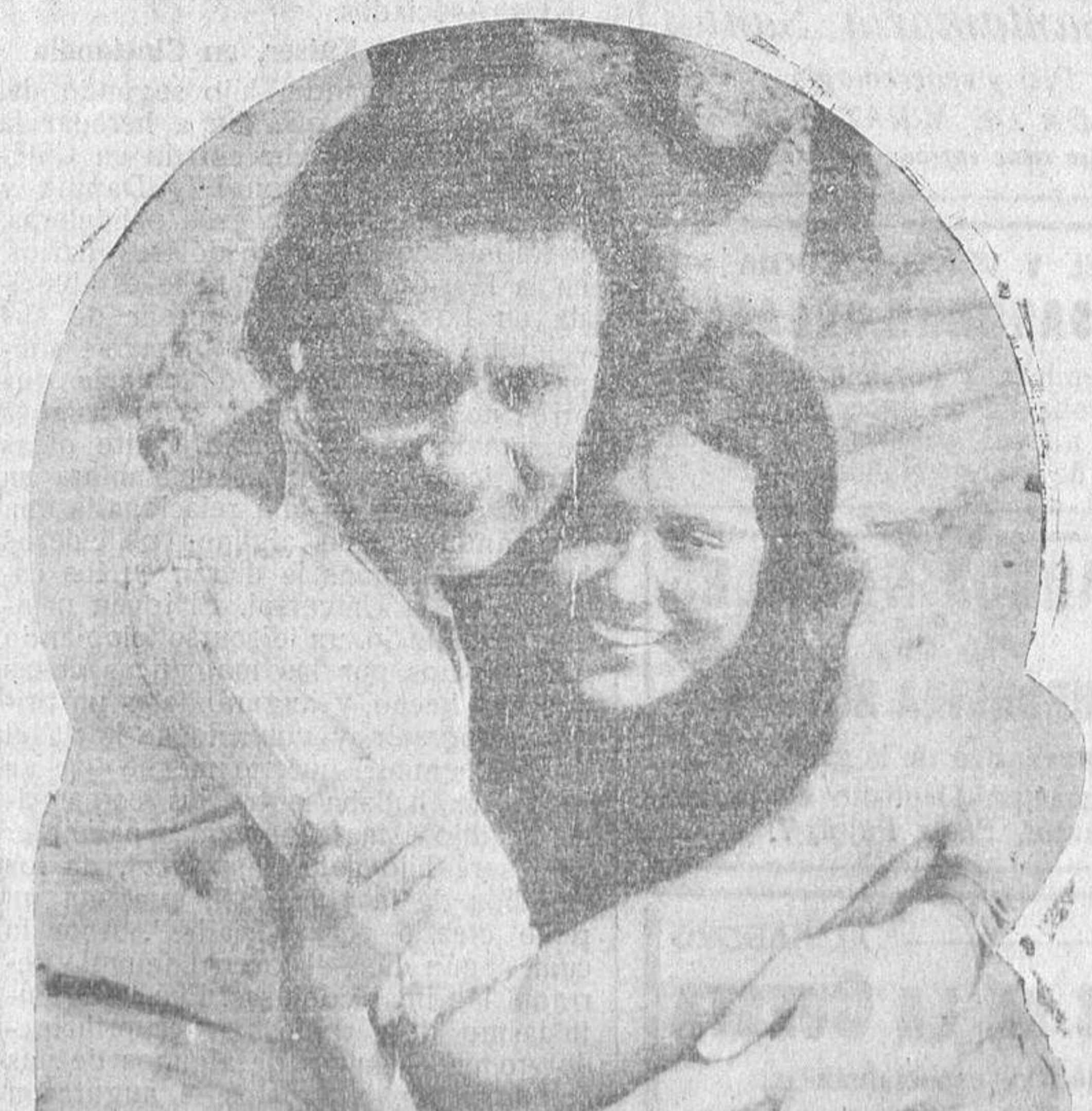
Un interesante momento de la bellísima producción "Sombros blancas"