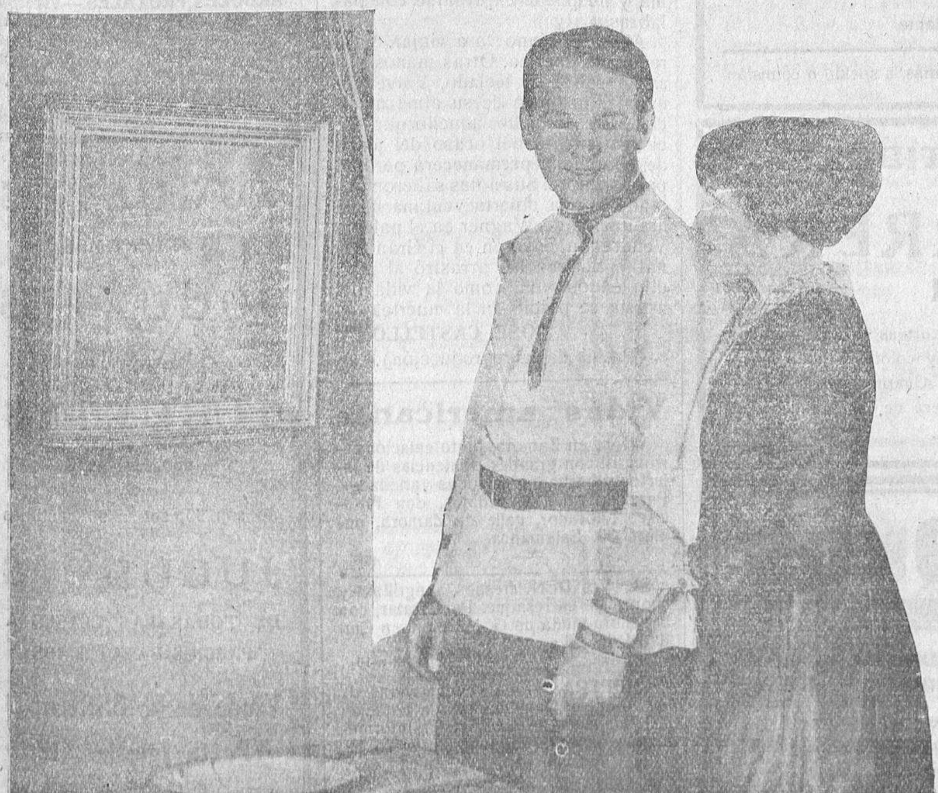
Una escena de la magistral película rusa "Nostalgia", perteneciente a la marca "Verdaguer", y uno de los más recientes éxitos, que en breve será importada a España.

(Continúa esta información en la página siguiente).