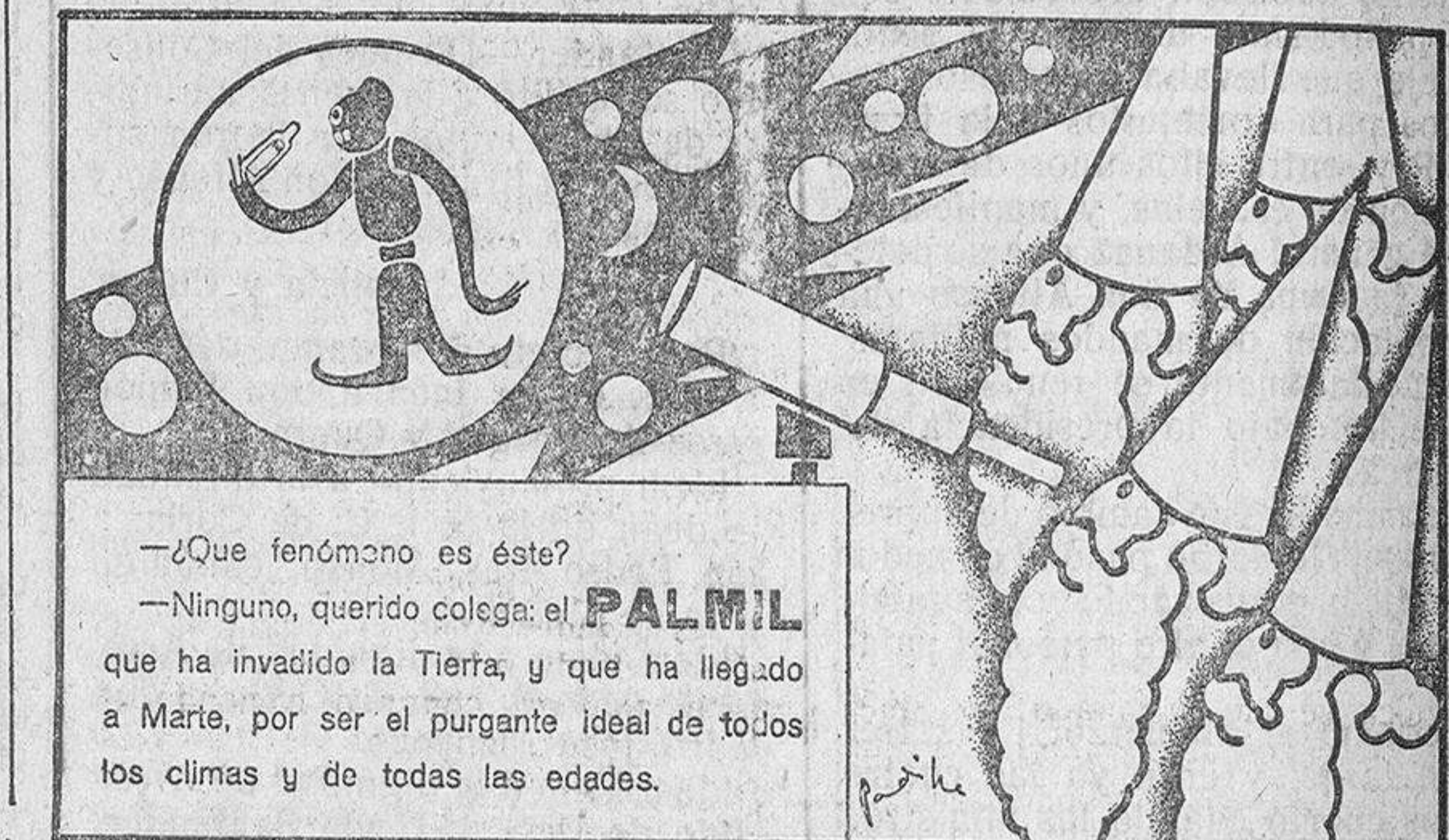
¿Que fenómeno es éste? —Ninguno, querido colega: el PALMIL que ha invadido la Tierra, y que ha llegado a Marie, por ser el purgante ideal de todos los climas y de todas las edades.