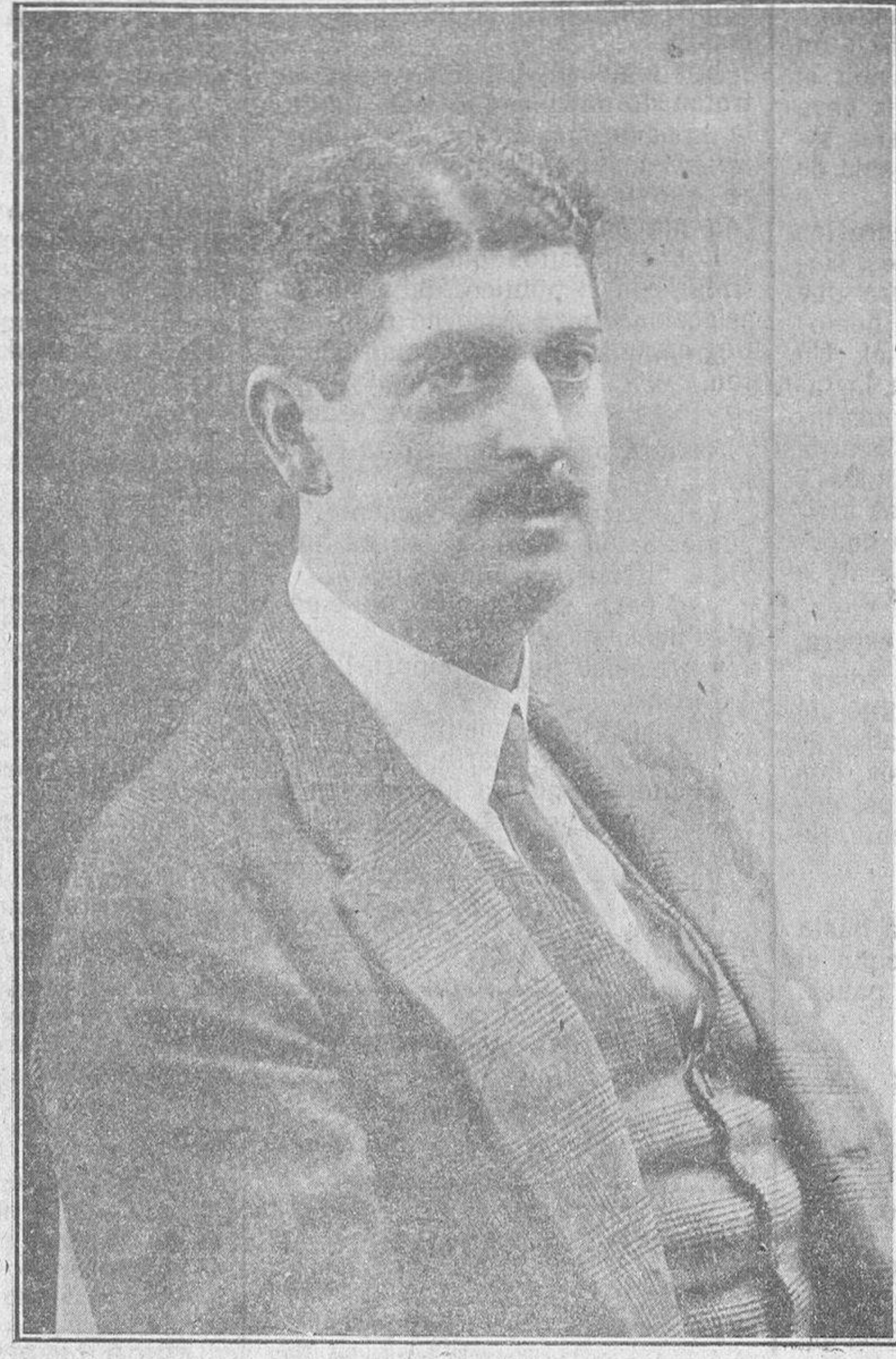
EL CONDE DE LOS ANDES Ministro de Economía, que hoy llega a Salamanca.

Es lamentable que se haga precisa esa importación para cubrir el consumo, llegando, como el año último, a importarse ocho millones de quintales métricos. Eso es dinero que sale de la nación. La importación aludida llega a 260 millones de pesetas, que salen de España para no volver, cosa que debe evitarse, aumentando la producción como puede hacerse. Ahora que, para ello, es necesario que los agricultores se den perfecta cuenta de que la "Gaceta" puede orientar y proteger, pero no imponer los métodos de cultivo, los abonos, el empleo de semillas seleccionadas, etcétera, etc. Hace falta que la acción particular coopere a estas sanas orientaciones y ponga en práctica los medios que la acción gubernamental ofrece, porque de lo contrario, resultaría letra muerta. Hay que revolucionar la agricultura, pero tiene que ser una revolución simpática, a cuya cabeza marcha ya el actual ministro de Economía enarbolando la bandera de la redención del campo.