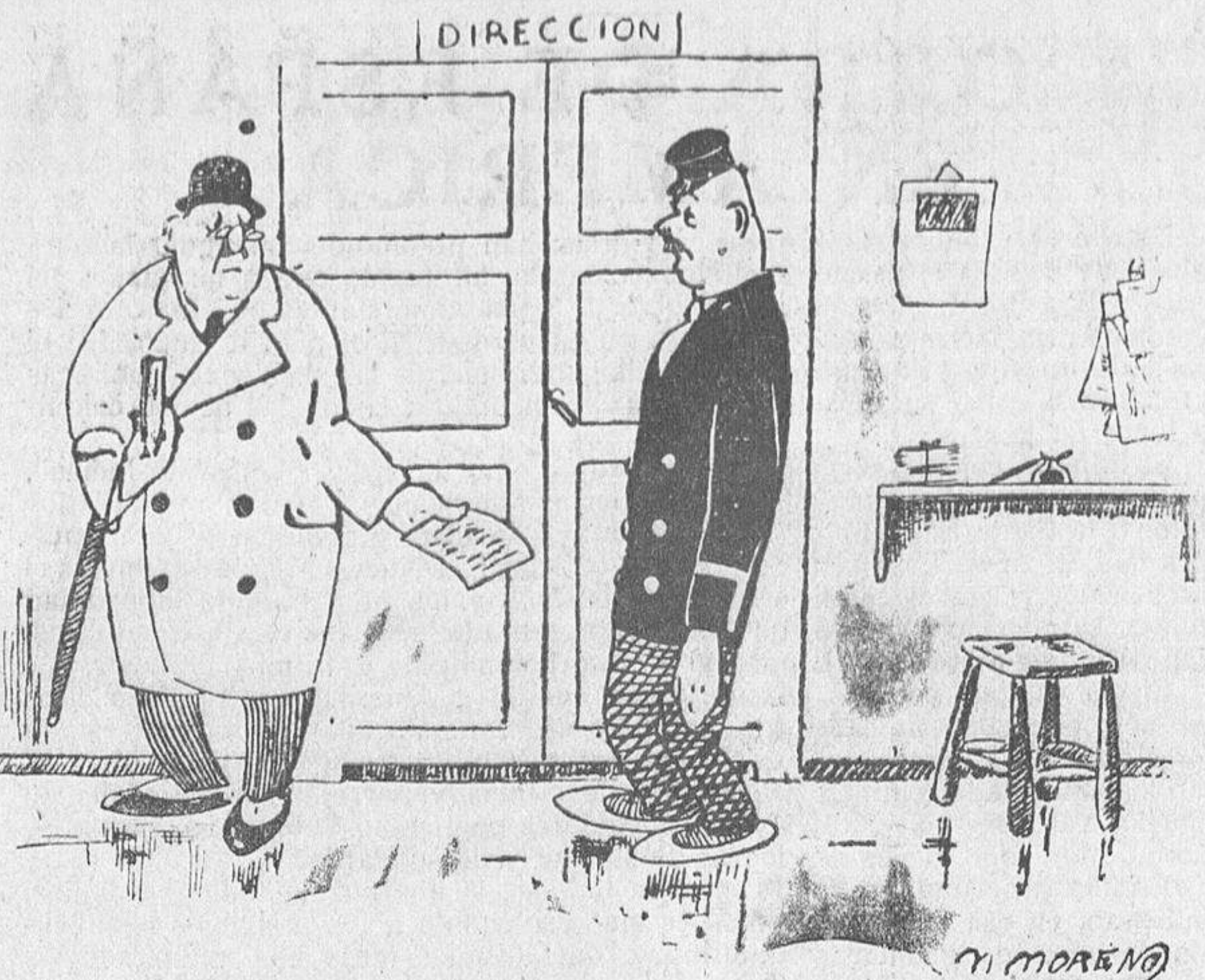
QUIEN MANDA, MANDA... Y NO SE EQUIVOCA

El apartado se verificará el día de cada corrida, a las once de la mañana, y el público puede presentarse desde las galerías de la plaza, mediante presentación de la entrada para la misma.