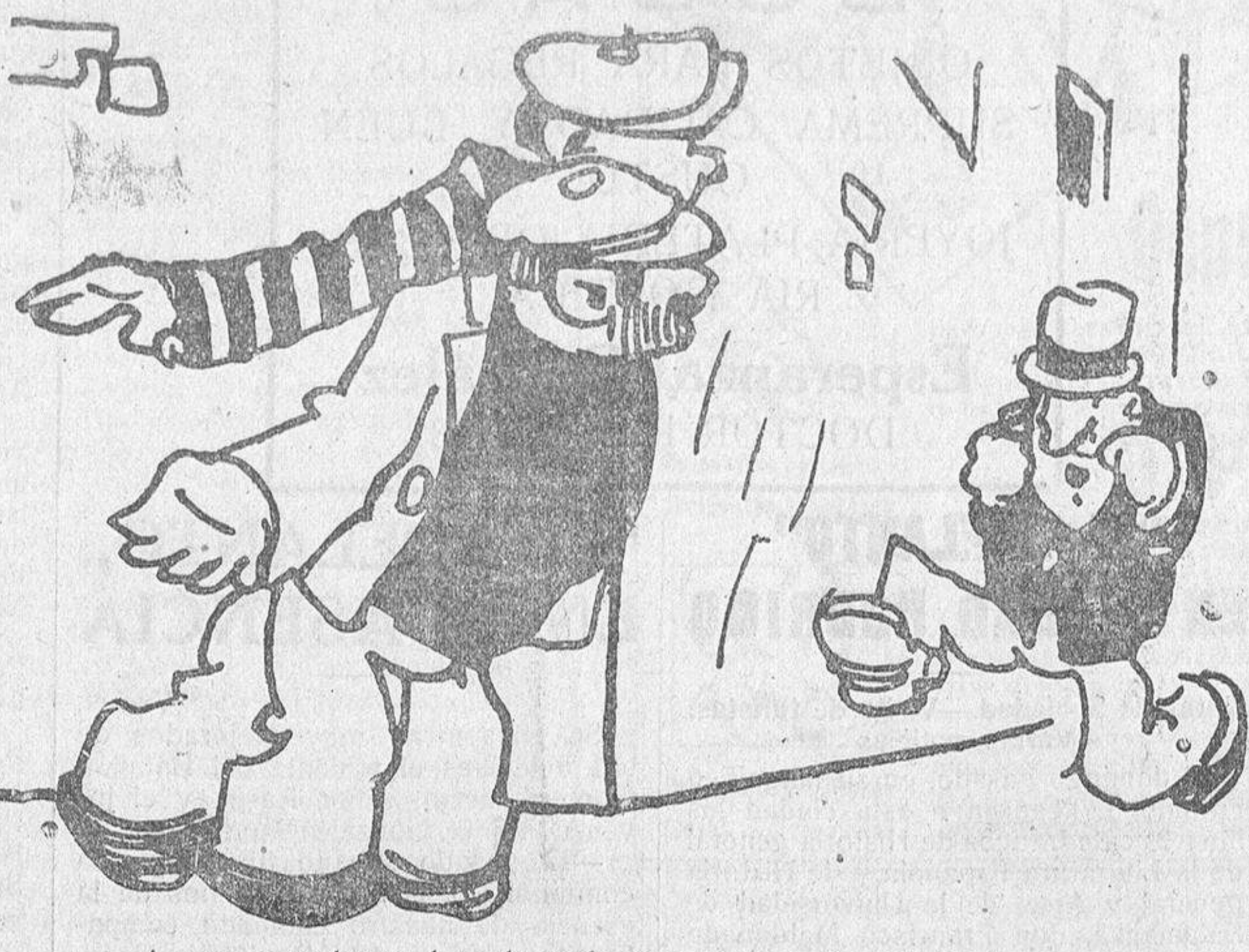
—A ese no podemos hacerle nada, porque ya lo han atracado. —Sí, pero de lo que lo han atracado ha sido de judías.

Resulta de difícil comprensión para el europeo, pero es un hecho, que toda la inmensa mayoría del pueblo de los Estados Unidos o era enteramente indiferente a que el país entrase en la contienda, o se mostraba en absoluto indiferente. A la sazón, la situación di-