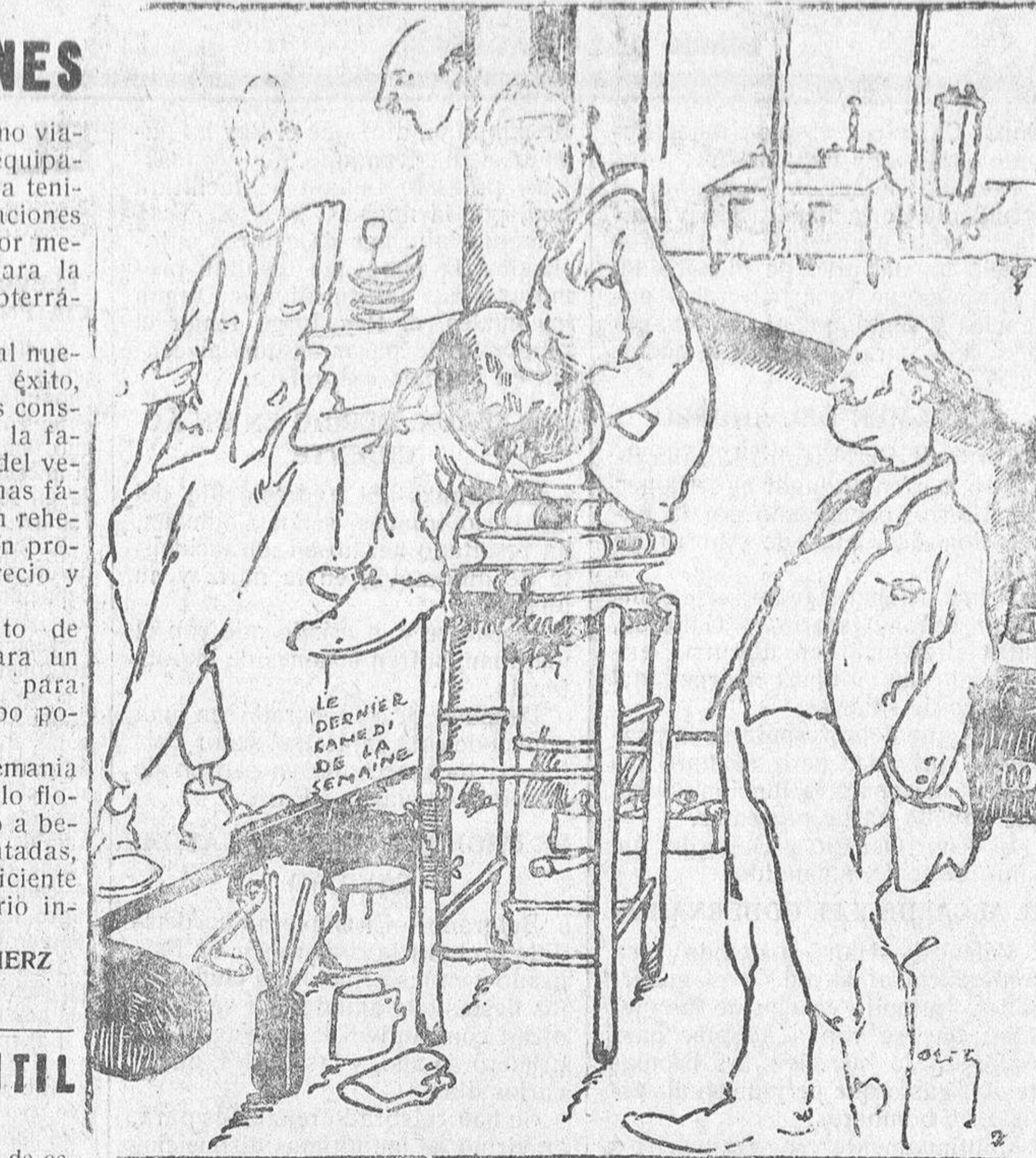
—Es el como. Tengo que hacerle un retrato y no puedo verle ni en pintura.