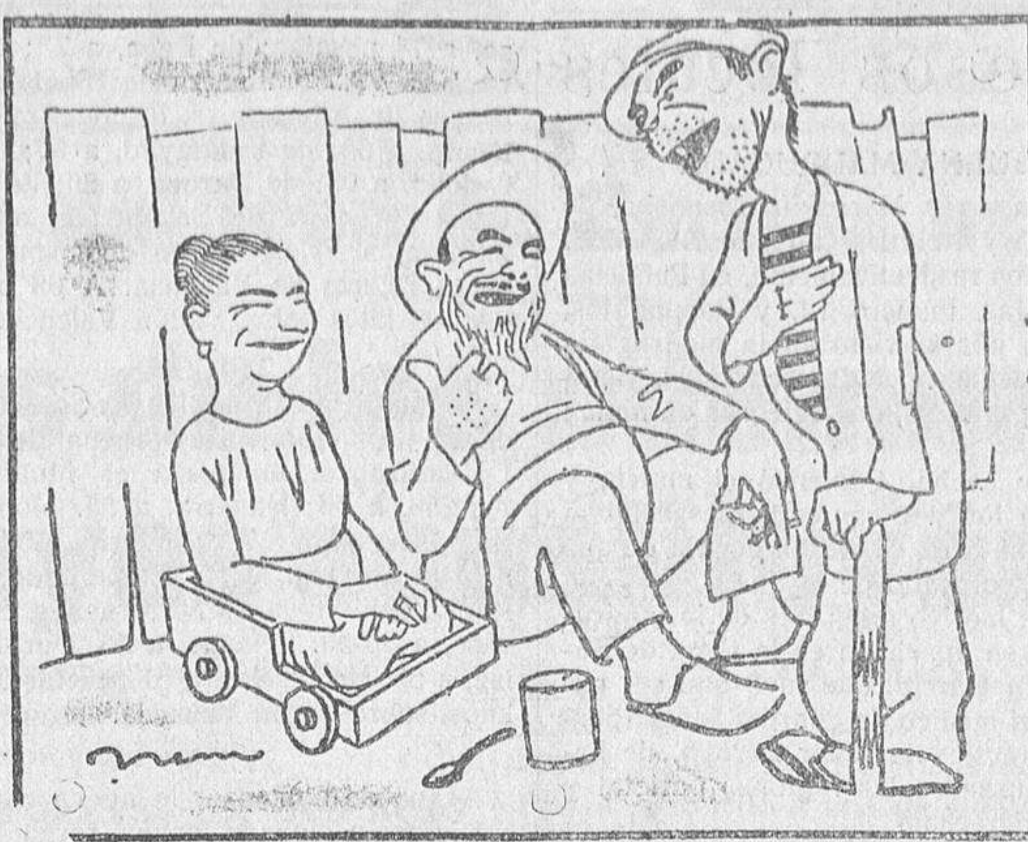
FORMULA DE URBANIDAD

4.09. Centro de Rico, pase de Jeromo y García falla tanto seguro.