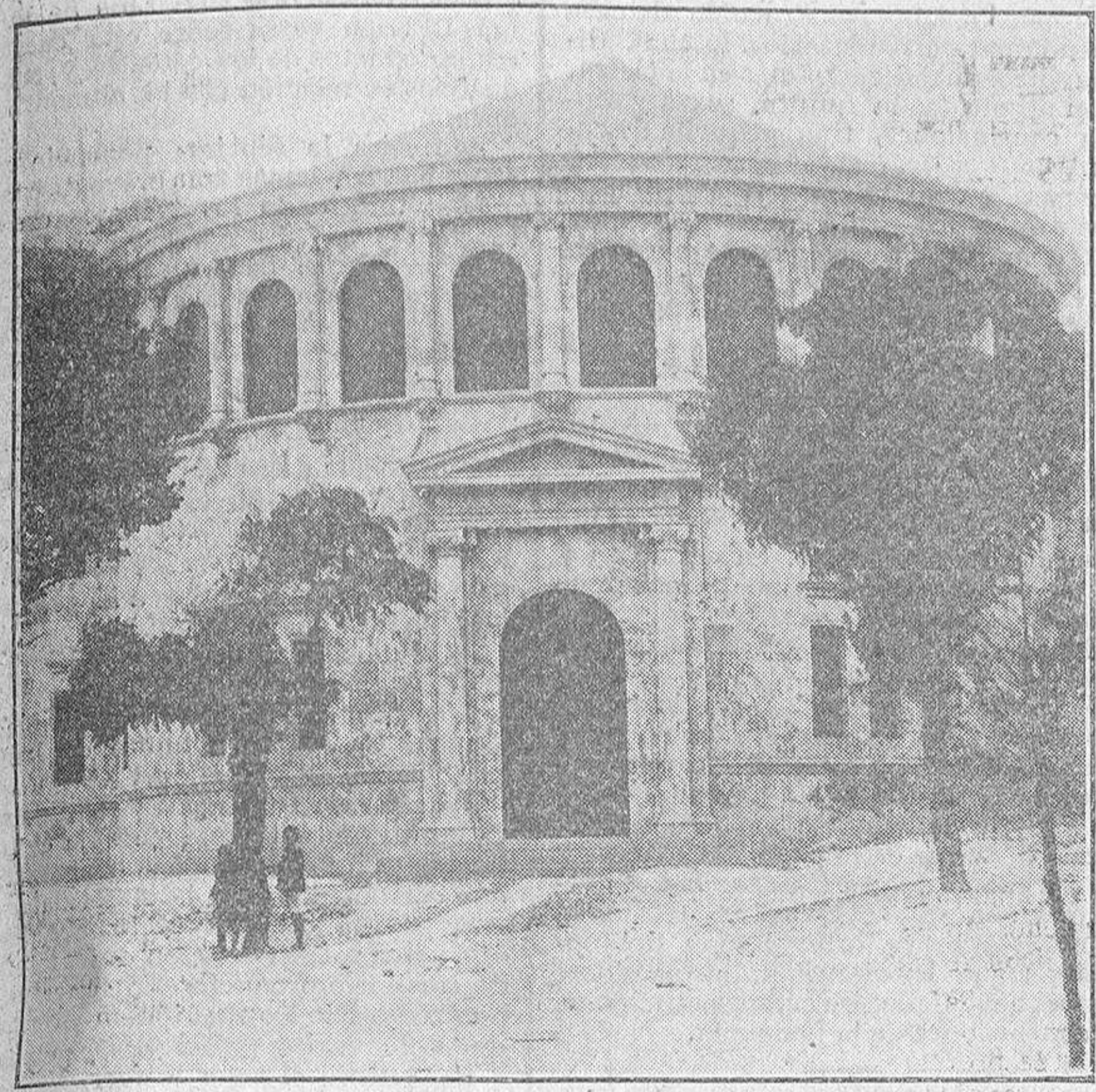
Fachada del nuevo anfiteatro.

valiosa mesa de cinco metros de larga y siete elegantes sillones, destinado todo al servicio de profesores, completan de una manera sencilla pero elegante, el amueblado del anfiteatro propiamente dicho. Se hallan además, instaladas en ha-