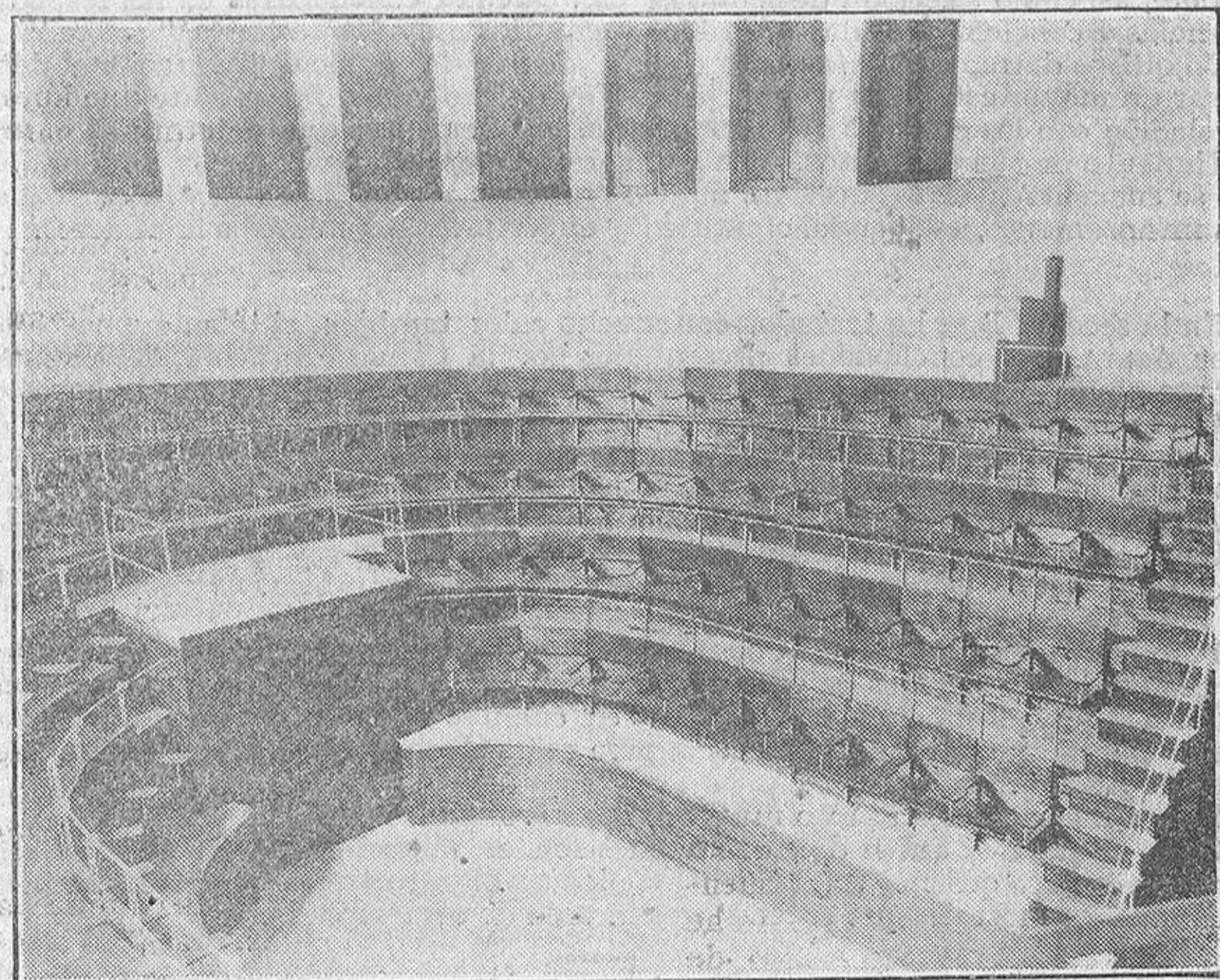
Vista del nuevo anfiteatro de la Facultad de Medicina, en cuyo local se verificó ayer la apertura de curso.