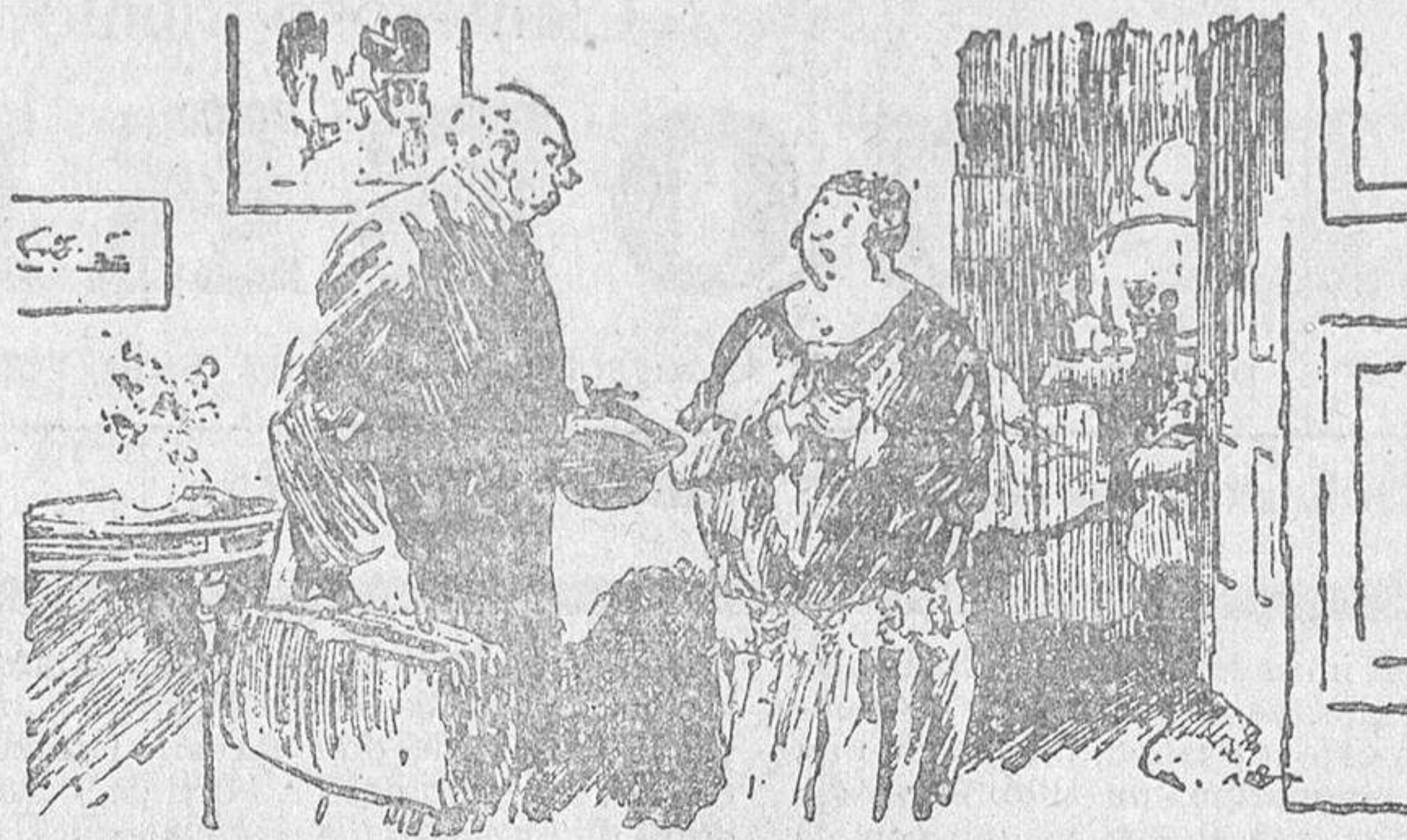
El médico. Y si vuelve a desmayarse, déle un poco de coñac. La esposa del enfermo.—¿Mientras se encuentra desmayado, doctor? ¡Eso no me lo perdonaría nunca!

En la costa oriental del Adriático, se halla un estado eslavo dispuesto a disputar el dominio de este estrecho mar y pretendiendo los puertos de Fiume y de Trieste, como los adecuados para el