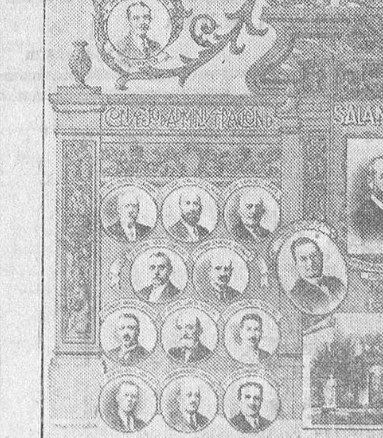
Administrador, empleados y consejeros de la prestigiosa institución salmantina Caja de Ahorros y Monte de Piedad.

Ampliando la noticia que publicábamos en nuestro número anterior sobre la comunicación remitida por el Tribunal de las oposiciones al cargo de asesor jurídico de la general patronal, parece ser que reconocida la aptitud por el Tribunal, de los tres opositores que actuaron, muy pronto dicha entidad adoptará acuerdos en consonancia con dicho cargo.