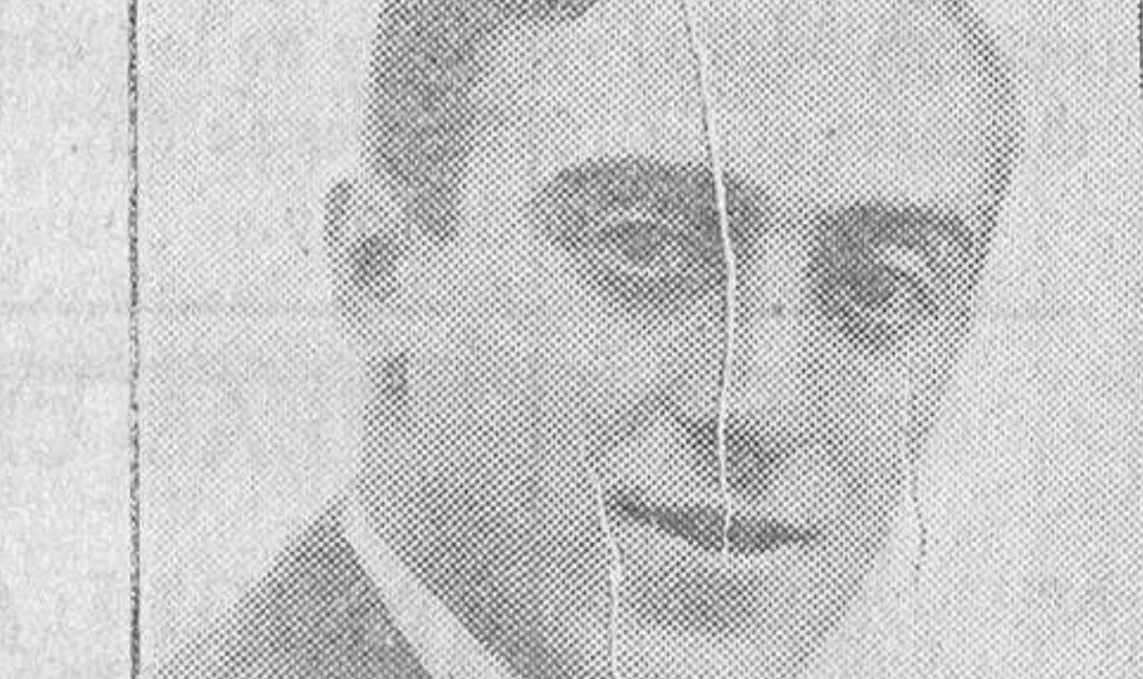
Madrid, Julio, 1927.

A despedirse acudirán a la estación, las autoridades y todos los jefes y oficiales de la guarnición francos de servicio. La marcha será a las dos y media.