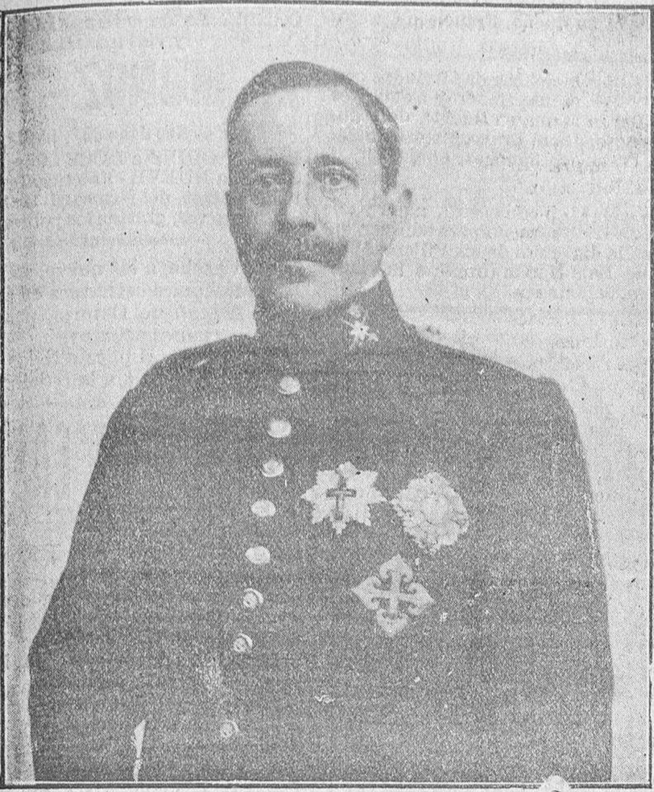
EL GENERAL NAVARRO Y ALONSO DE CELADA

zadores por Vich, San Quirico, Ripoll y San Juan de las Abadesas. Prestó en el año siguiente, durante la huelga de funcionarios de Correos y Telégrafos, excelentes servicios, montando el de ambulancia en la línea de Oordoney y restableciendo en la comarca las comunicaciones postales.