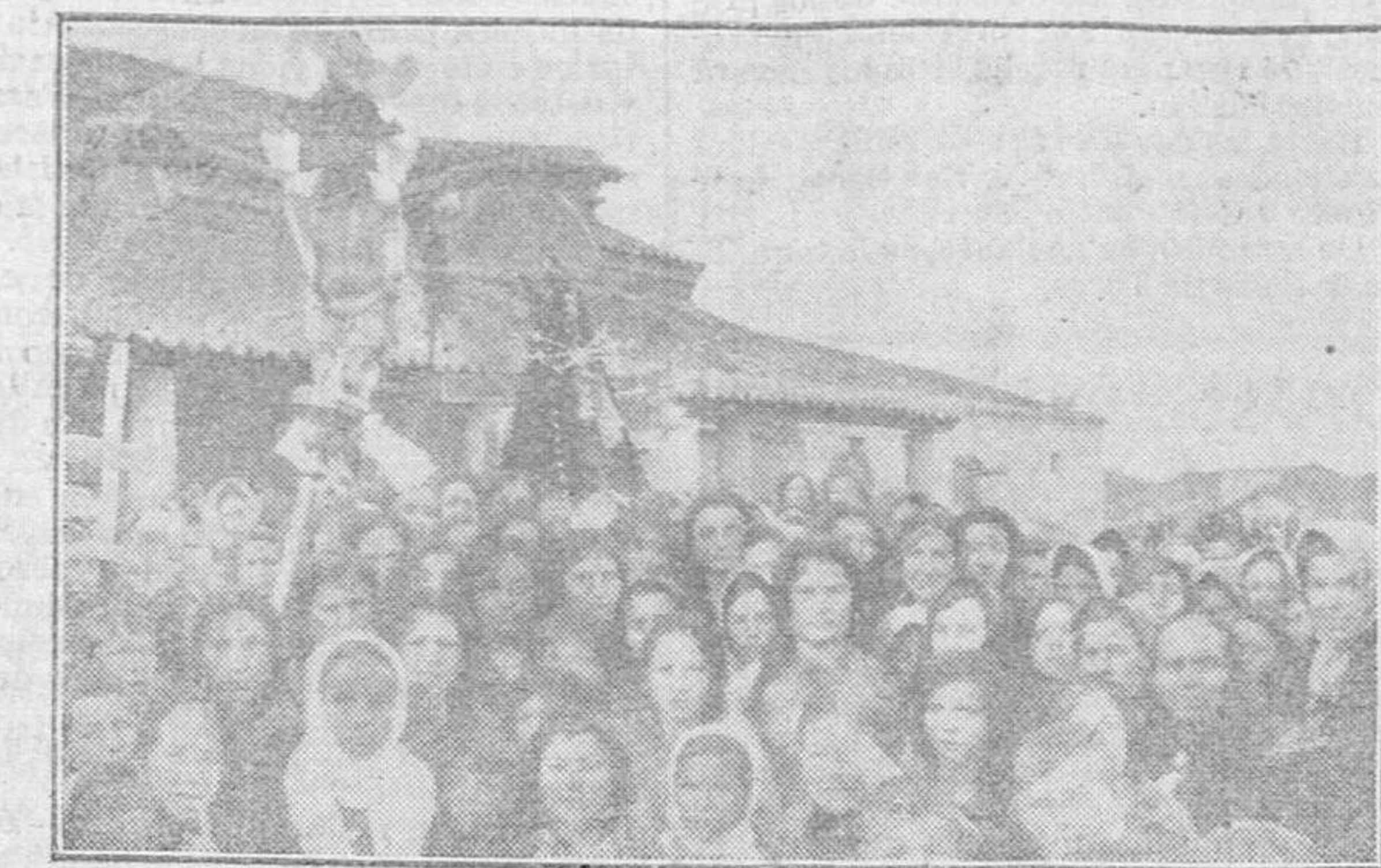
La vida en los pueblos.—La procesión de las Misiones en Valdecarras.

todos los de aquella villa! El es su mayor consuelo, en sus horas de agonía, y el que calma sus dolores y el que cura sus heridas. El es la antorcha sagrada que desde aquella colina, les alumbraba en las tinieblas de esta miserable vida, y el que al morir los bendice con su bendición divina.