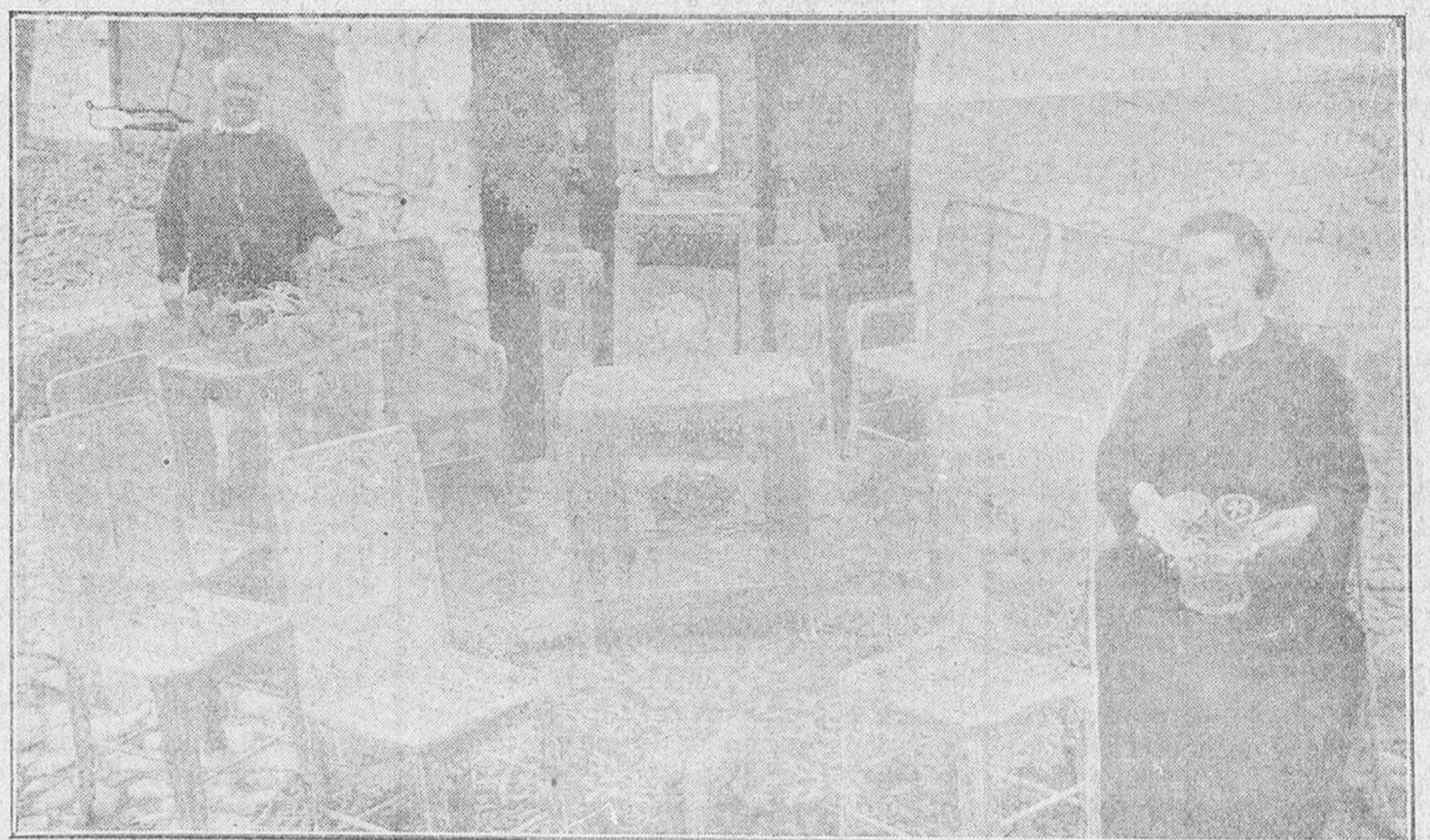
Gabinete completo de rafia.