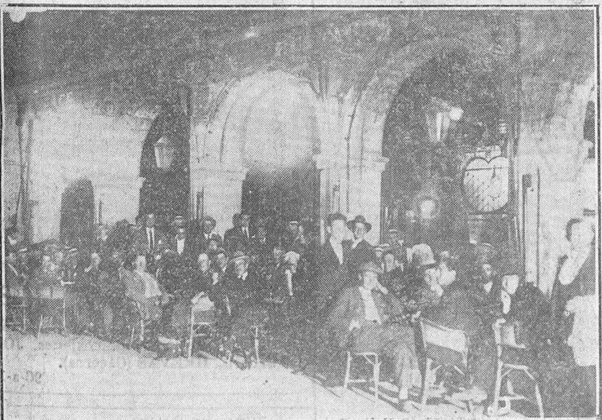
La terraza de Novelty ofrece en esta noche de verano, noche verbenera casi, un aspecto de animación que recuerda los cafés lujosos del Norte.

AL FINAL DEL CAMINO Amalio Gombau, que al comienzo de la excursión contaba con energías para hacer siete informaciones como esta—al menos así me lo decía él—empieza a sentirse fatigado. Son muchas horas de «exposición», mucho paseo. Si todo le hubiera hecho en el Teso de la FERIA, al amparo de aquella quietud, de aquella soledad, y, sobre todo, de aquel airecillo fresco que allí reinaba, Amalio no se hubiera cansado, aunque hubiéramos tenido que esperar el final de esta información hasta las cinco de la mañana.