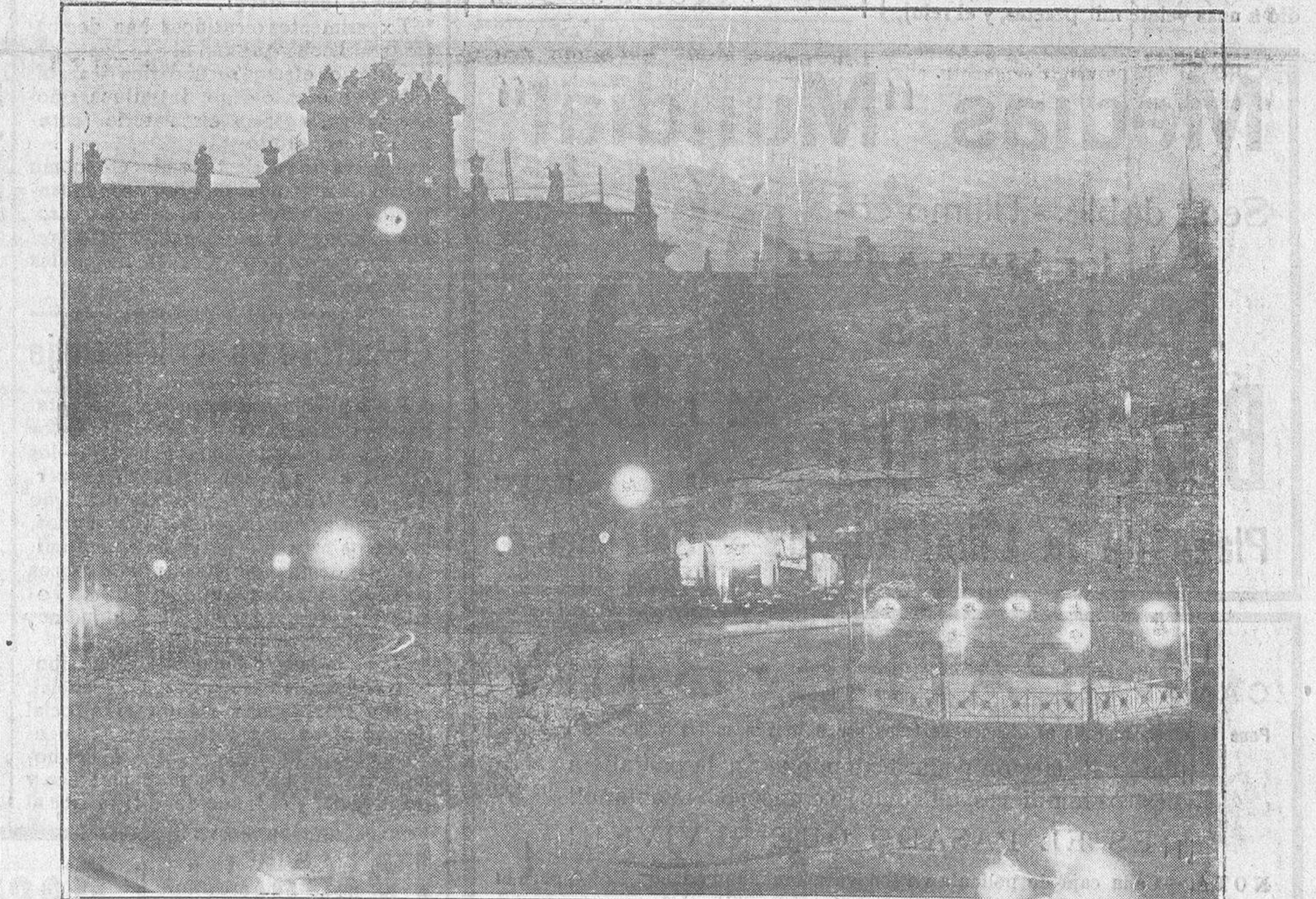
La preciosa joya del renacimiento, la monumental Plaza Mayor, ofrece durante la noche, a la luz de los focos y al resplandor de las terrazas de sus cafés, mágico aspecto, semejante solo a esos monumentos imaginados en la infancia, cuando leíamos bellos cuentos de hadas.

EN LA PLAZA MAYOR Una pequeña dificultad. Amalio quiere que se enciendan las luces del templete. Dice que el centro de la plaza saldrá