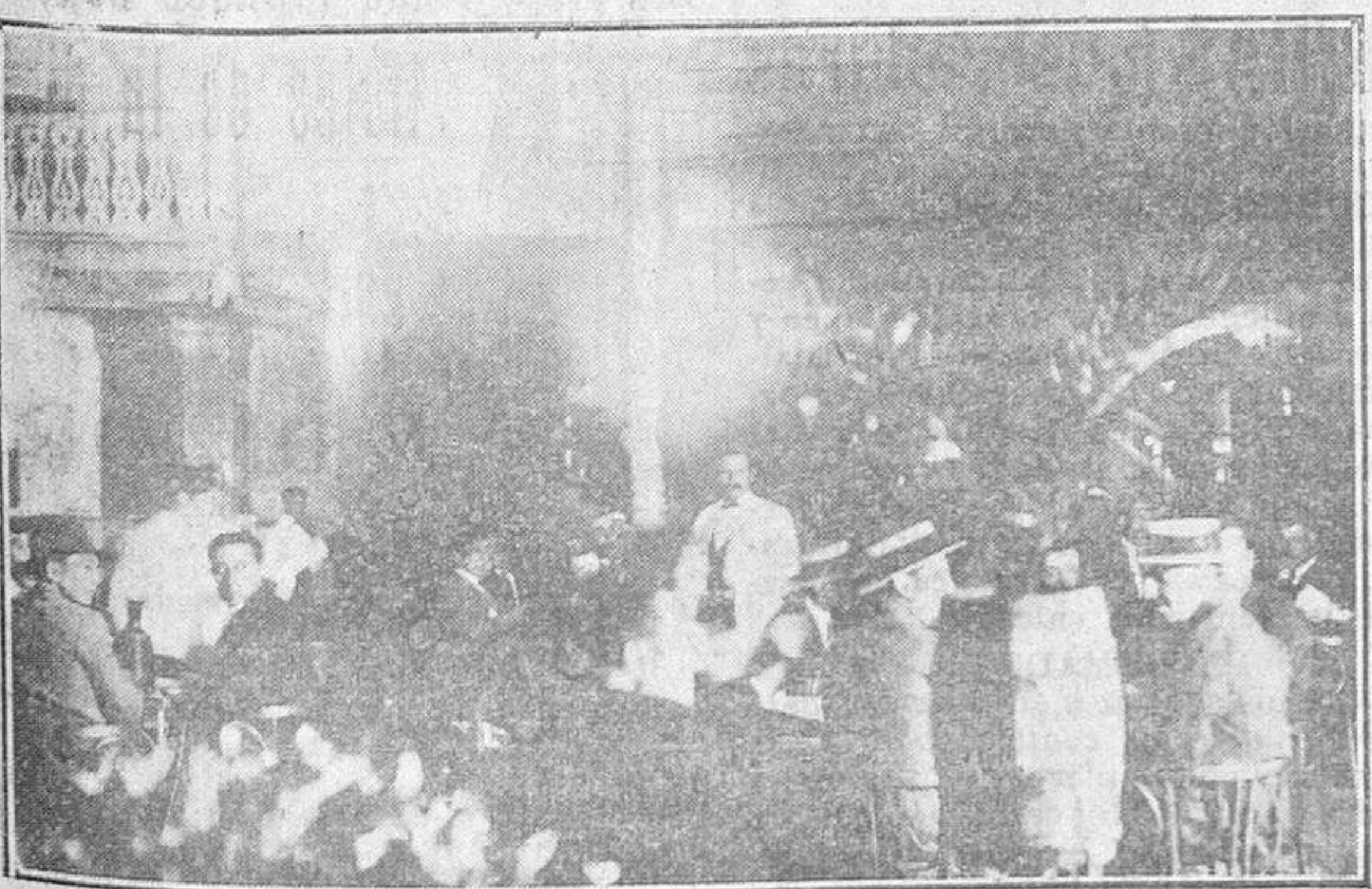
La orquesta del café Pasaje reúne en el patio, en estas noches cálidas del verano, grupos de gentiles muchachitas salmantinas, que llevan, con sus ojos luminosos, animación y belleza a este simpático rincón salmantino.

EN LA PLAZA MAYOR Una pequeña dificultad. Amalio quiere que se enciendan las luces del templete. Dice que el centro de la plaza saldrá