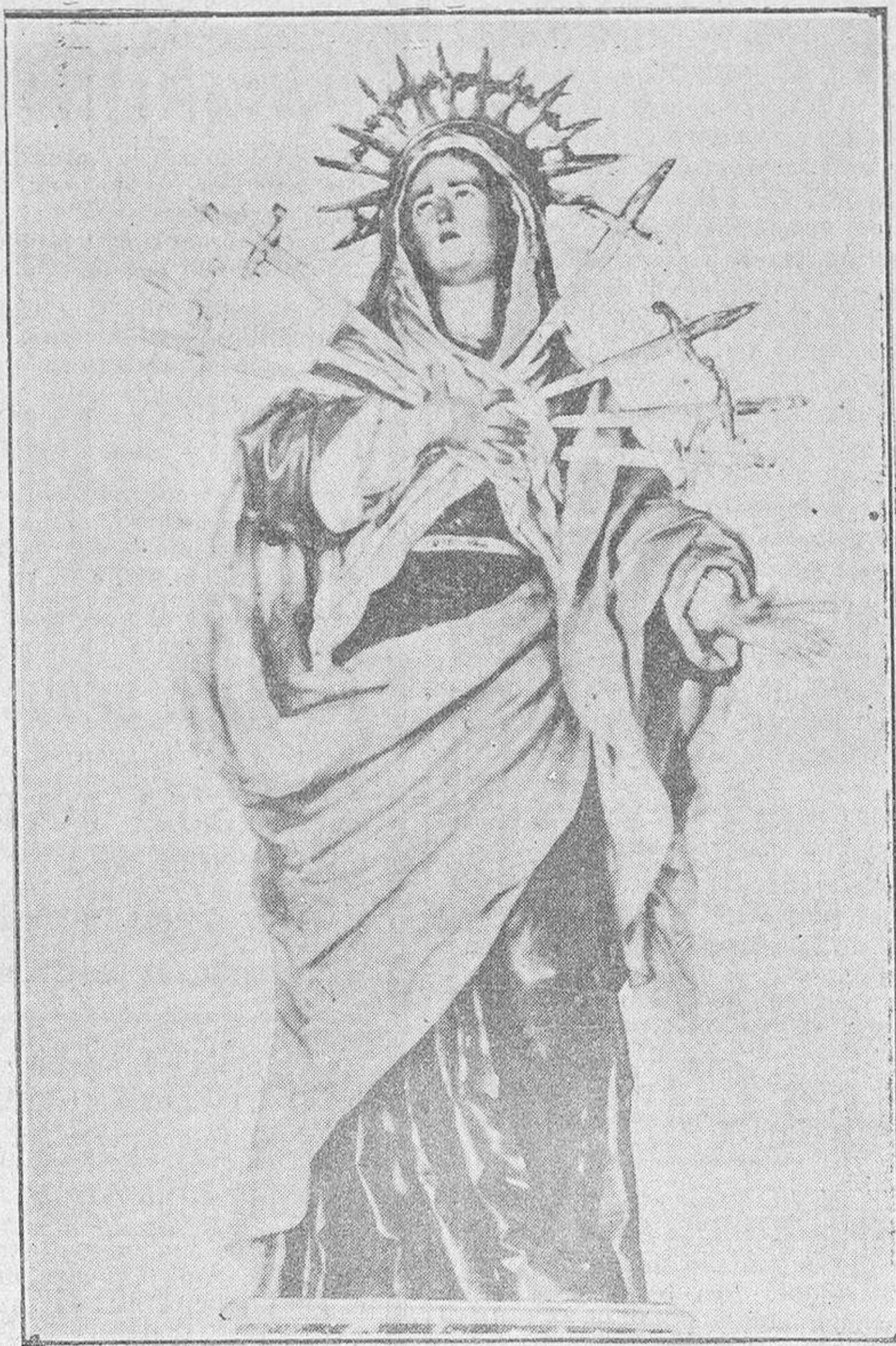
La Dolorosa de las Agustinas que saldrá en procesión por primera vez