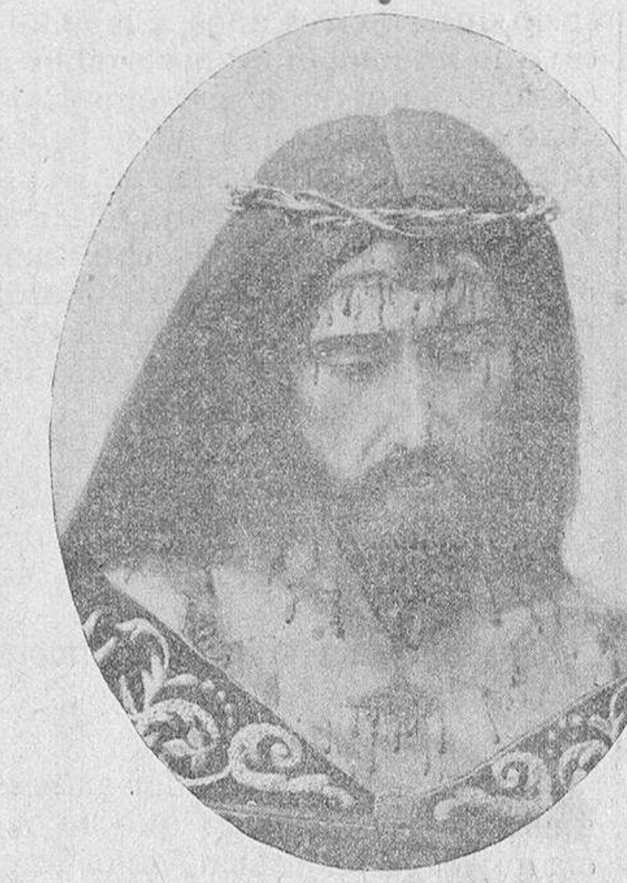
Jesús Rescatado, que se venera en la iglesia de la Santísima Trinidad.

Los salmantinos, desde hace muchos siglos, acudieron siempre en sus necesidades a la imagen bendita del Redentor,