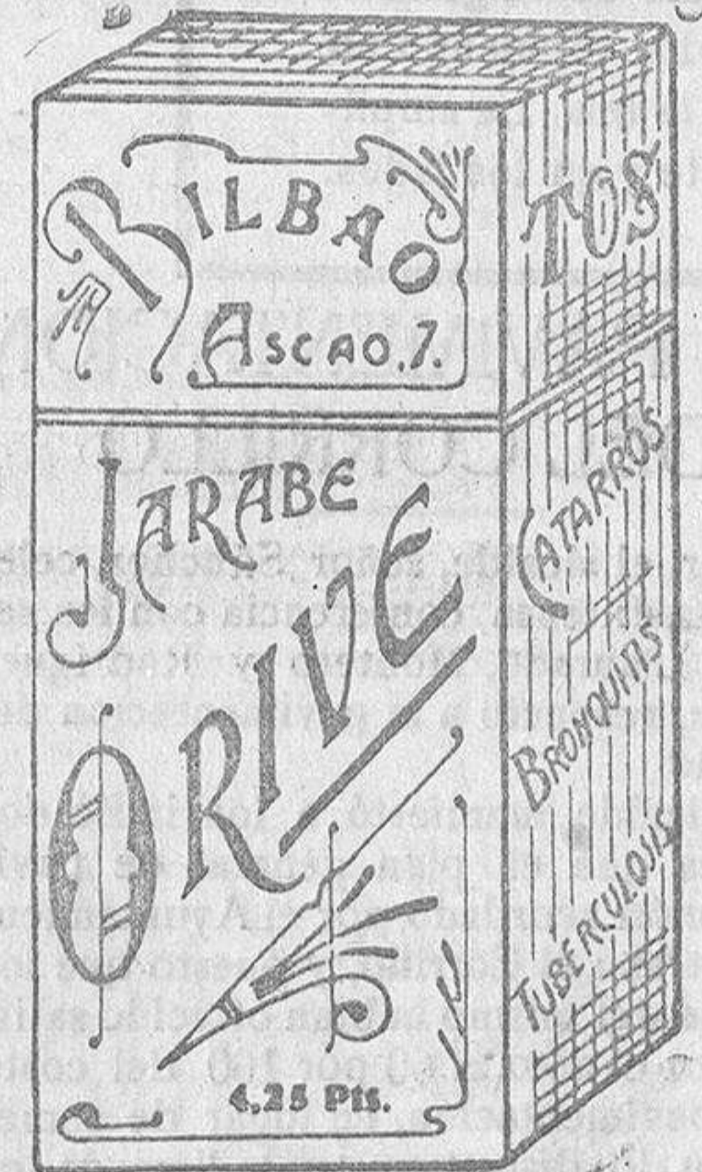
El mejor remedio para el peor catarro. JARABE ORIVE. Precio, 4,25 pesetas.

Nosotros, pues, no olvidaremos que gastó parte de sus energías para que comprendiéramos ciertos temas, que nos inició en los primeros pasos de la