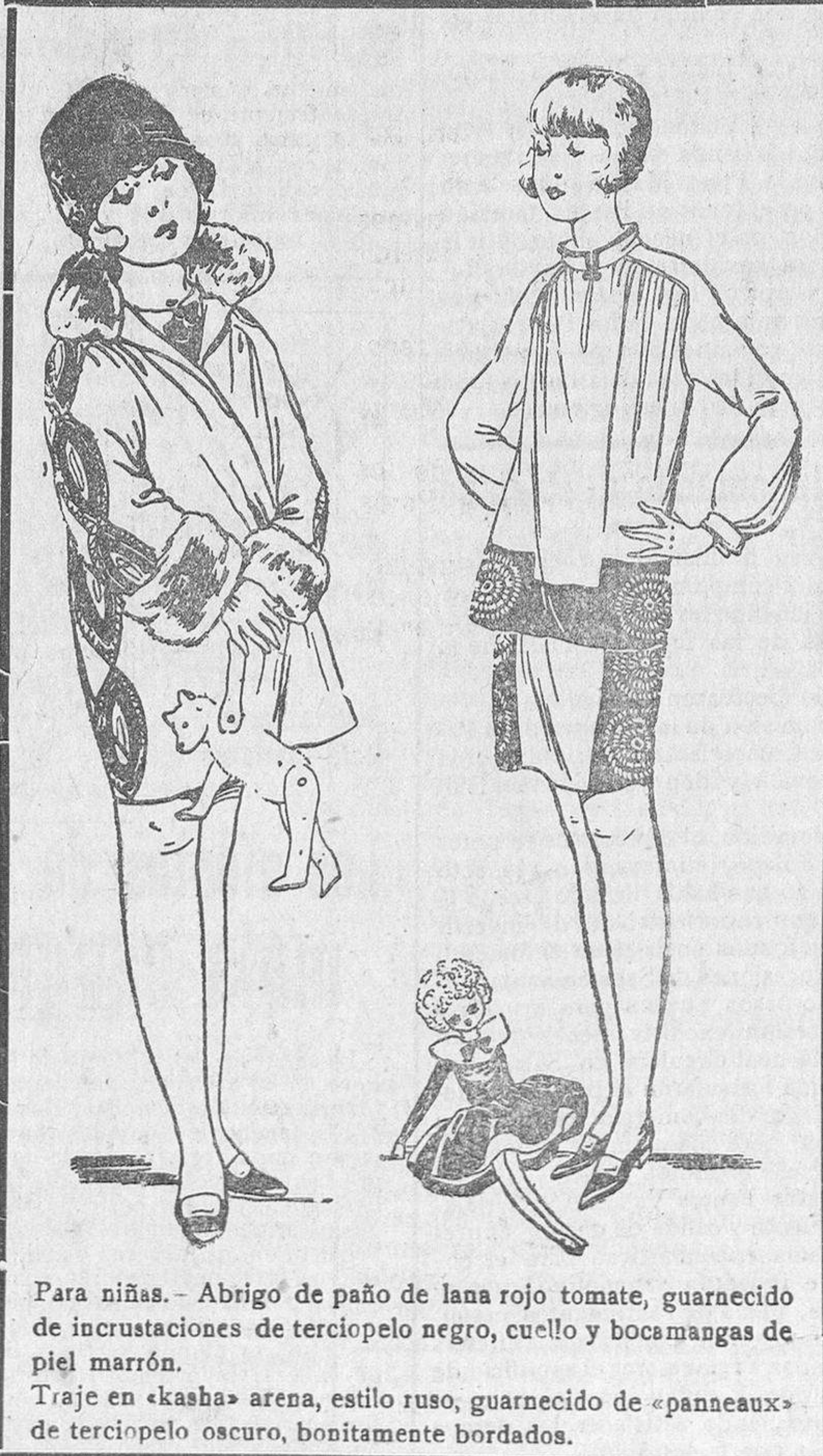
Para niñas. - Abrigo de paño de lana rojo tomate, guarnecido de incrustaciones de terciopelo negro, cuello y bocanangas de piel marrón. Traje en «kasha» arena, estilo ruso, guarnecido de «panneaux» de terciopelo oscuro, bonitamente bordados.