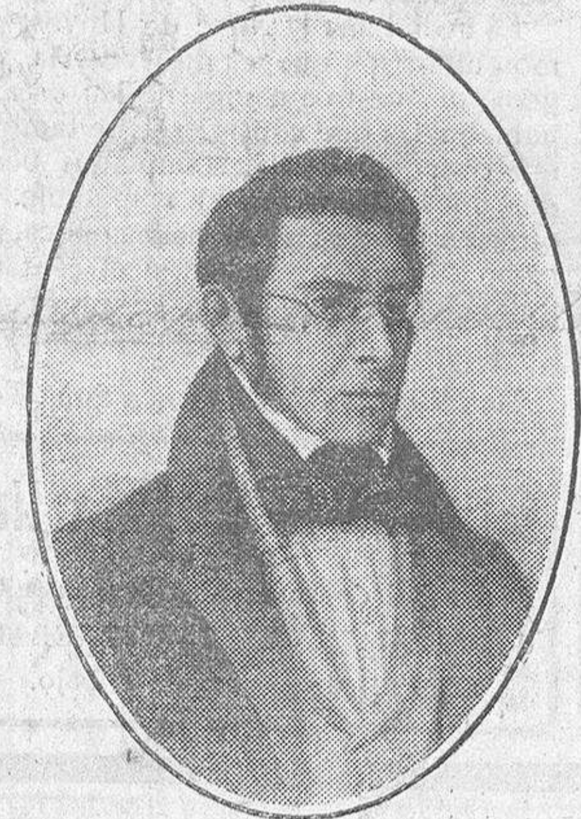
Retrato de don Manuel Bretón de los Herreros, hecho por Federico de Madrazo en 1835 y grabado por Bartolomé Maura en 1883, fecha de la primera edición de las obras completas.

Pero no es solamente dramaturgo el escritor riojano que se recuerda estos días. Es también poeta, periodista y político. Como poeta, compone sátiras morales, algunas tan conocidas como las tituladas «Contra la hipocresía», «El carna-