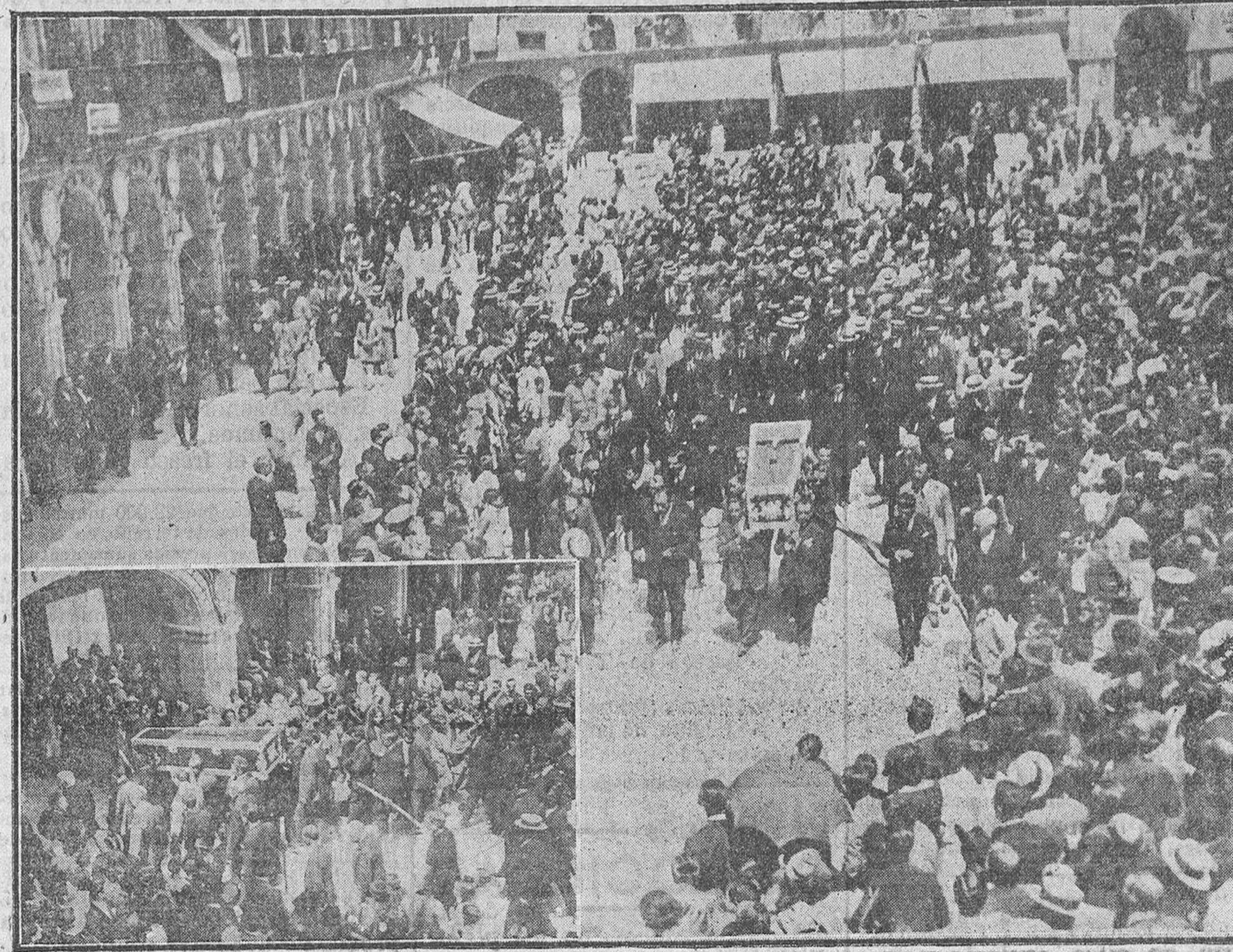
En la Plaza Mayor.—A la salida del Ayuntamiento, se va formando de nuevo la comitiva, que marcha al Cementerio por el arco de la calle del Prior.