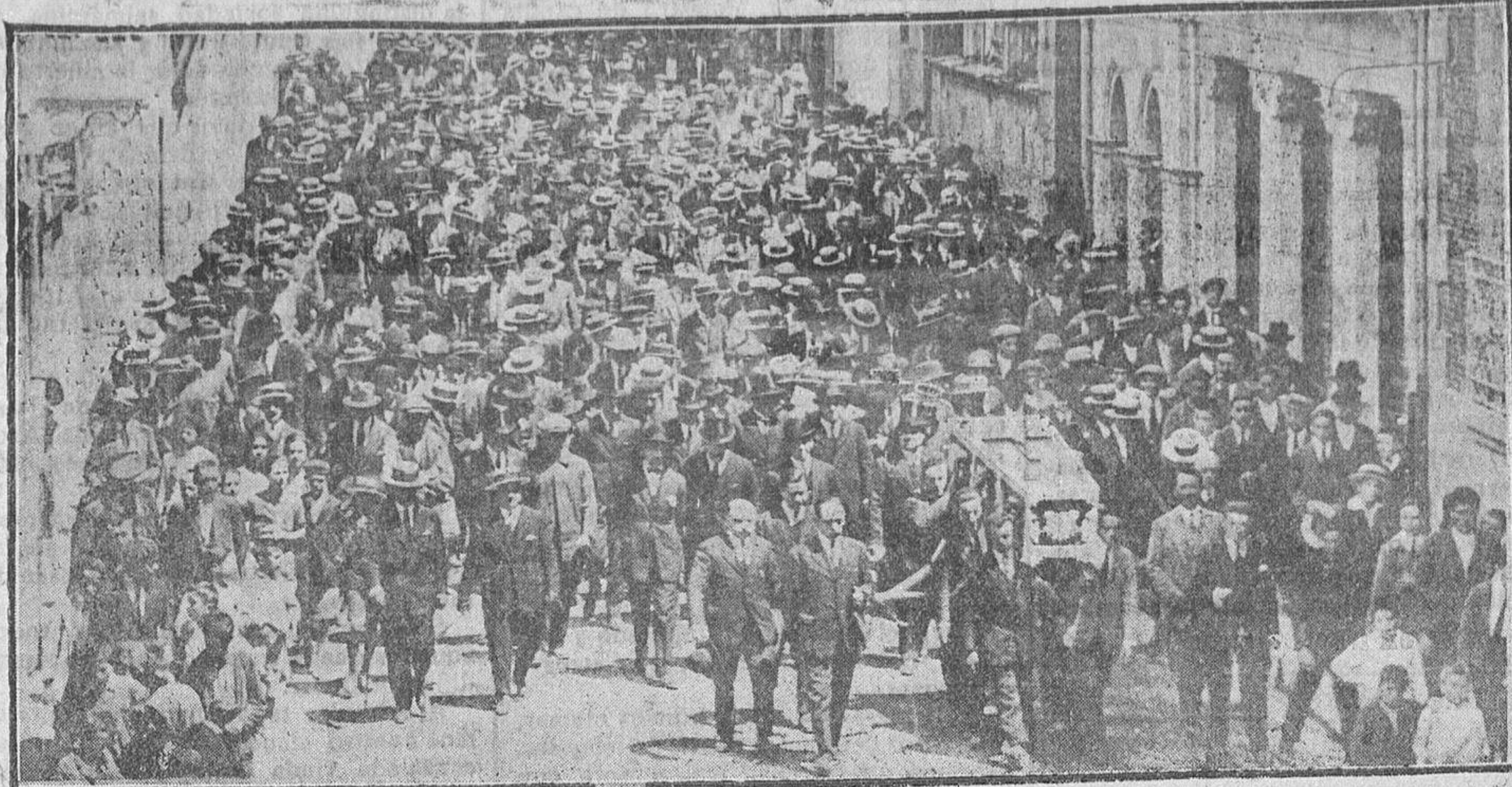
El paso del fúnebre cortejo por la calle del Doctor Riesco.