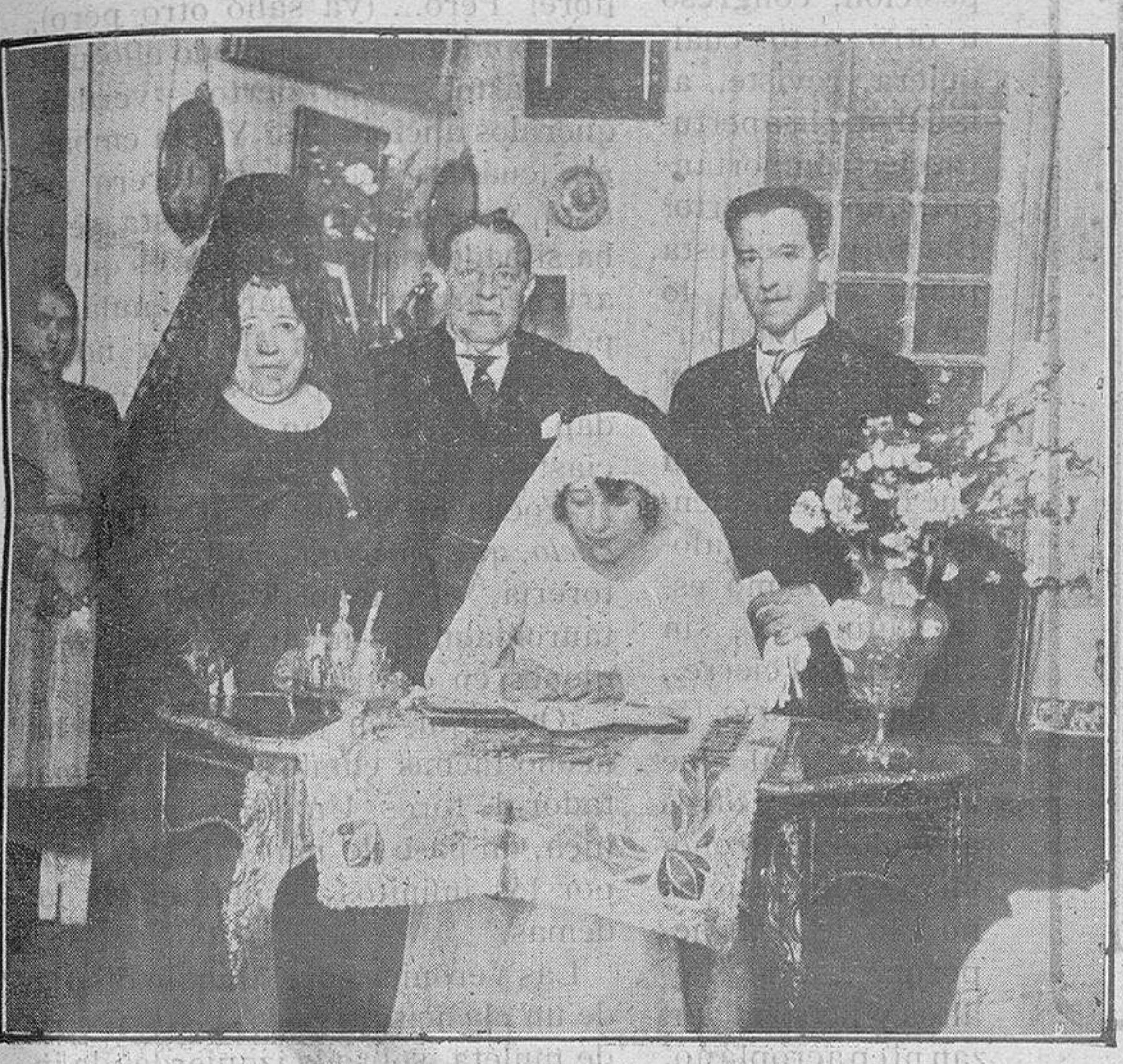
Los novios y sus padrinos, firmando el acta matrimonial.

de esos lugares de casas de adobe, lejos de los hombres ciudadanos, sin que a nosotros llegue el rumor inquietante de su vida, el vaho repugnante de sus vicios y sin el temor de poder ser abrasados en las llamas que levantan sus ambiciones y sus deseos.