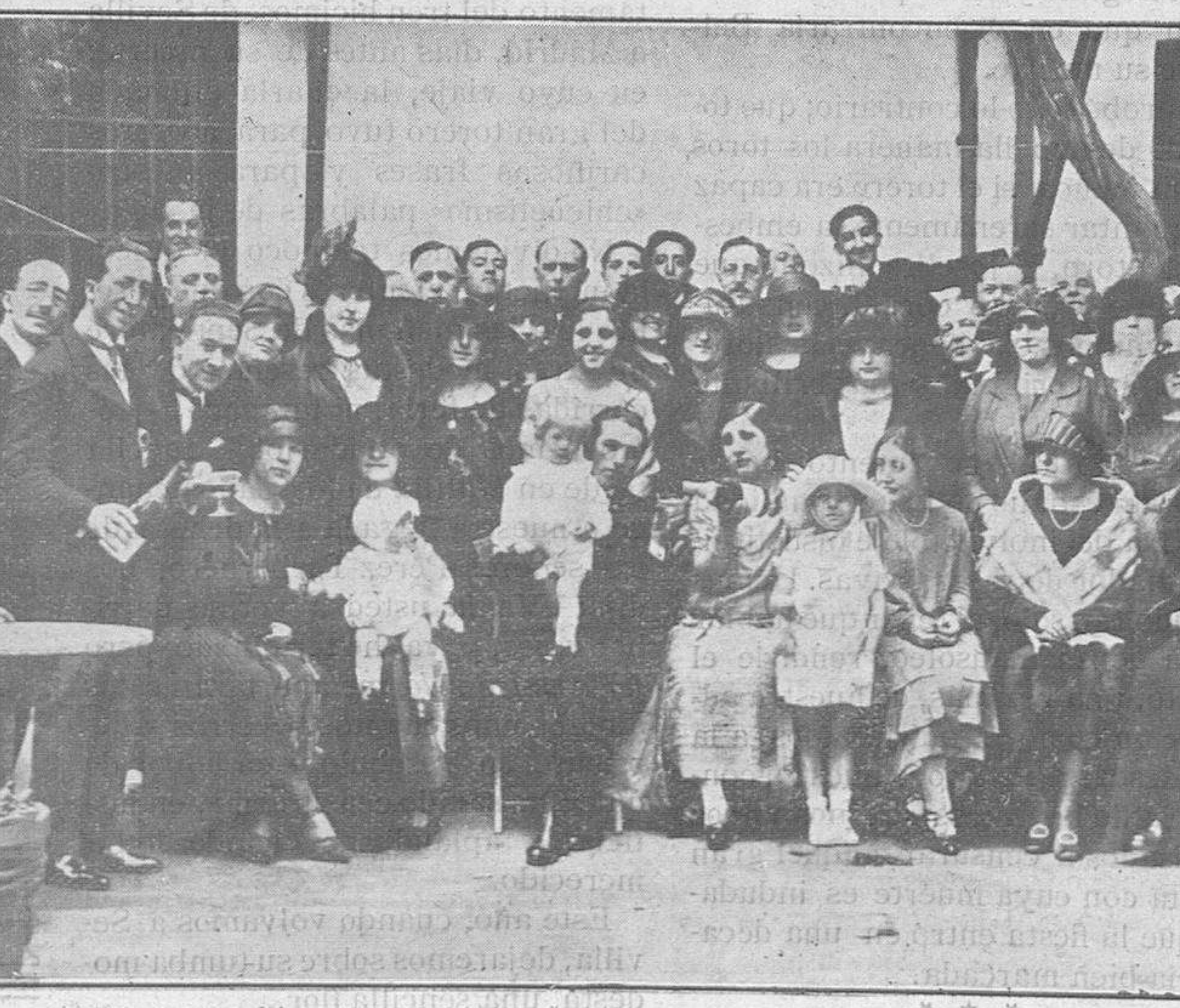
Los novios, sus familias y los invitados.