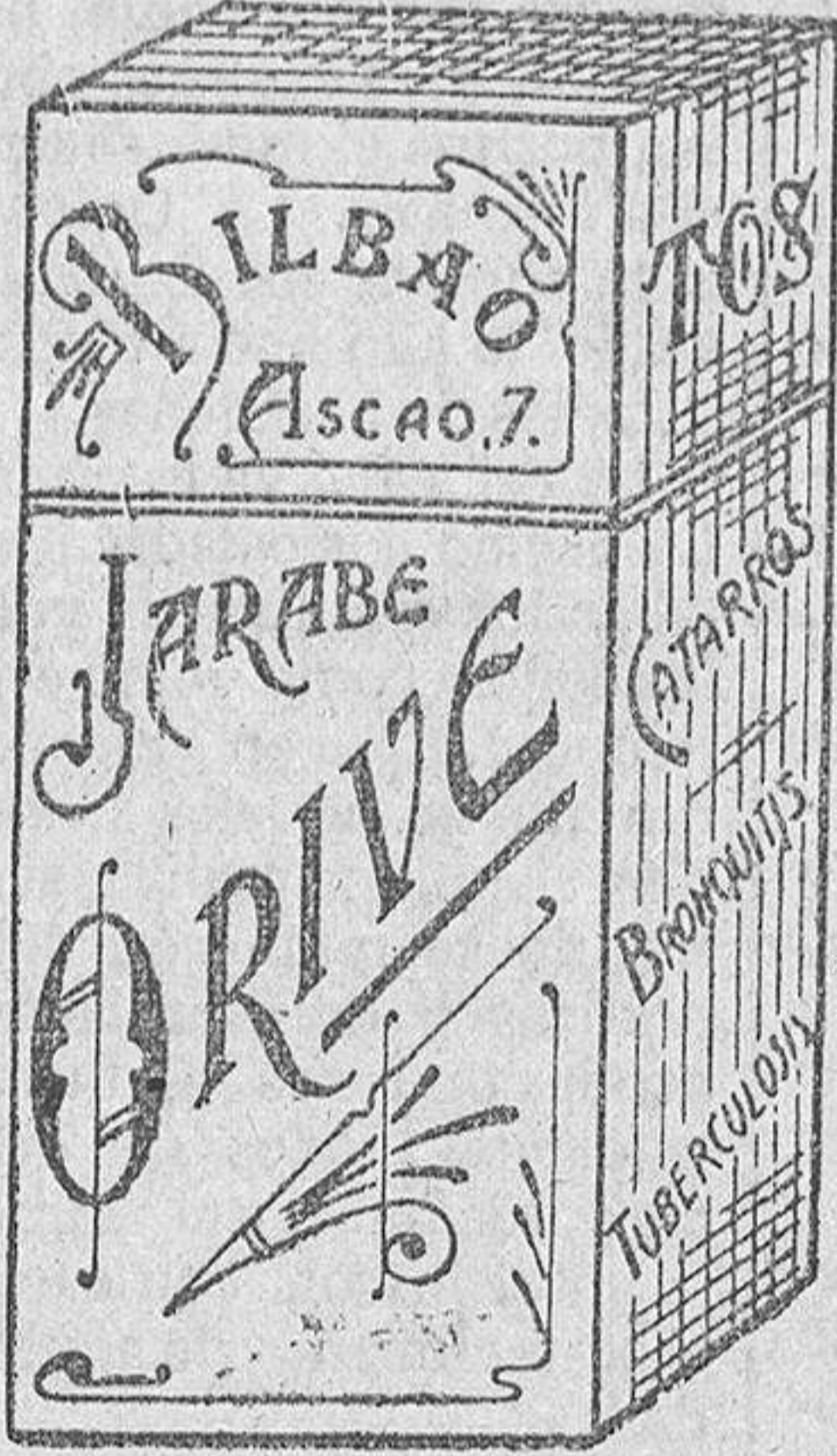
El mejor remedio para el peor catarro, Jarabe Orive.

Bien se yo que con esto peligraba la existencia de alguna Universidad. ¡Yo que le iba a hacer! Sería que tal Universidad no tendría savia para su vida. Pero yo os juro que no pasó por mí la idea de que fuese la Universidad de Salamanca la que se suprimiera, porque entiendo que era un deber del Estado conservar-