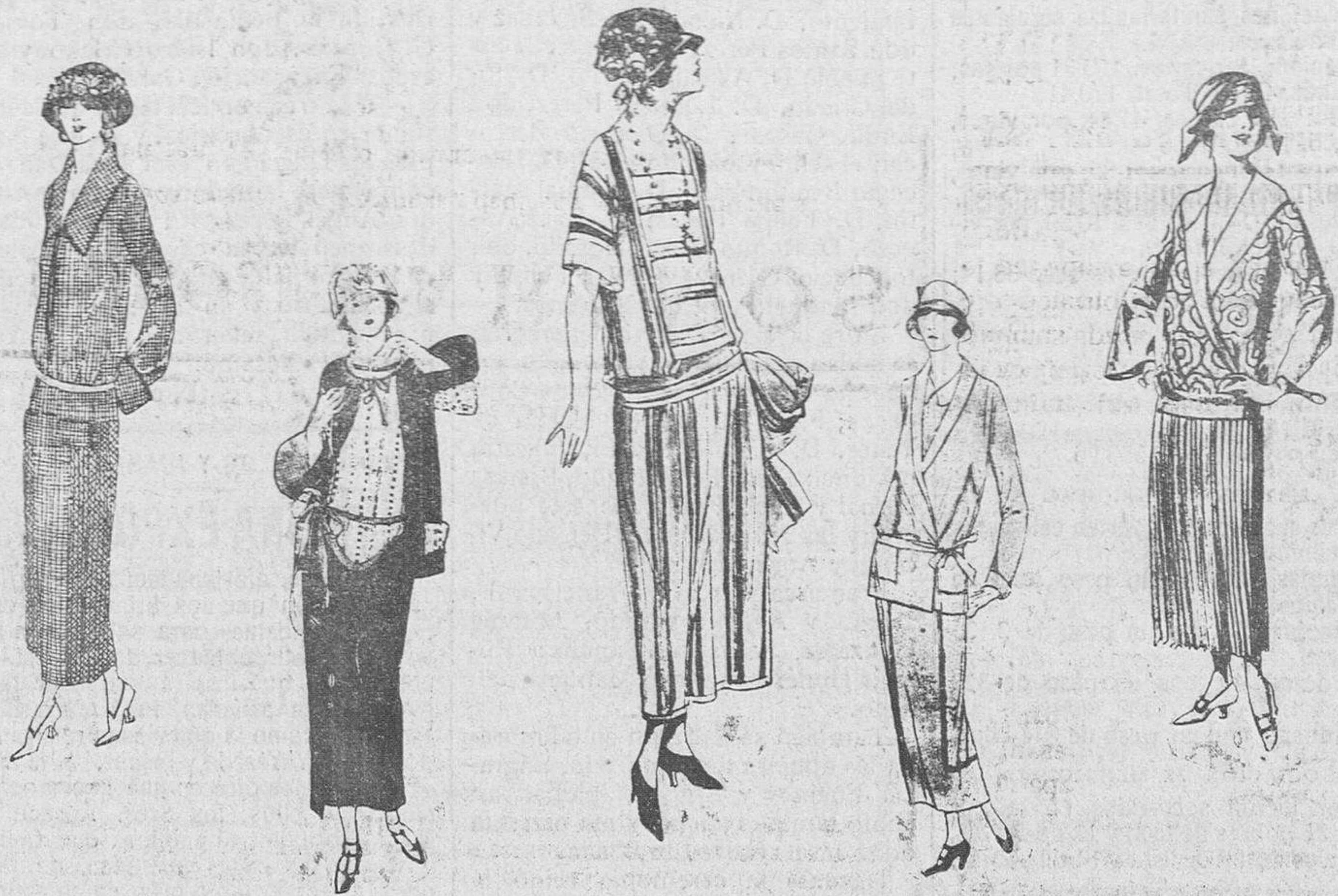
LA MODA - De izquierda a derecha: Vestido de lanilla, a cuadros, muy sencillo y muy práctico. Vestido de crepé marrocaín, con blusa de seda, a grandes cuadros. Vestido muy a propósito para playa, en crepeline rayada. Vestido en crepé marrocaín, en tono beige, con adorno de trencillas. Precioso traje de crepé, con chaqueta estampada.

El segundo, cárdeno, bragado, con el número 68, le llamaban Madrieno ; también salió corriendo y con los cuernos bien puestos; le capearon lo que quisieron y le colocaron banderillas de todas clases, buenas, malas y malas; respondió marterle a Luis Montes, después de varios pases, metiéndose demasiado, con temeridad, y abriendo la mano