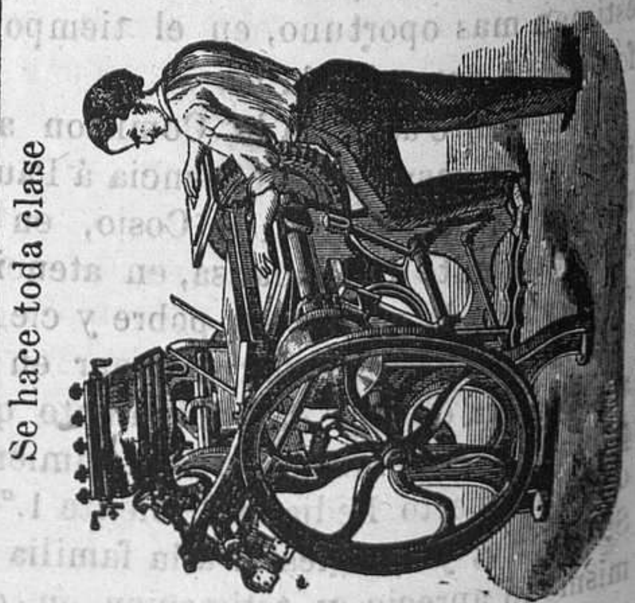
Se hace toda clase

En este Establecimiento se hace toda clase de impresiones para los Ayuntamientos y particulares.