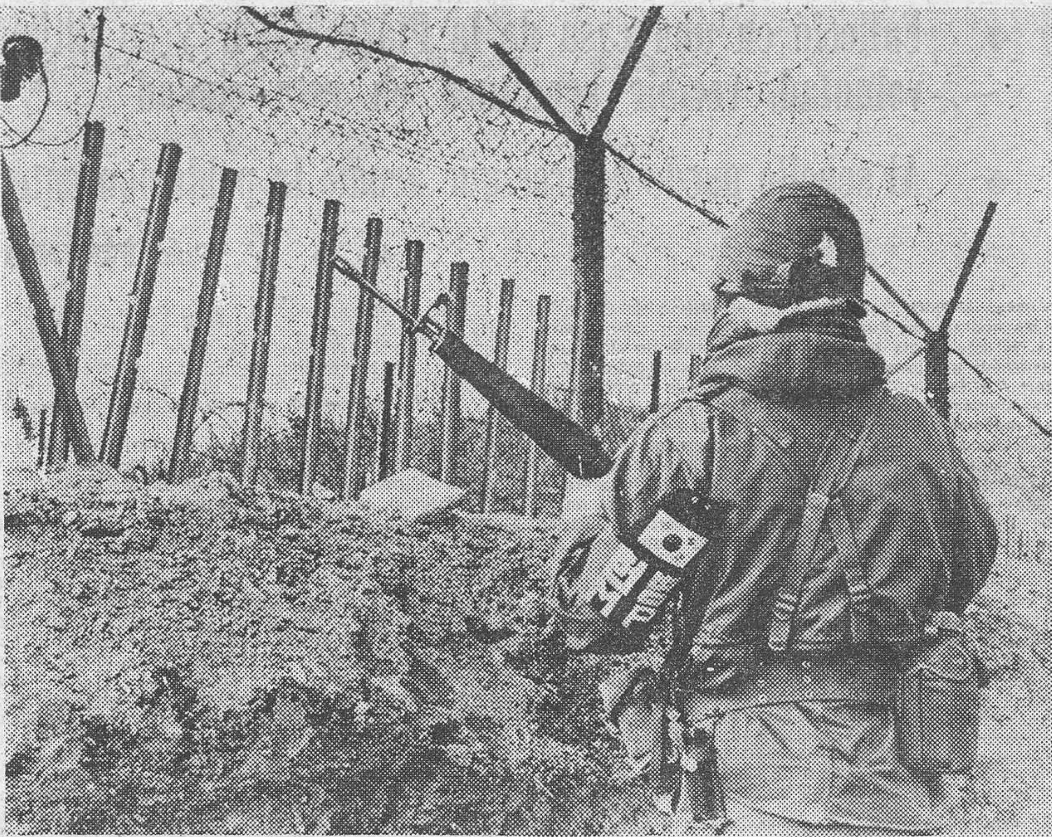
Un soldado surcoreano vigila la línea de demarcación entre las dos Coreas.