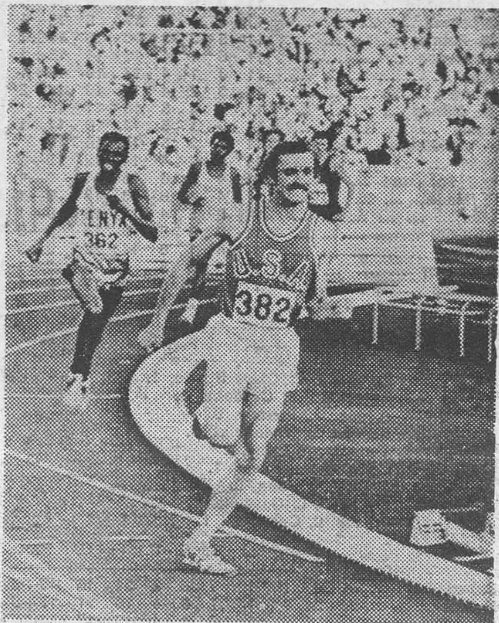
La indisciplina puede hacer que el atletismo norteamericano pierda el privilegiado lugar que hasta ahora mantiene en el marco del deporte internacional.