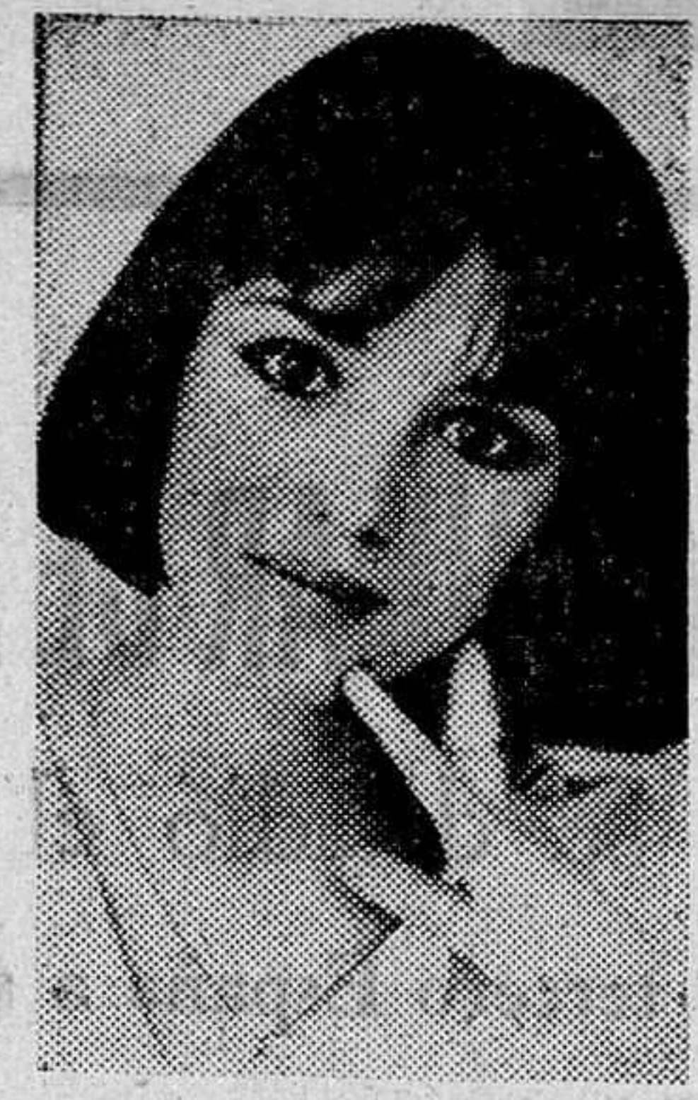
Isabelle Adjani con el pelo cortado a la moda actual de París.

Increible pero verdad: su cutis es naturalmente nacarado, sus mejillas rosa, sus labios rojos... Su único maquillaje de cine consiste en pellizcarse las mejillas para realizar el color natural y morderse los labios para darles volumen.