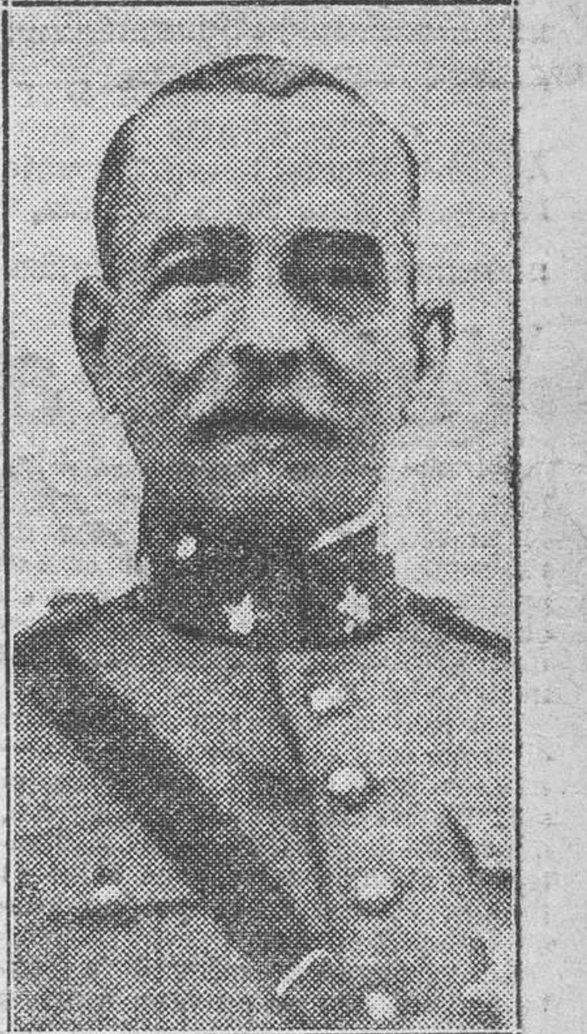
El presidente de la República de Portugal