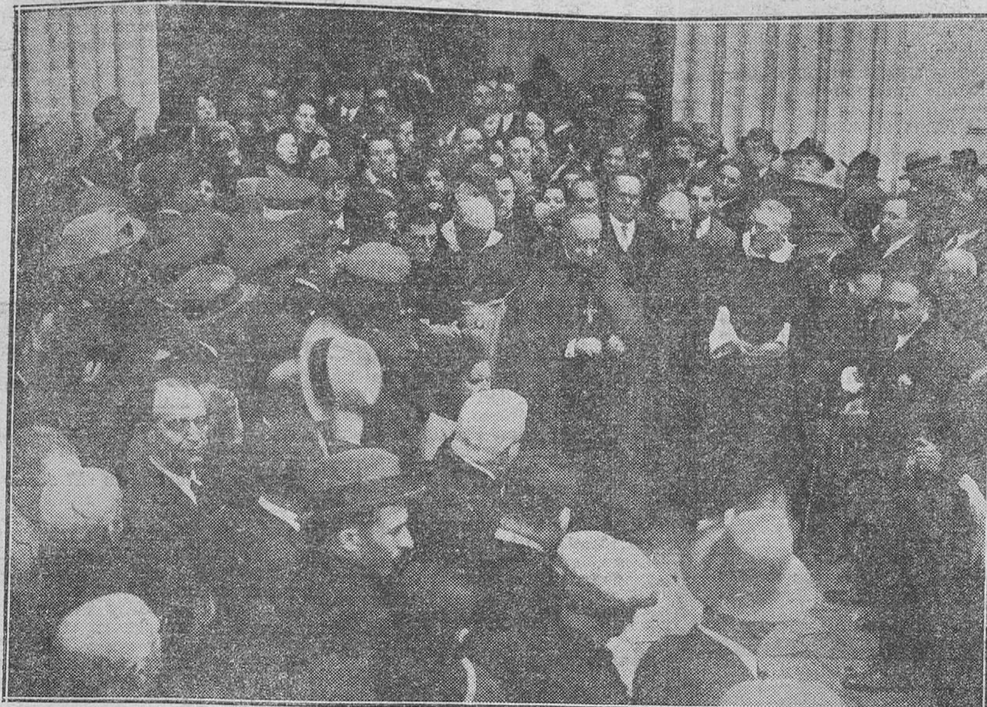
El señor Arzobispo a la salida del solemnisimo funeral celebrado ayer en sufragio del alma del señor marqués de Estella