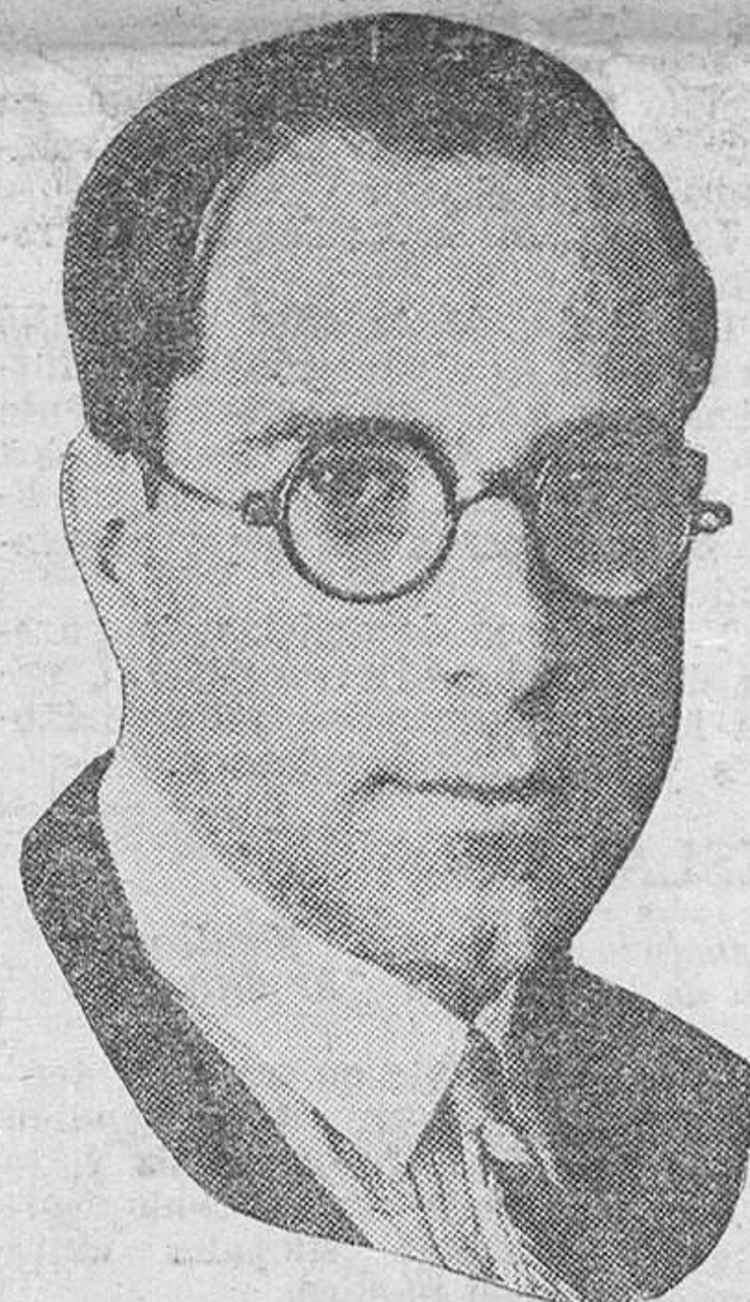
Santiago de Les

Pocas obras, pero bien demostrativas de los buenos deseos del artista y de su constante aspiración a perfeccionar la técnica y encontrar una estética propia.