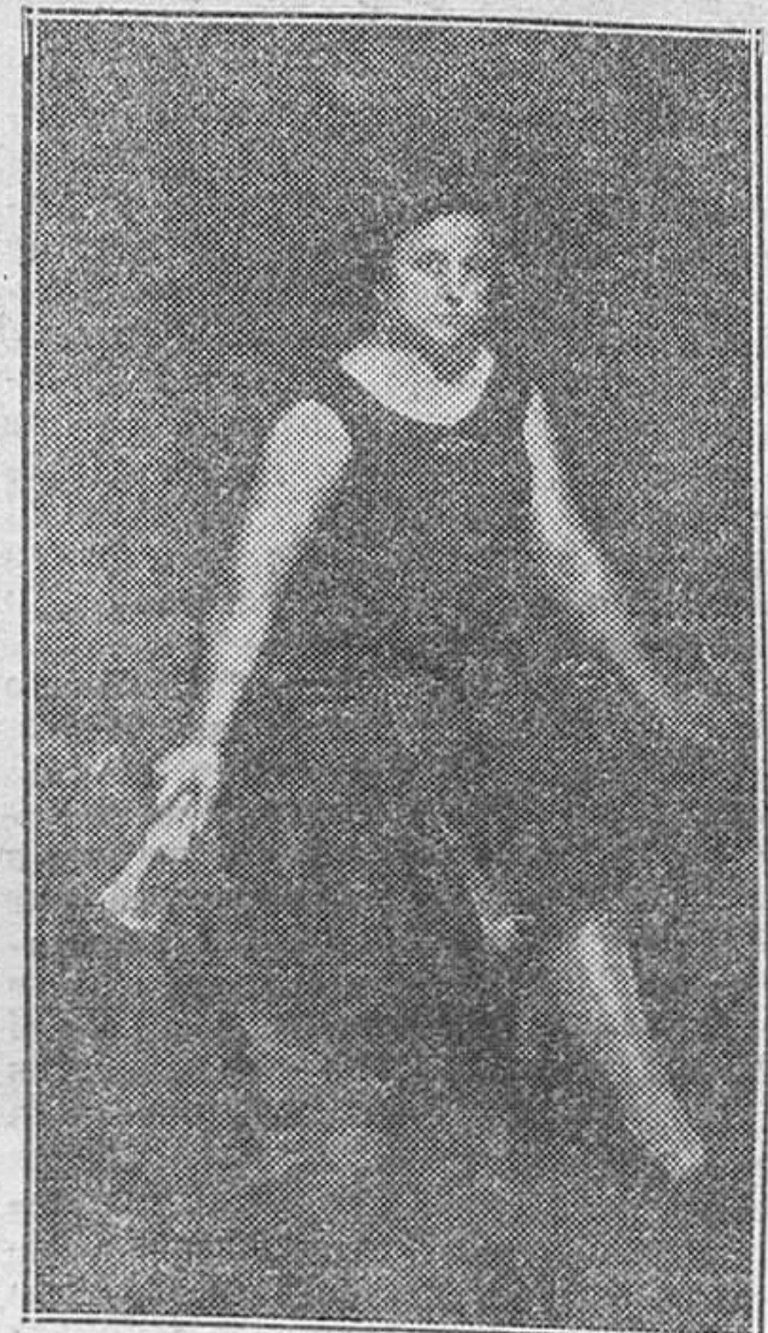
Uno de los retratos expuestos, obra de Les

Los retratos predominan en esta Exposición. Género difícil si lo hay, y por el cual tiene preferencias el señor Les.