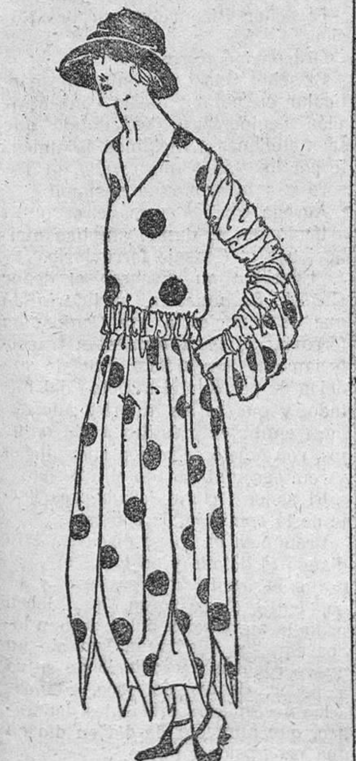
De muselina gris, estampada en azul. La falda está cortada a grandes picos regulares sobre un fondo de terciopelo gris. Las mangas y la cintura de tul, abullonado, con prendidos del tejido del traje, que puede completarse con una chaquetita de lanilla gris, bordada igualmente en azul.

Los echarpes largos, de más de dos metros, que puedan con toda comodidad dar vuelta al cuello, reclaman también su sitio. Serán de "aduda"