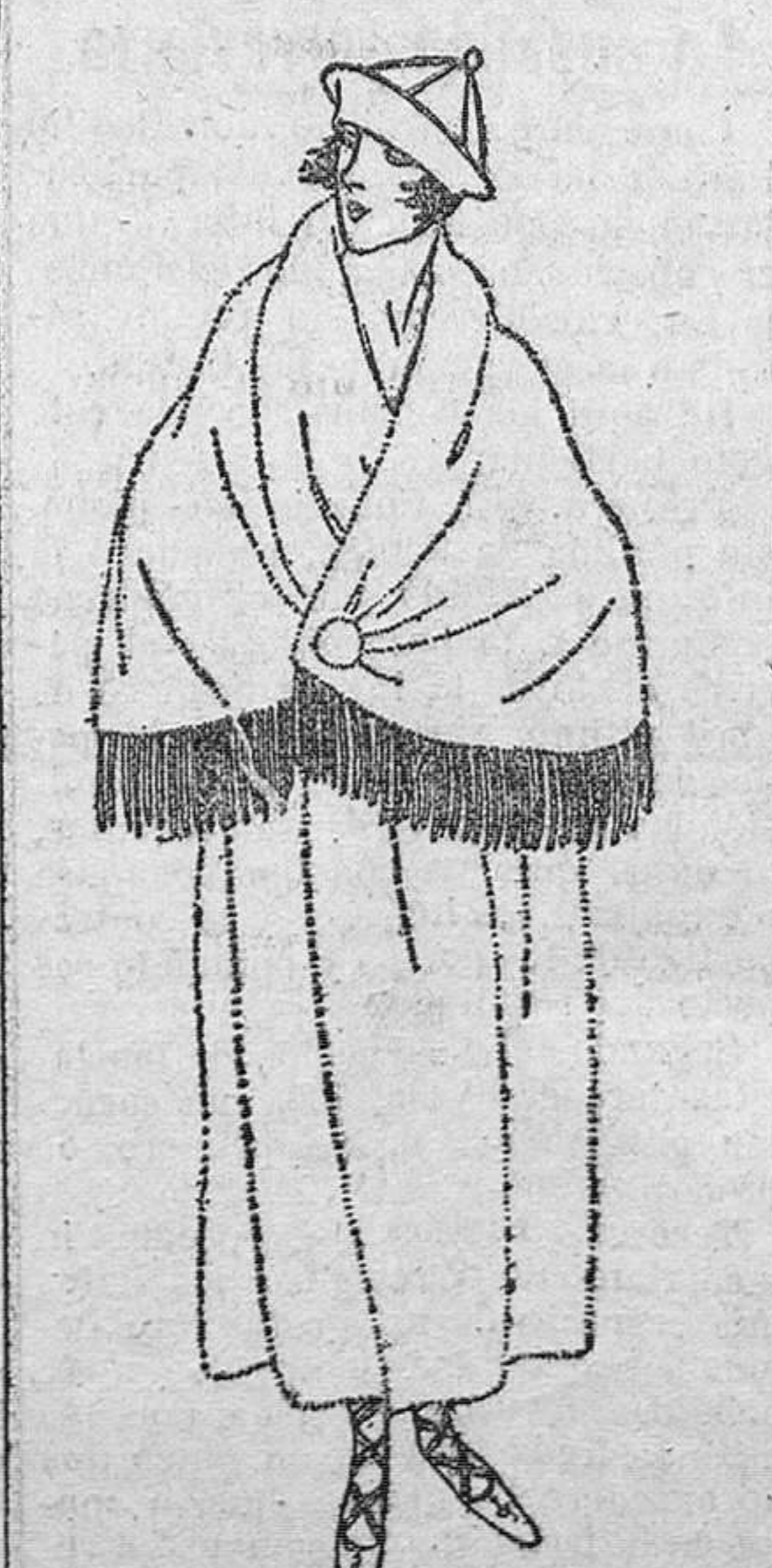
Amplia capa de baño, confeccionada en pedáneo blanco, y adornada en pelerina de un fleco de seda a capricho, combinado con la guarnición del gorriño.