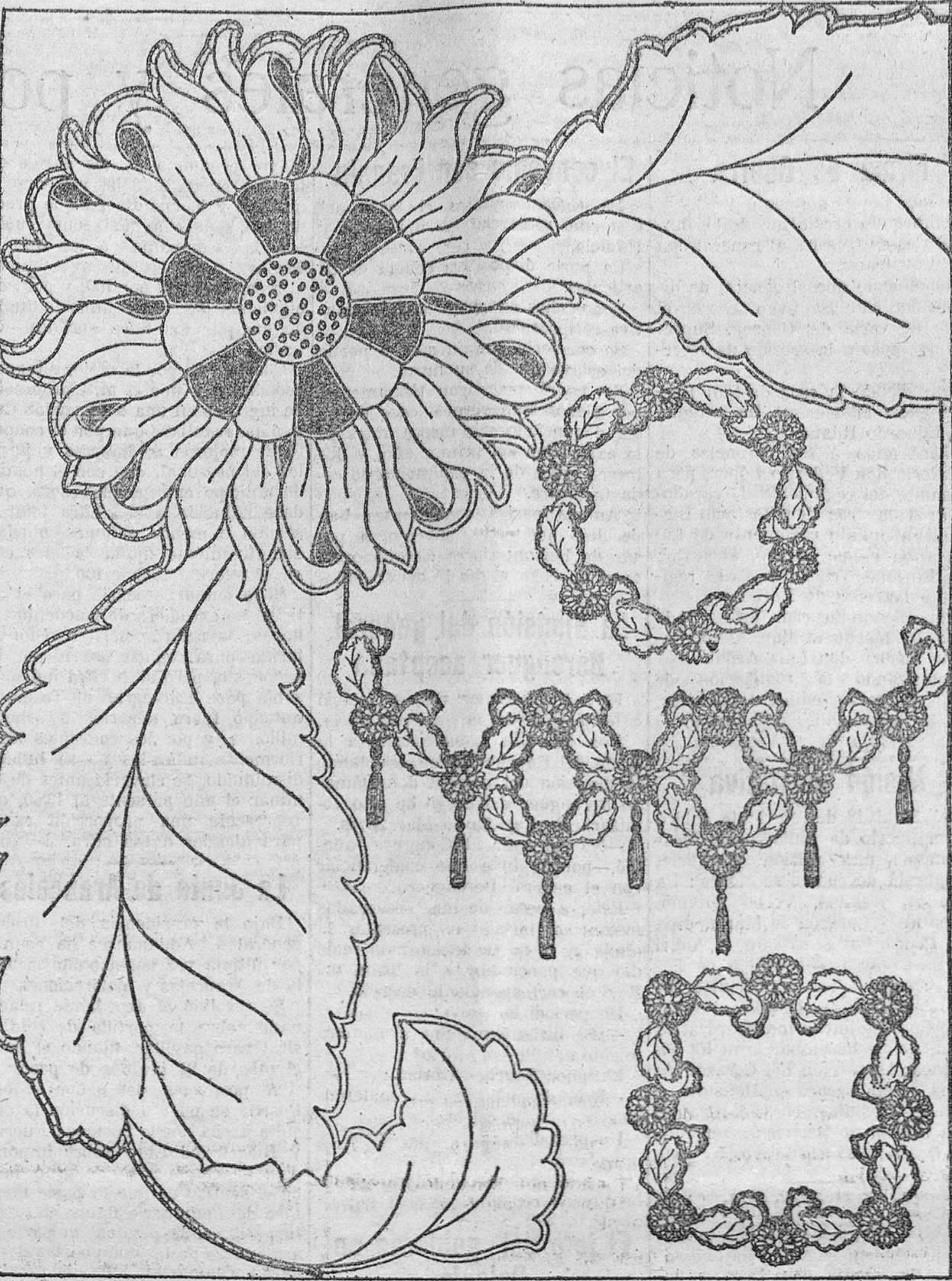
He aquí, delicadas señoras-obreras que partís de vacaciones, un dibujo a tamaño de ejecución—primero de una serie que os proporcionaremos durante el verano,—y que confeccionado en bordado Richelieu e inglés, con puntos anudados para el centro de las flores, puede servirnos para confeccionar un gentil stor o diversos centros de mesa, cubrebodegas, según modelo.