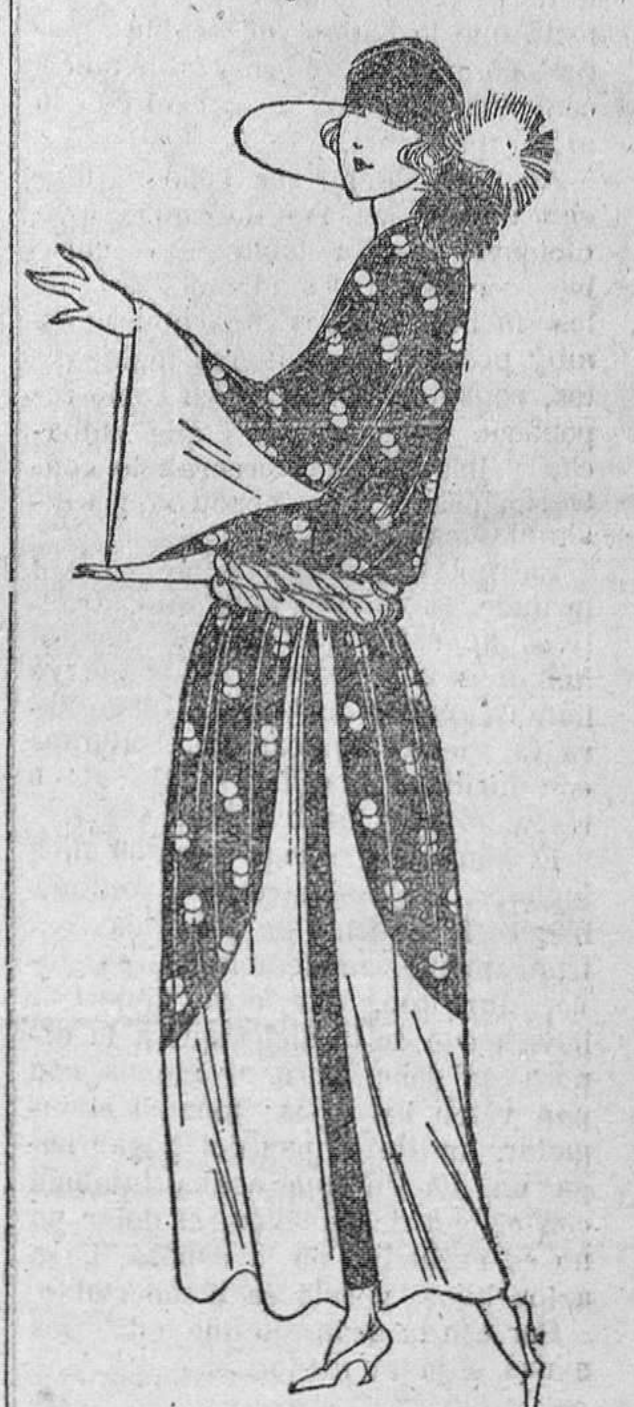
gandina amarilla y organdina azul estampada de lunares amarillos. Para una falda corriente se necesitan un metro ochenta centímetros, de la primera, y dos y medio de la azul

rey de una comarca que él había enriquecido con sus iniciativas económicas de todas clases. Lo había Combinación originalísima de or-