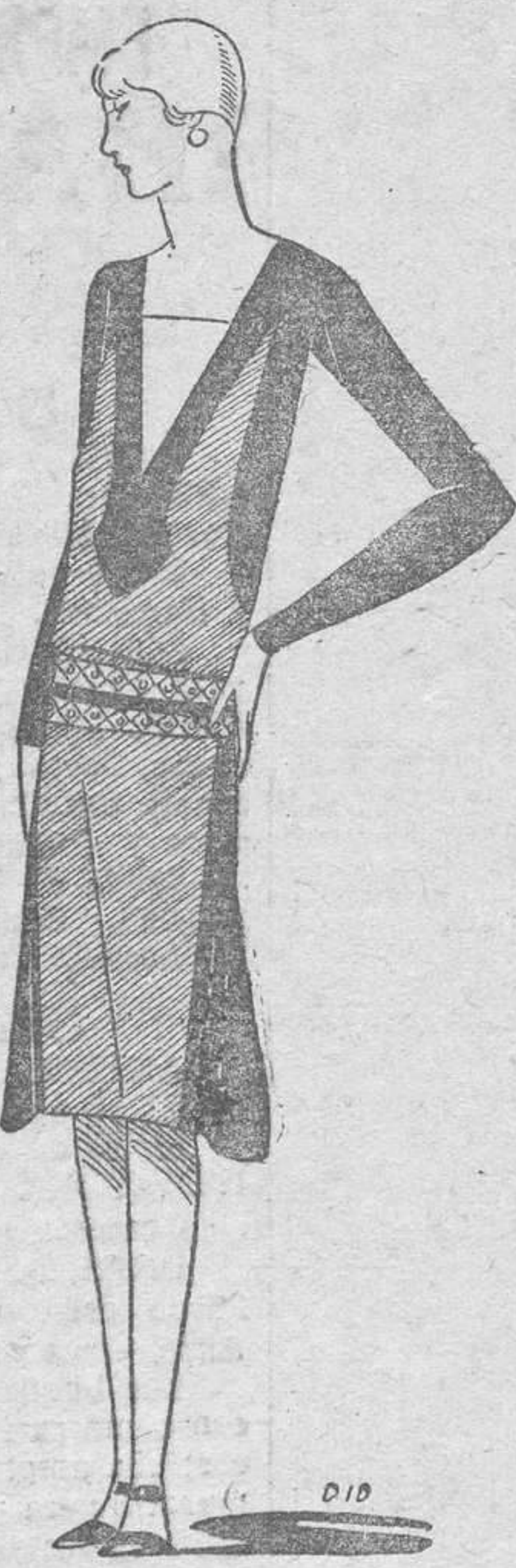
Vestido de crepé satin negro y crepé satin, puñeto del revés

cido de una manera imponderable en hermosura; resplandecía, por decirlo así, en fuerza de vida, de frescura y de juventud.