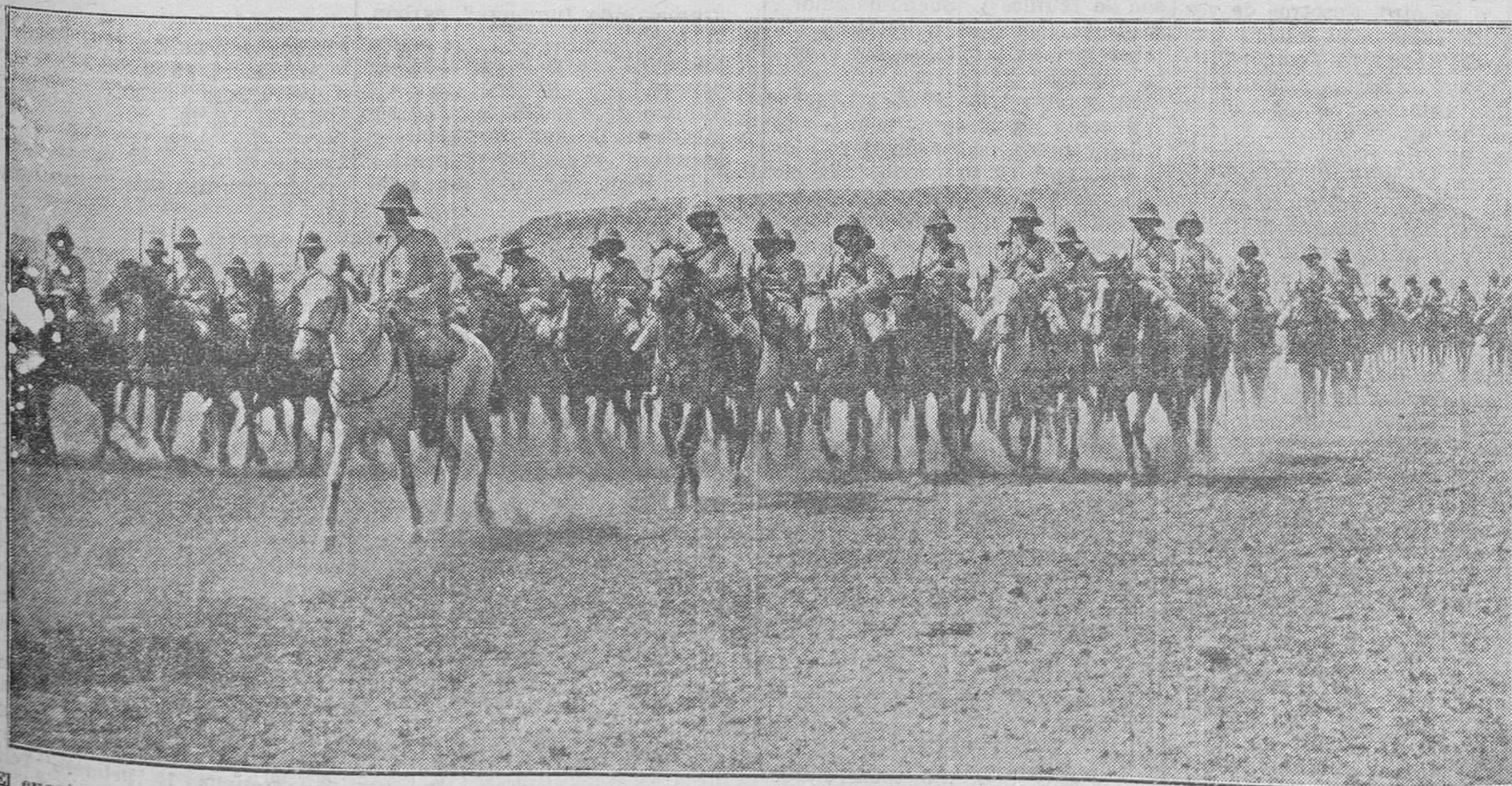
El cuarto escuadrón de Cazadores de Alfonso XII en marcha hacia el campamento, después de la brillante carga de Taxdirt, por la que se le concedió la corbata de San Fernando

Al acto se invita a todos los correligionarios del pueblo y lindantes.