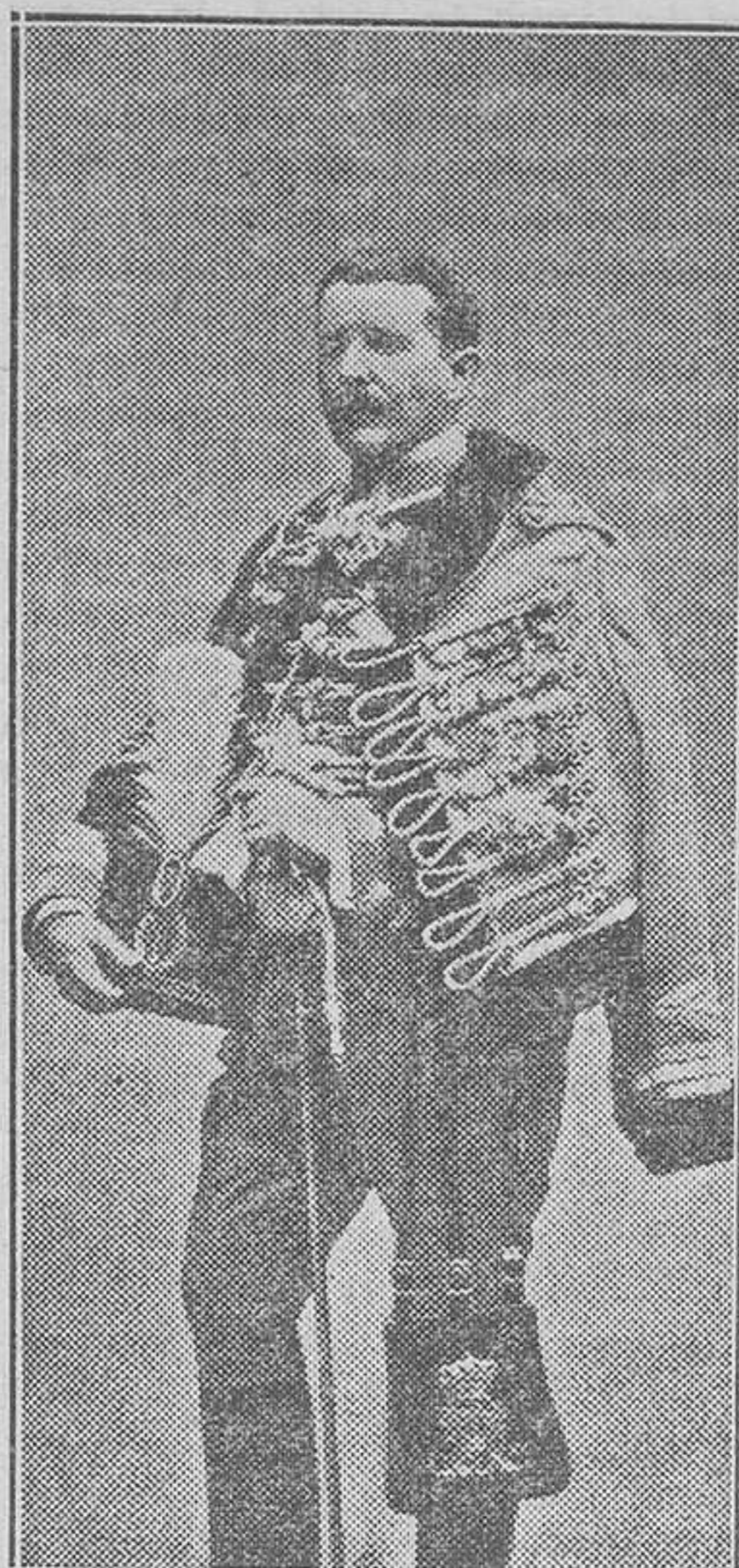
Don José Cavalcanti de Alburquerque

historia, fué el combate de Moncloar y la defensa de Agramunt, proporcionándole laureles que luego aumenta en Cuba, el 2 de Septiembre de 1895, en la acción de Cacaotal, combate de San José de Tabalo, y los que sostiene el día 4 en las Mercedes y las Yeguas; Cuatro Compañeros (8), Guasimas de Machago y Jimaguayo, arro-