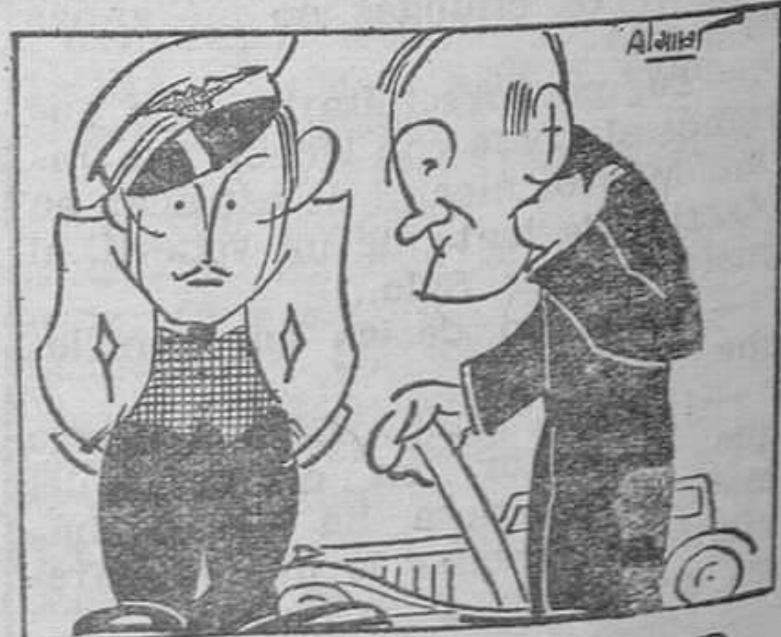
DIALOGO DE ACTUALIDAD

—¿Y usted qué prefiere, la "Esquerra" o la "Lliga"? —Mire, francamente, yo prefiero los autos HILLMAN MINX.