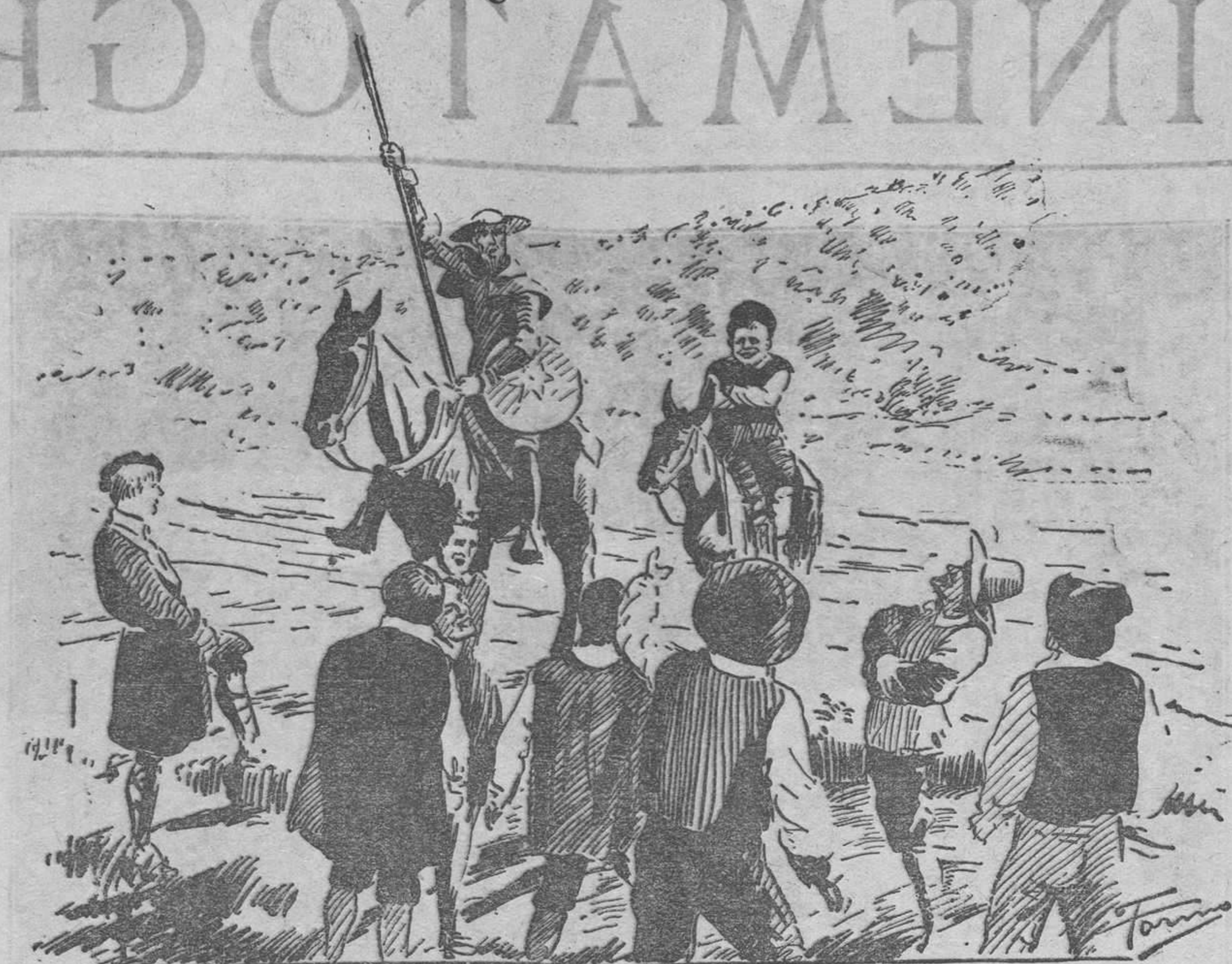
Don Quijote, en una de sus salidas