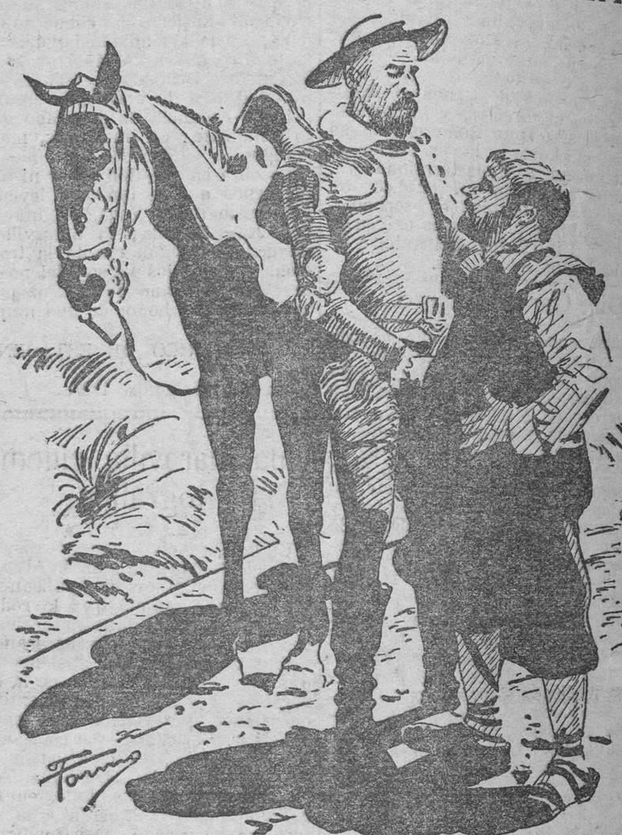
El caballero de la triste figura, platicando con su escudero