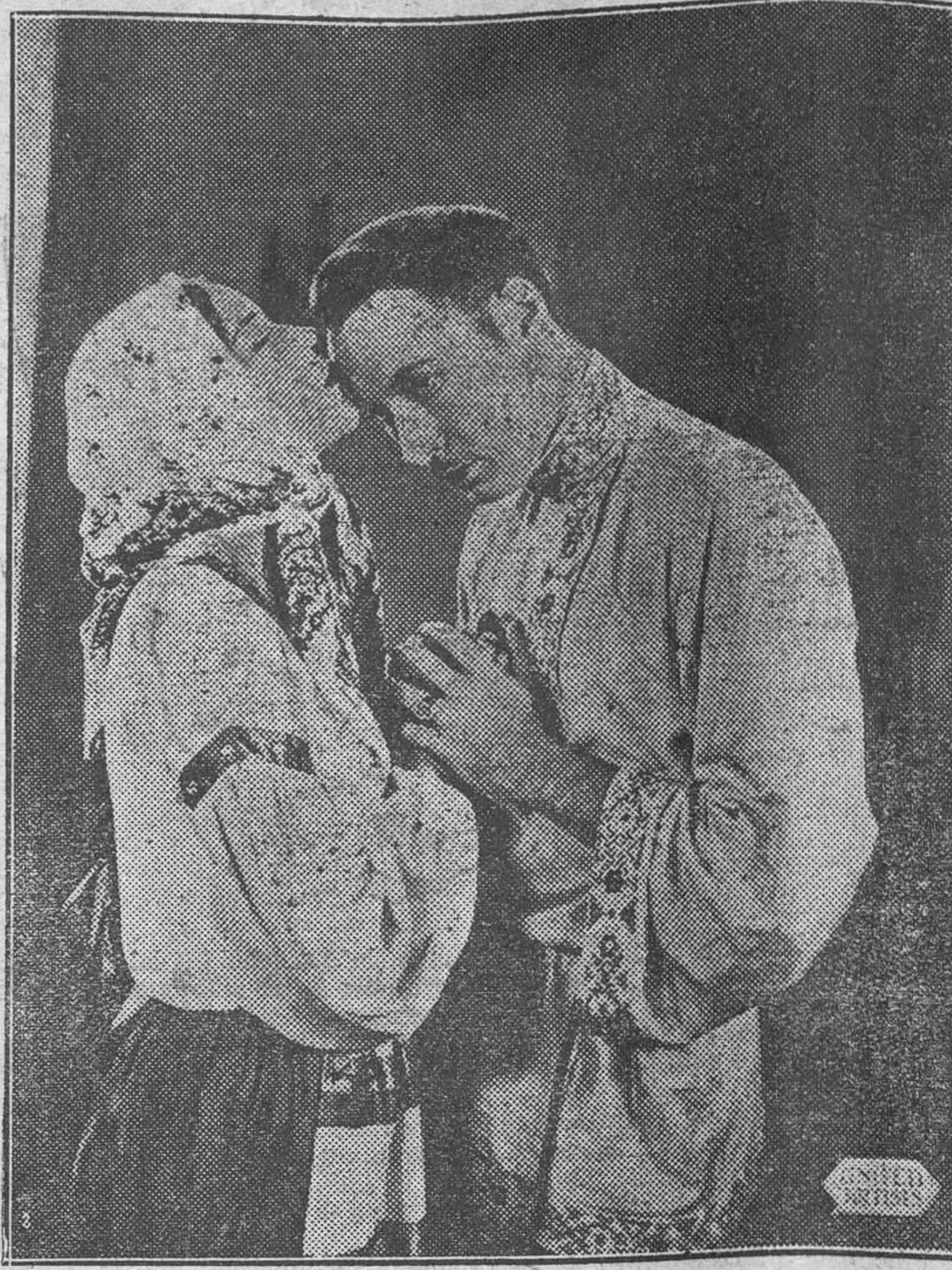
Una escena con Rod La Rocque y Dolores del Río, de 'Artistas Asociados', en 'RESURRECCION'.