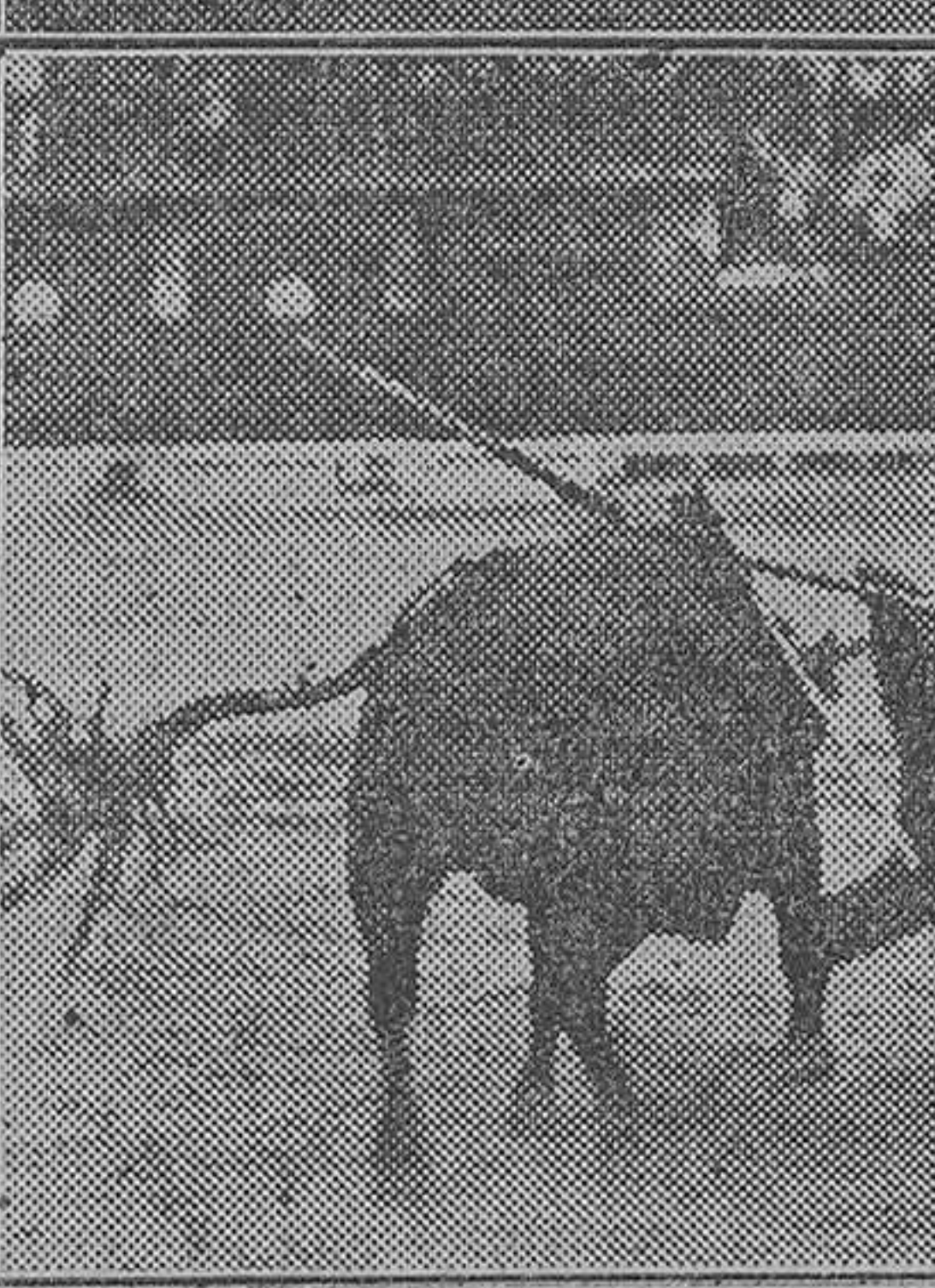
Chicuelo en un quite capote a la espalda—Valencia II muleteando por alto.—Villalta en un pase natural.—Félix Rodríguez al terminar un quite

asistir a su entierro moral, debido al estocazo material de la adversidad.