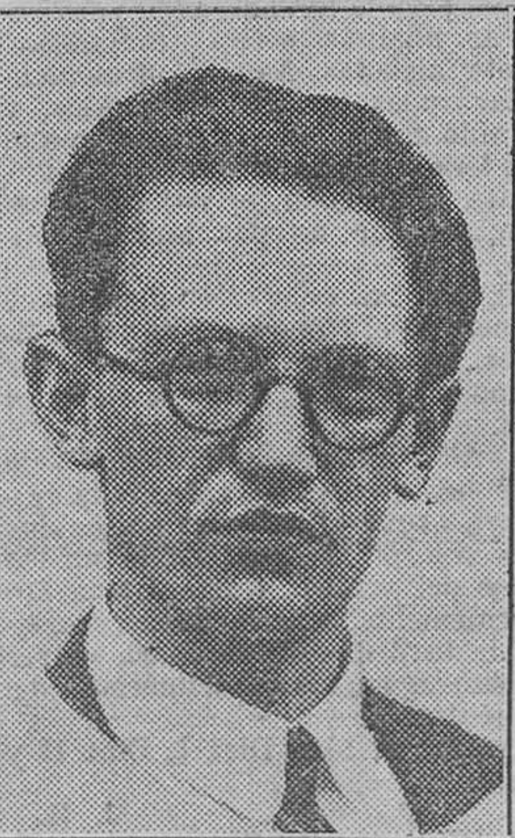
MR. OCTUBRE, otro de los artistas que han obtenido el primer premio.