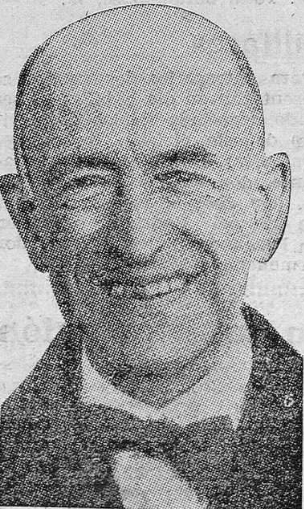
El maestro Falla, que ha rechazado el homenaje del Ayuntamiento de Sevilla, porque se lo impiden sus creencias católicas.

Hasta aquí Vautel. Pueden los lectores ver cómo a título de democracia se va creando en el mundo el más absorbente dominio de una clase social sobre las demás. Y no está lejos de casa el ejemplo.