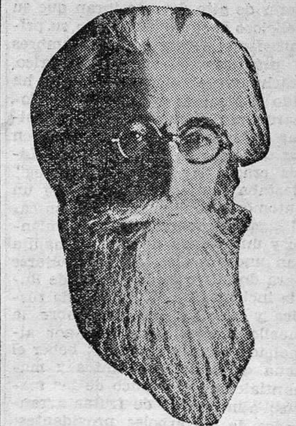
Don Ramón del Valle-Inclán, elegido presidente del Ateneo de Madrid, por 311 votos, entre 654 votantes

31 de Mayo 1932. Sobre la Península Ibérica es uniforme la presión atmosférica, por lo cual la atmósfera está en calma o bien los vientos son débiles de rumbos variables. Tiempo probable: Poca variación del tiempo actual.