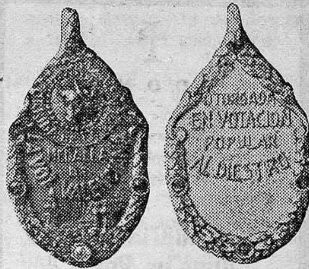
Anverso y reverso de la Medalla del Torero que ofrenda el diario "La Voz Valenciana" por votación popular, en la corrida de hoy

La mayoría de los Ayuntamien- tos se mostraron conformes con esta obra y se comprometieron a contribuir con el 50 por 100 de su costo, concediéndose un plazo de 15 días para que los Ayuntamien- tos se adhieran o recusen el pro- yecto.