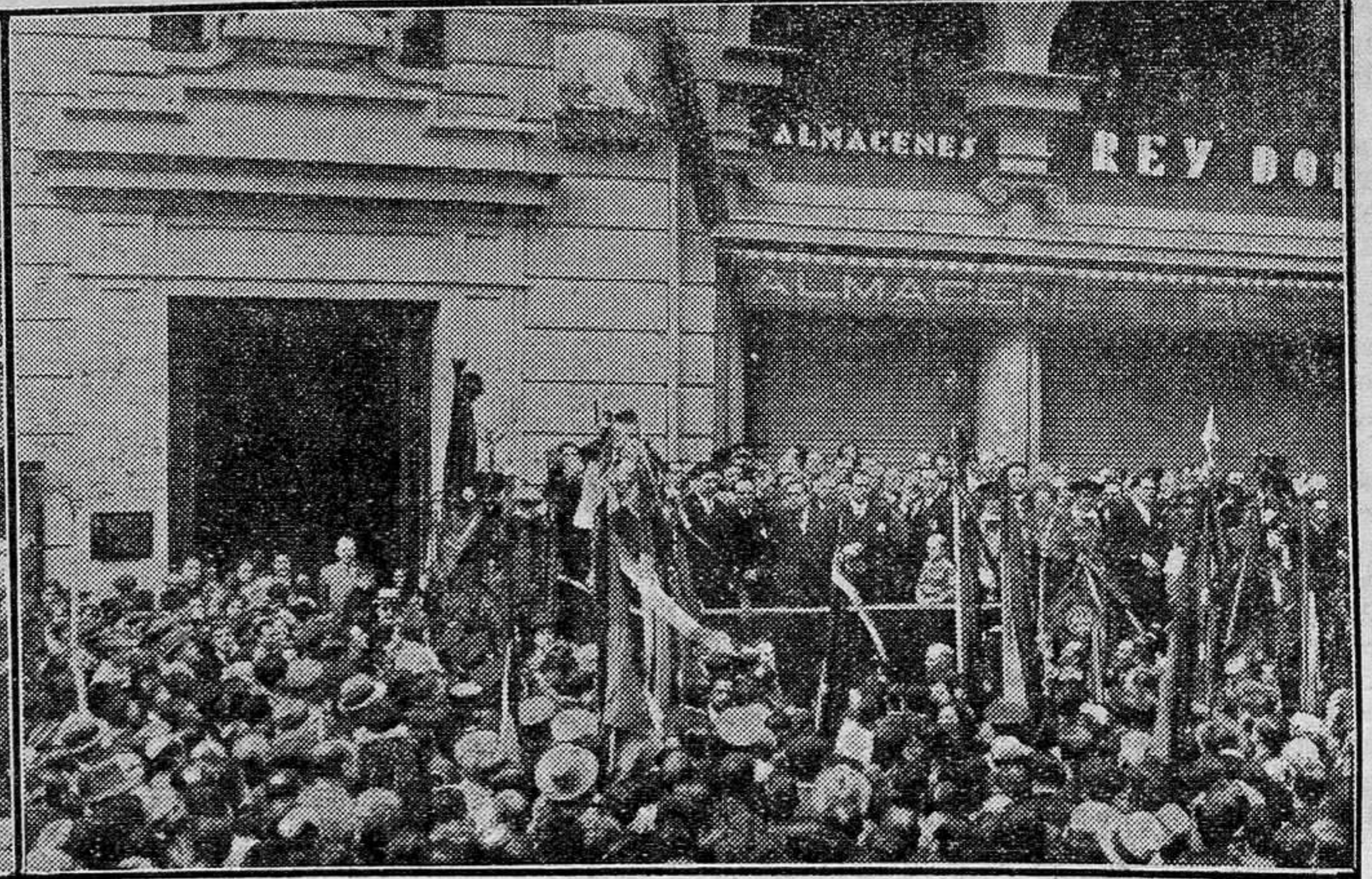
En el Paseo de la Castellana, de Madrid. Desfile militar, ante el presidente de la República, celebrado con motivo de las fiestas conmemorativas del primer aniversario de la proclamación de la República. (Fot. Vidal).—Valencia. El alcalde pronunciando un discurso en el acto de descubrimiento de la lápida que da nombre de Avenida de Blasco Ibáñez a la antigua plaza de Cajeros y parte de la de Castelar. (Fot. Barberá Masip.)