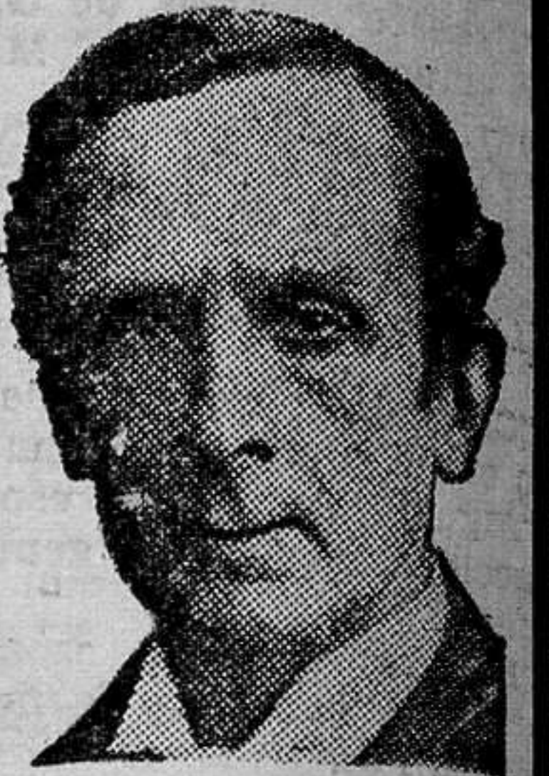
Cura recomendada por la gran autoridad médica Sir Morell Mackenzie.