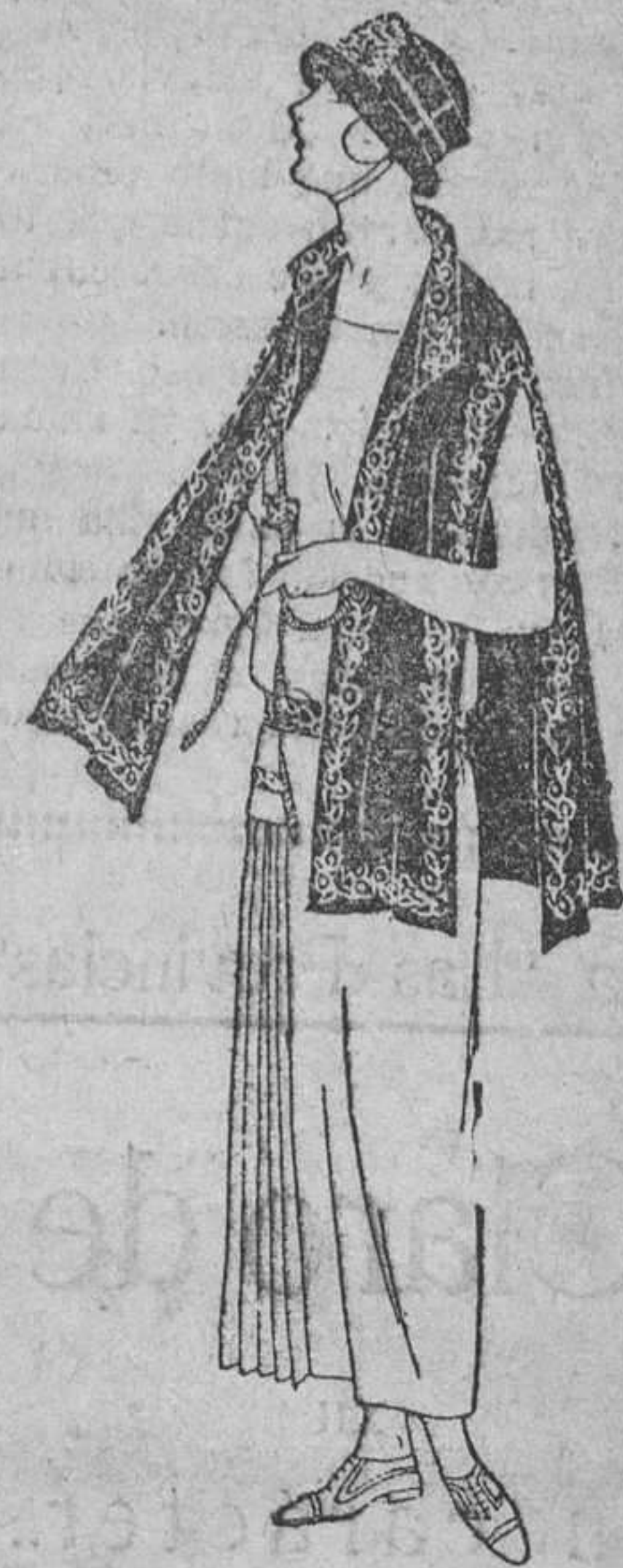
En sarga blanca, bordado en la cintura, y bolsillos de azul rey. Los lados de la falda van plisados. Paletot de sarga azul bordado en blanco, que forma capa en la espalda y echarpe delante.

Segunda muñeca.—No fite en enhorabuena de amigas. Unas han dan por pura bonería; otras buscan confesión o confidencia, para saber a qué atenerse, muchas, para que el ridículo sea mayor; unas pocas, por envidia recóndita... Hágase la descontentada, no se deje por enterada, no deje adivinar su propio desdén, y... el tiempo dará lo suyo.