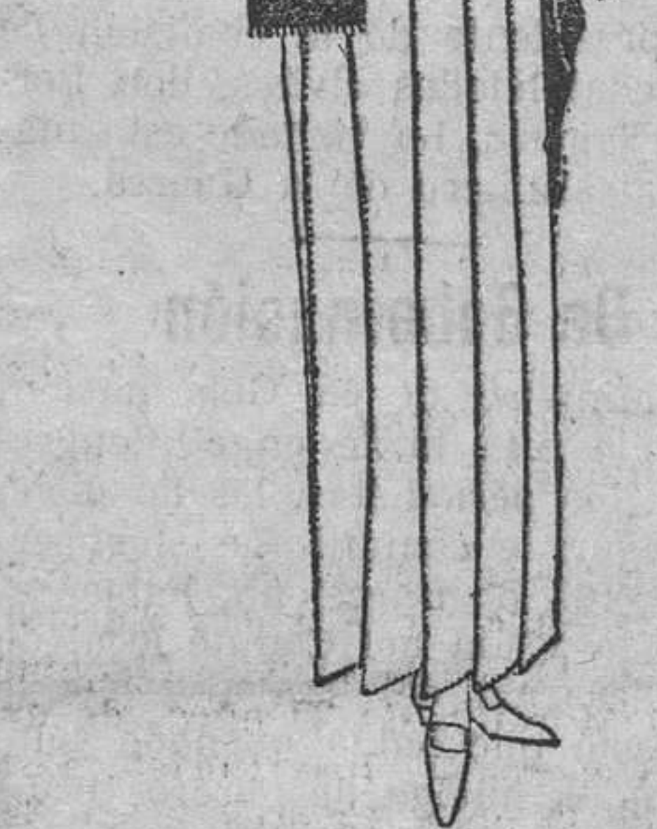
Original modelo de Levis. En Francia blanca, formando tablas festoneadas...

Al besarla, sobre el estribo del wagon... Tal vez sí.