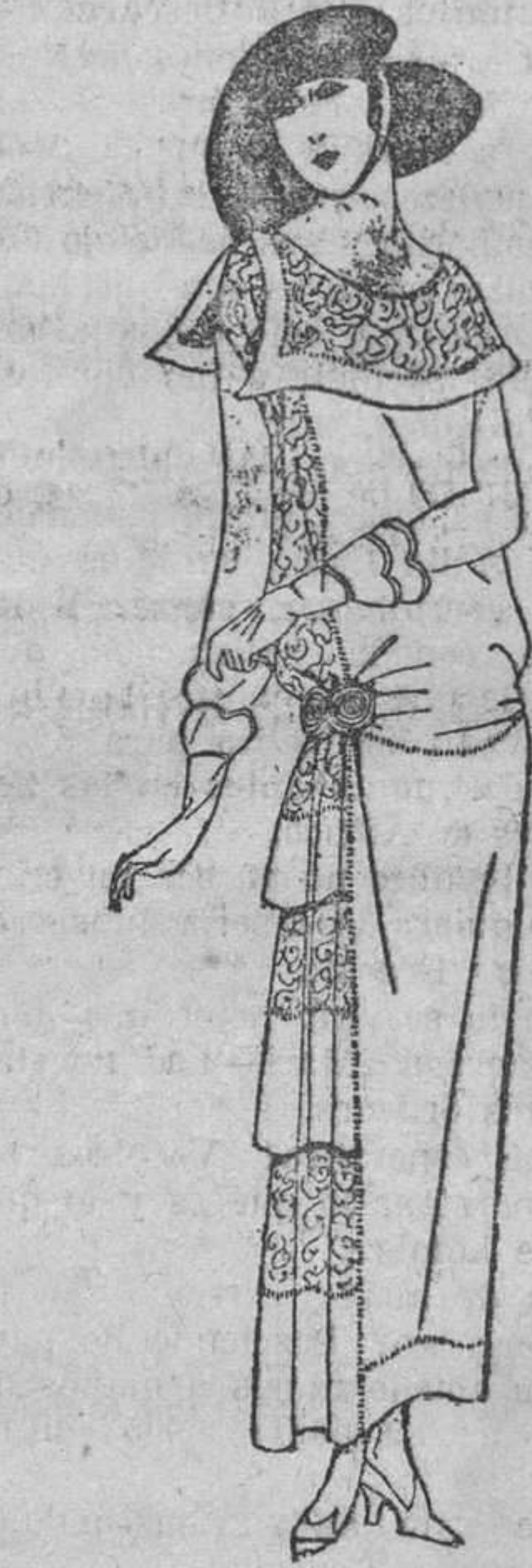
En organdi blanco, sujeto a ambos lados por cabuchones de fantasía. Por los lados se advierten unos volantes de blondas verdes, así como el cuello, que cierra a un lado artísticamente.

A la segunda jovencita, me atrevo a recomendarla también que teniendo como parece, gran confianza con su buen padre—¡la compadezca por tener madrastra!—le haga la confidencia con que tiene la bondad de favorecerme. No tema, señorita, los hombres medianamen-