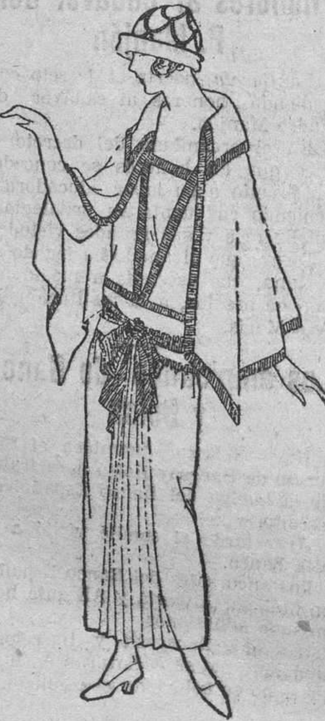
Modelo de Huard. Falda plisada en el centro de delante; blusón y capilla del mismo género, bordados de trencilla fantasía.