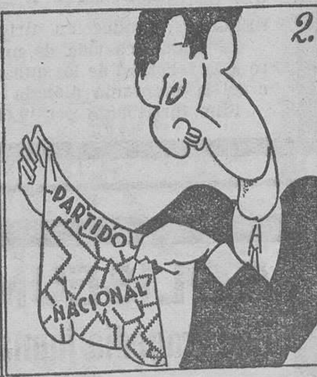
Otro partido formado. ¿Partido? ¡Descuartizado!