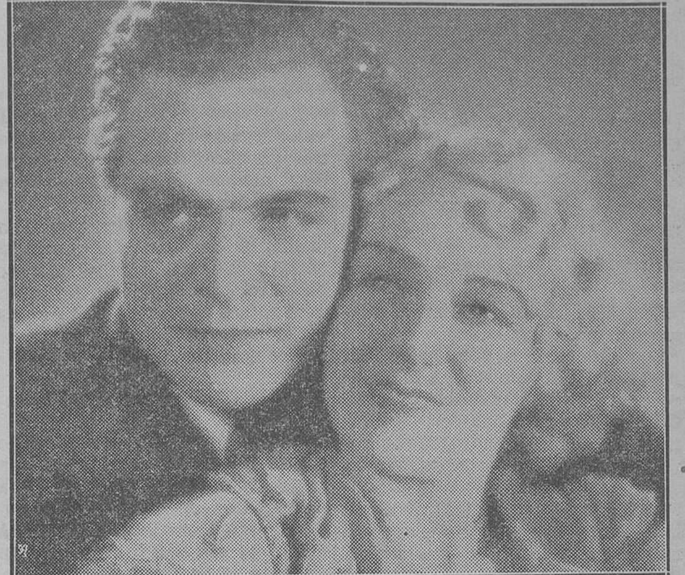
Los protagonistas de "El amor y la suerte", fantasía cinematográfica francesa doblada en los estudios "Almira", de Barcelona, por artistas españoles. Supera a todo lo producido en el extranjero y se anuncia así: Una hora y media de continuas carcajadas

El hombre que, contra la opinión de la antigua familia, coge a su mujer y a su hijo y en destartado carro busca el camino de la ciudad naciente, hoy próspera Oklahoma, batallando por rendir culto a la verdad y manejando lo mismo la pistola que los libros de ejercicios espirituales y arrobos místicos, combatiendo incansable por la redención del indio y por realizar los sublimes principios del amor al prójimo, concluyendo por morir de una manera trágica y generosa, como casi siempre ocurre a los verdaderos redentores, merece una obra de relieve inmenso, de técnica insuperable, de conjuntos costosísimos, de toda la tramoya, en fin, que necesita un film cumbre, una grandiosa película como indudablemente es "Cimarrón".