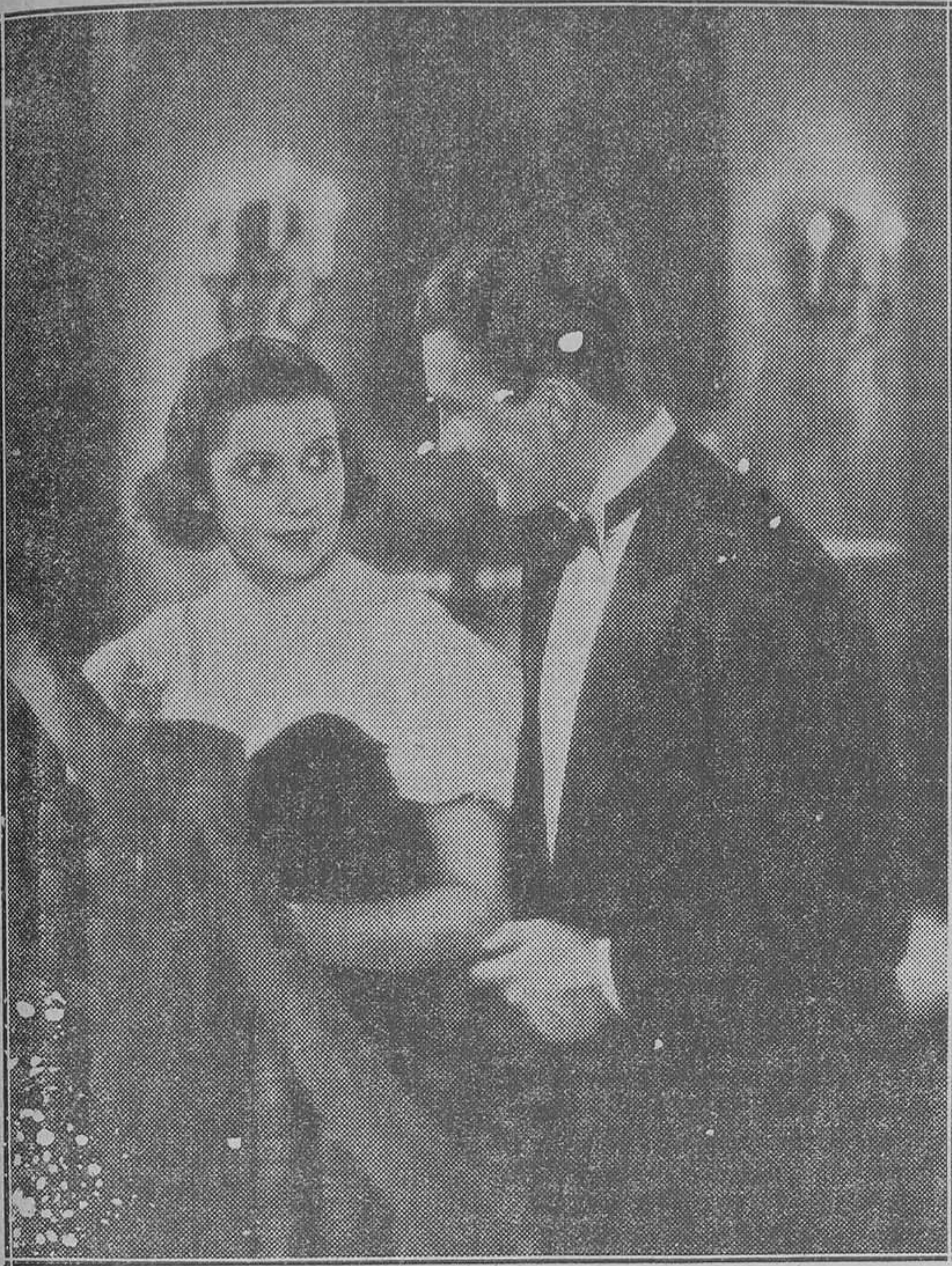
LIRICO.—En el gran film "Los diablos de la cumbre", que el lunes se estrenará, existen delicados matices como el de este grabado, no obstante la calidad deportiva que constituye el fundamento de esta exclusiva "La Sosopi".

Sacrificio hasta el fin... Renunciación..., todo por él, hasta después de muerto. Los protagonistas, Bárbara Stanwyck y Adolfo Menjou, admirables en sus respectivos papeles; ella, sin amaneramientos, fina y sensible; él, el galán correcto y maduro que ya conocemos. Ralph Bellami otro gran artista.