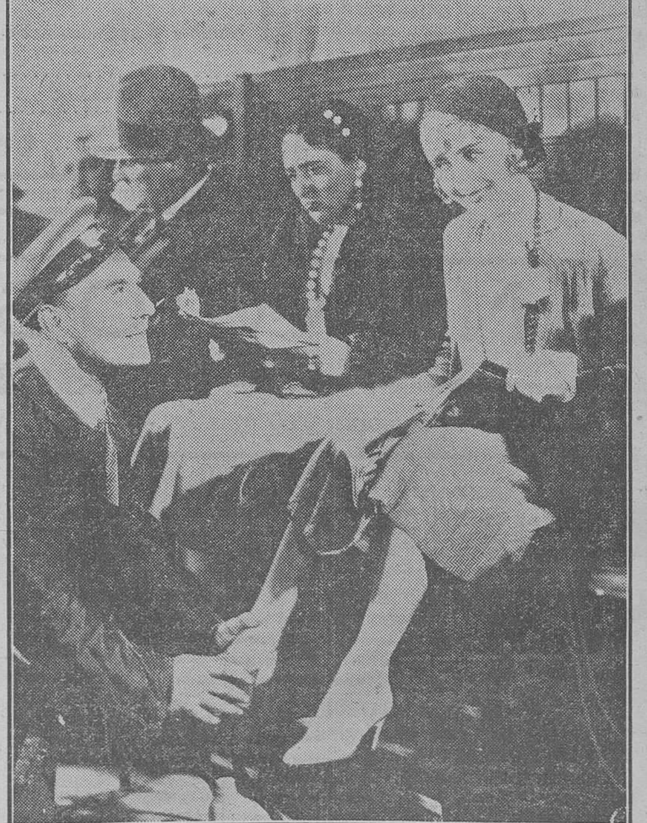
Uno de los muchos momentos regocijantes de "El Rey del betún", por George Milton. Exclusiva "La Sasopi", que ayer se estrenó y hará desfilarse a miles de personas deseosas de acaparar buen humor para bastante tiempo