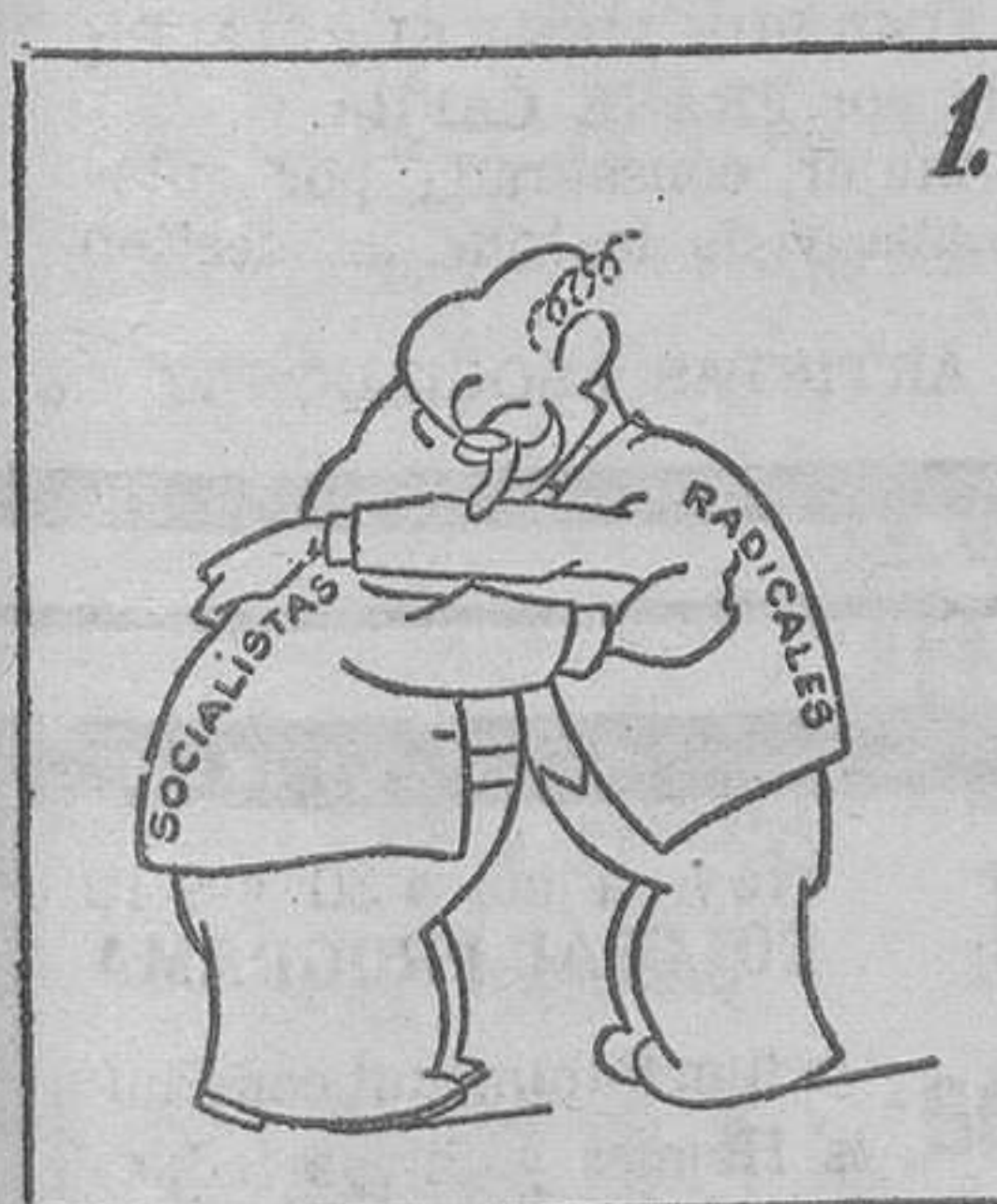
Con un abrazo, falaces, Inda y Ale, hacen las paces.