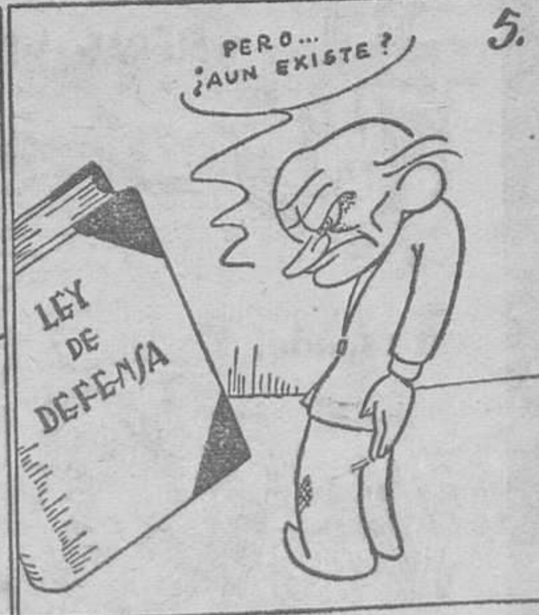
Vida hartó larga y extensa: la de la ley de Defensa.