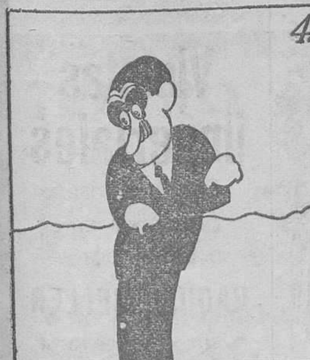
Maura se quedó sin gente; solo está completamente.