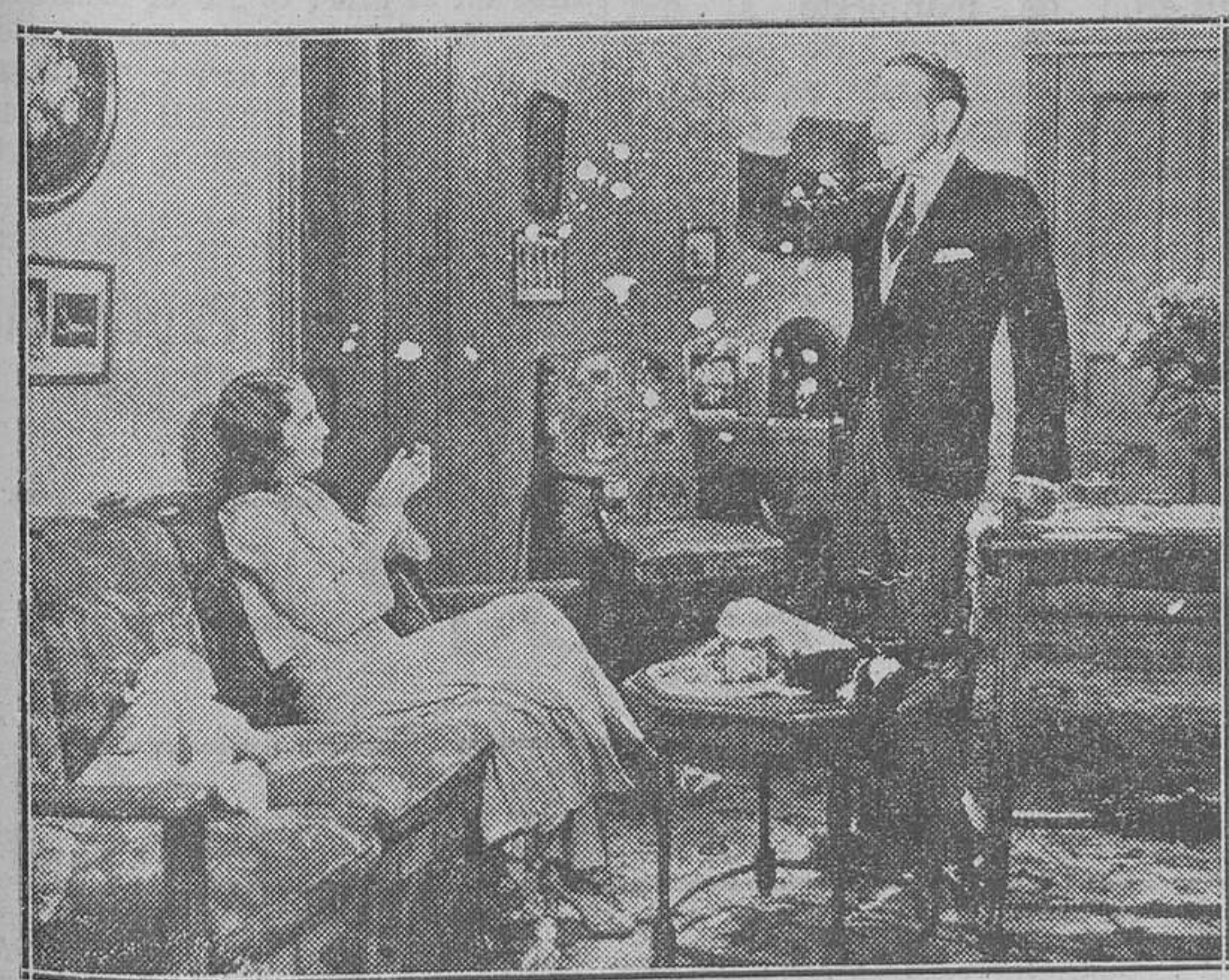
LIRICO.—Bárbara Stanwyck y Adolphe Menjou, dos artistas formidables de "Amor prohibido", grandioso éxito de ayer

"Los diablos de la cumbre", según el argumento del doctor Fanck, famoso por su "Tempestad en el Montblanch", es una película