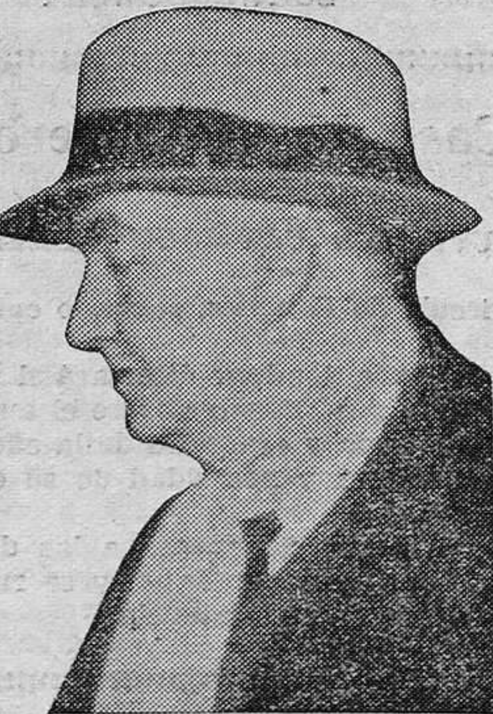
Mr. Edgar Wallace, el famoso novelista inglés, que ha fallecido en Hollywood