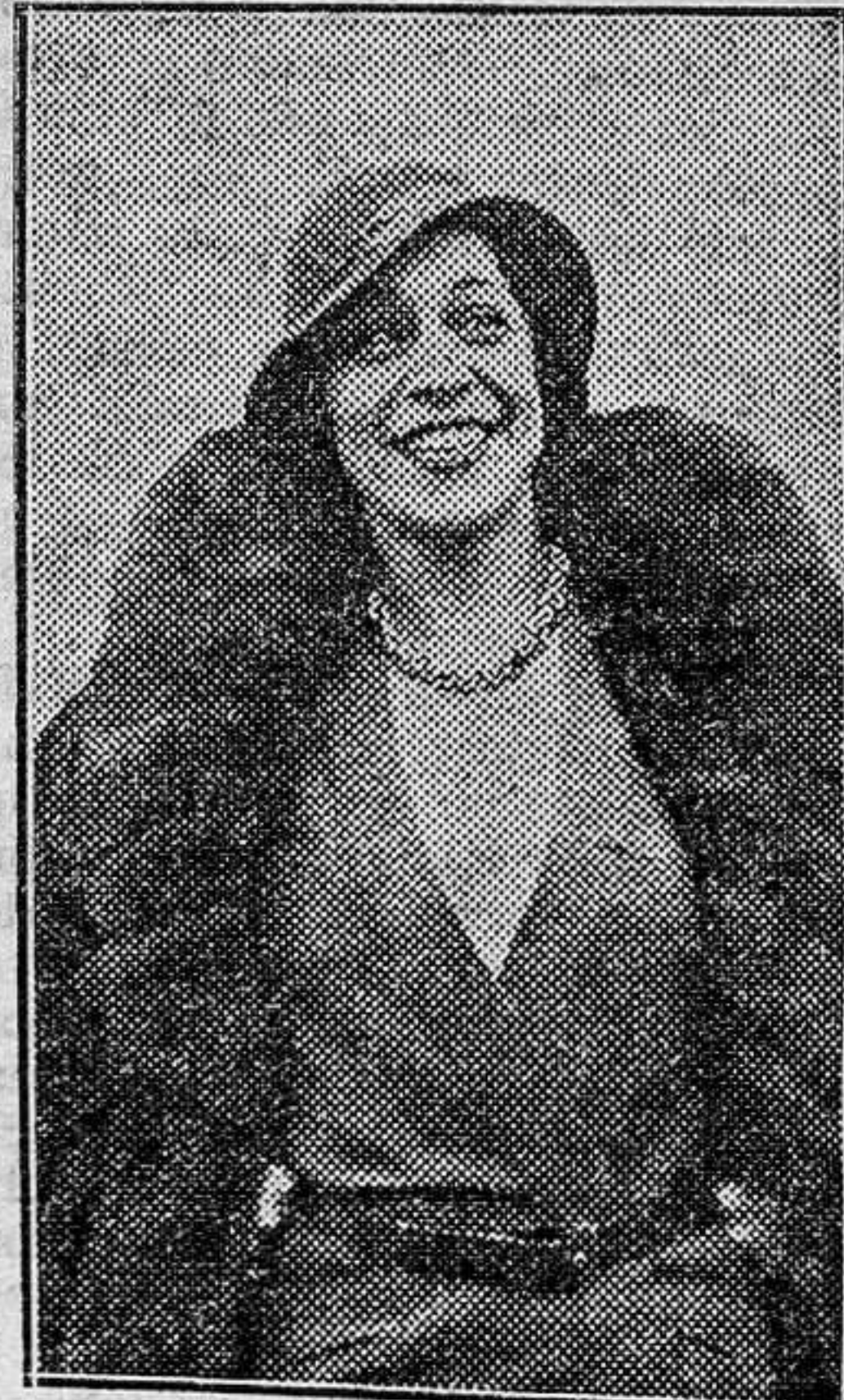
Una de las últimas fotografías de la famosa danzarina Antonia Mercé "La Argentina"