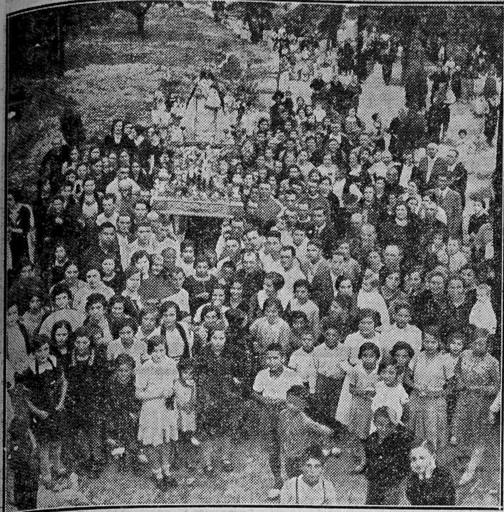
Conducción de la imagen de la Virgen del Castillo de su ermita a Chiva, con motivo de la Feria y fiestas celebradas en su honor