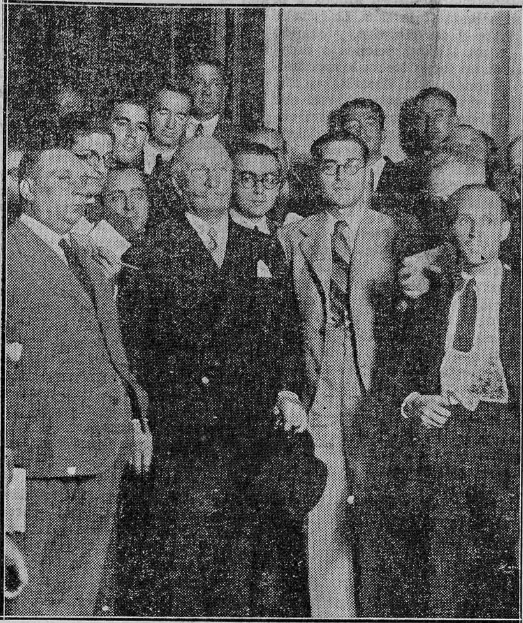
El señor Lerroux, rodeado de periodistas, al salir de Palacio