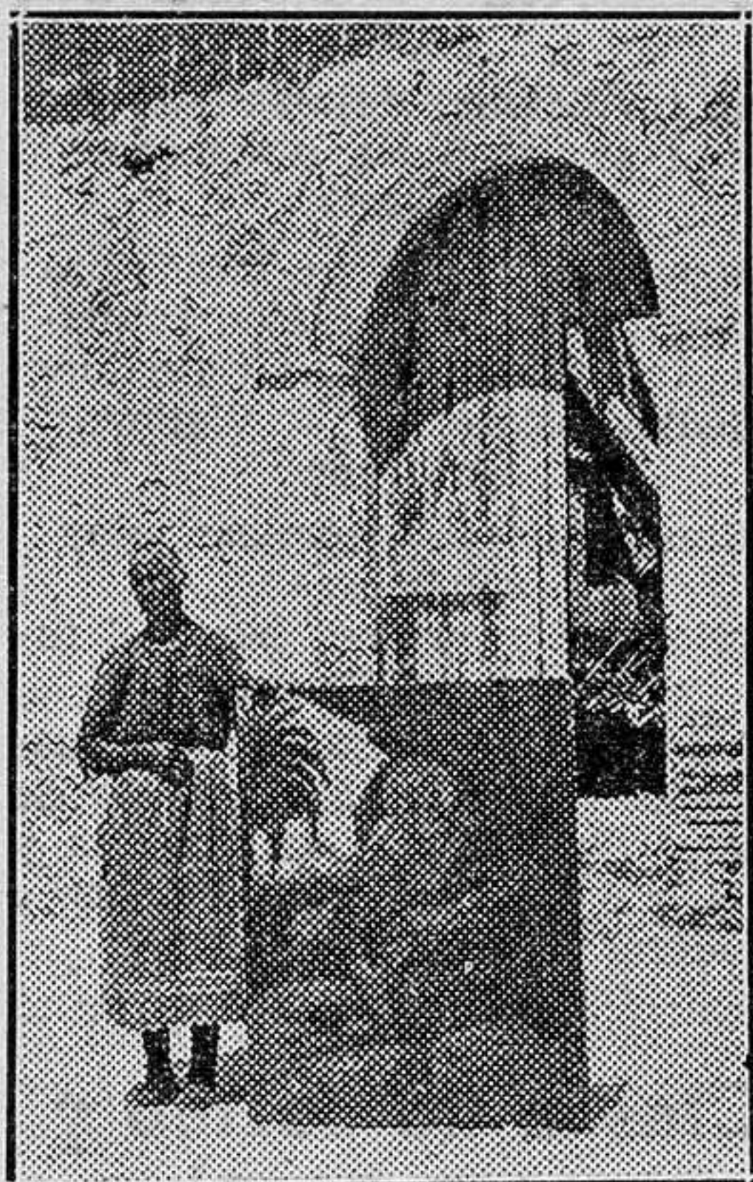
La ermitaña mostrando el cuadro de San Onofre